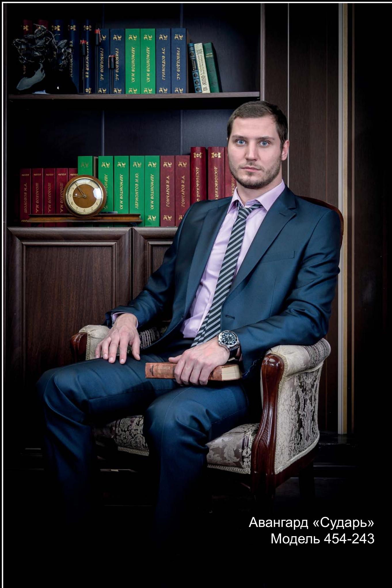
Авангард «Сударь» Модель 454-243