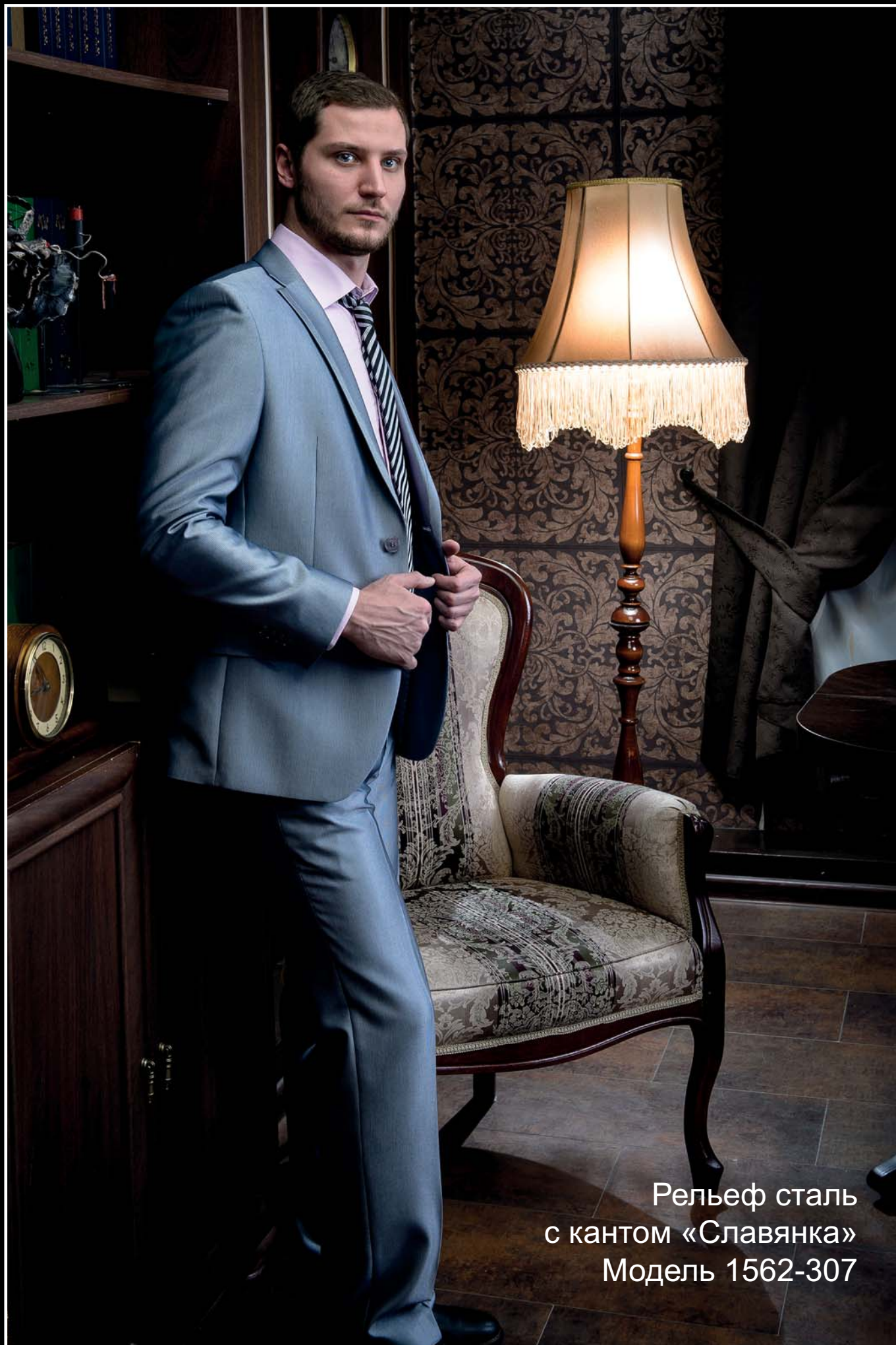
Рельеф сталь с кантом «Славянка» Модель 1562-307