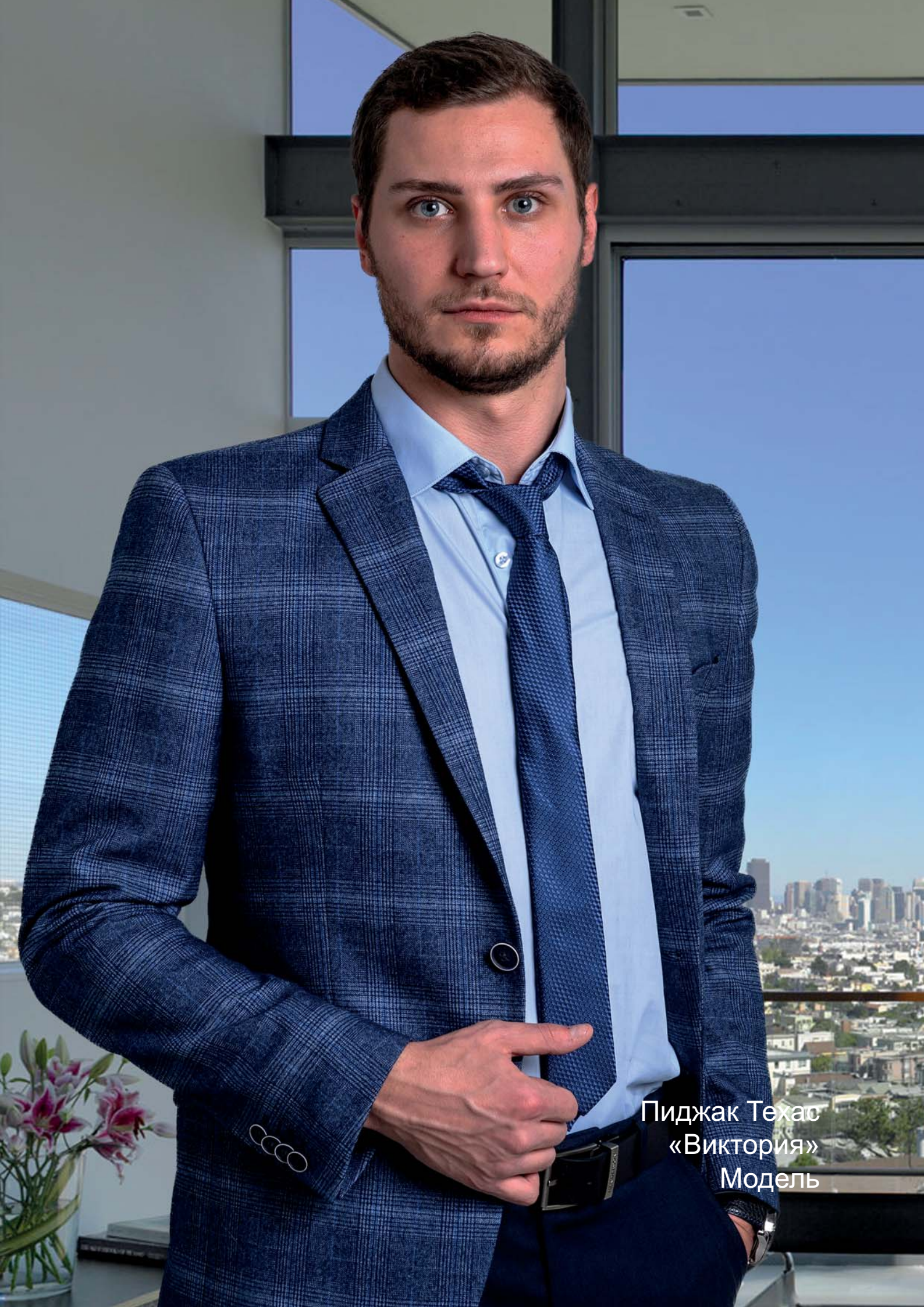
Пиджак Техас «Виктория» Модель