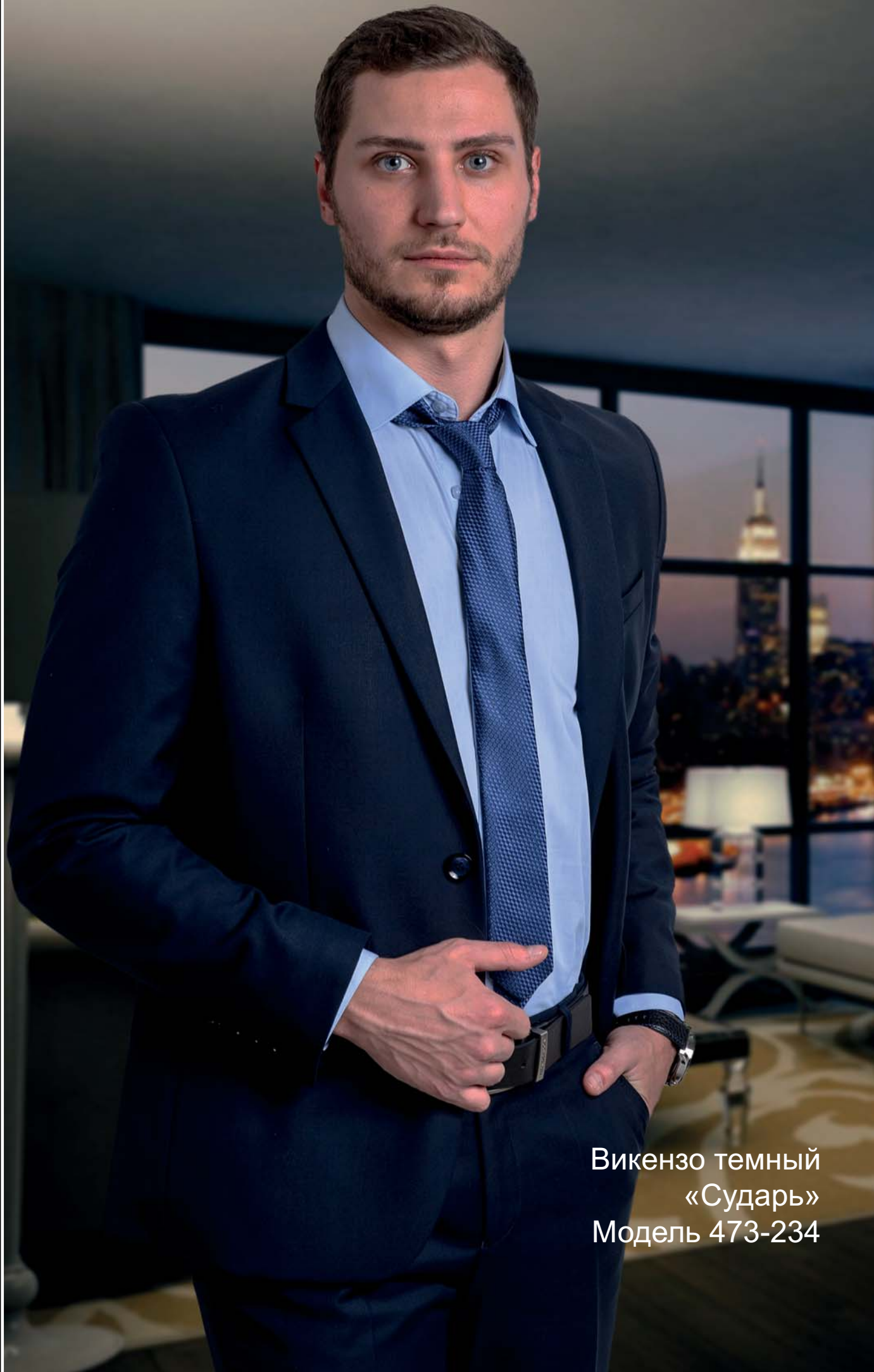
Викензо темный «Сударь» Модель 473-234