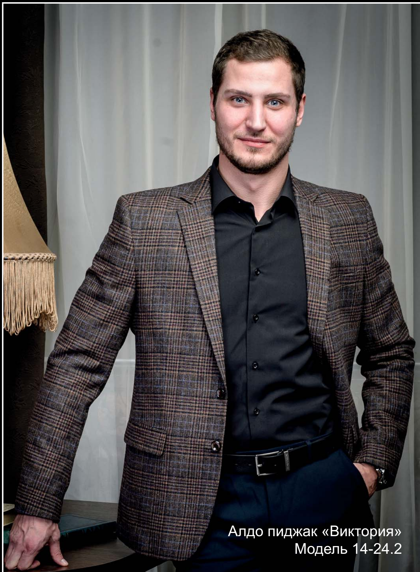
Алдо пиджак «Виктория» Модель 14-24.2