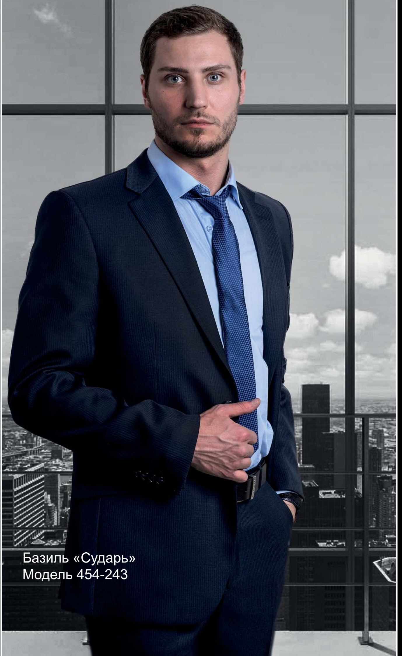
Базиль «Сударь» Модель 454-243