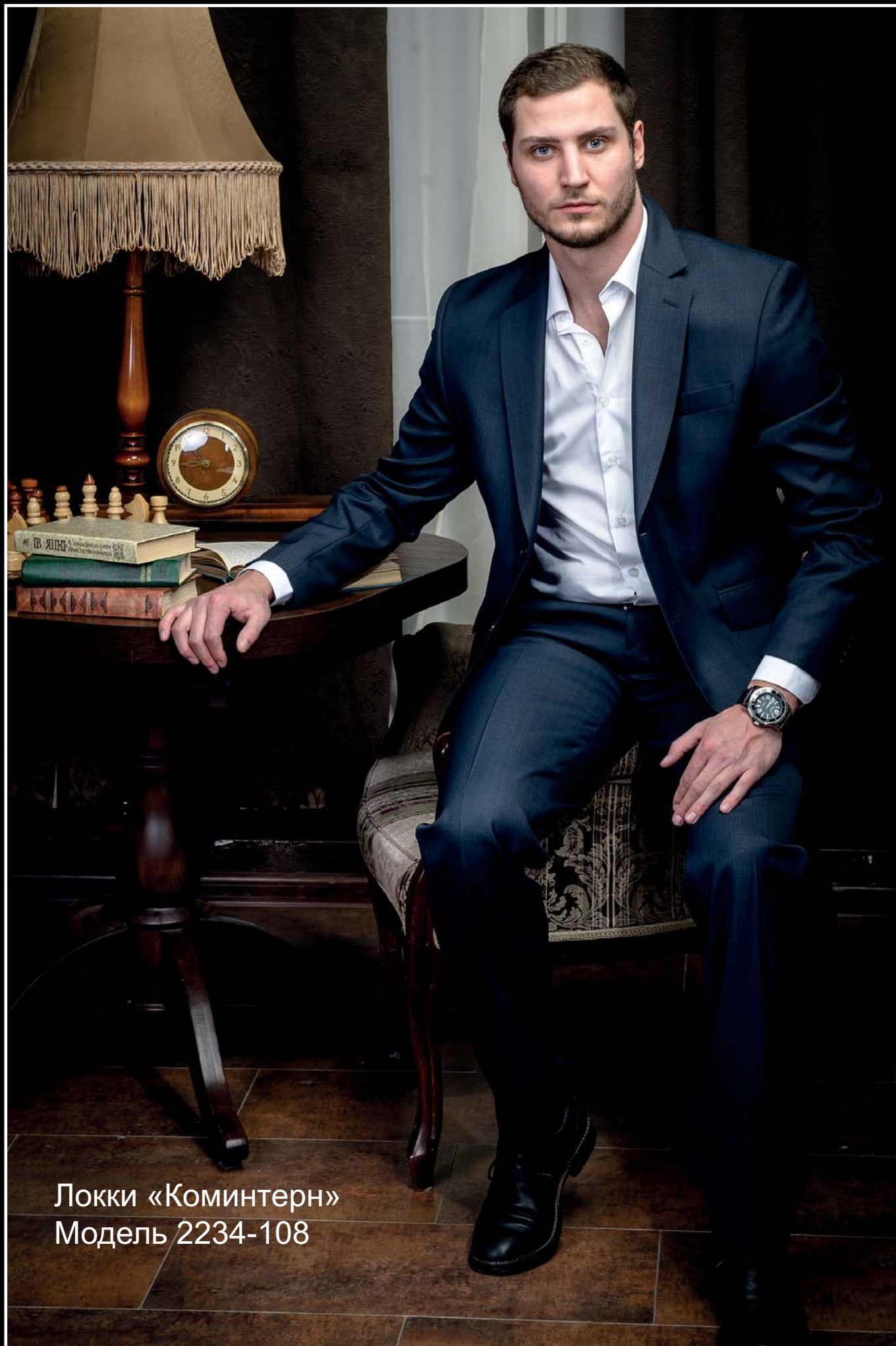
Локки «Коминтерн» Модель 2234-108