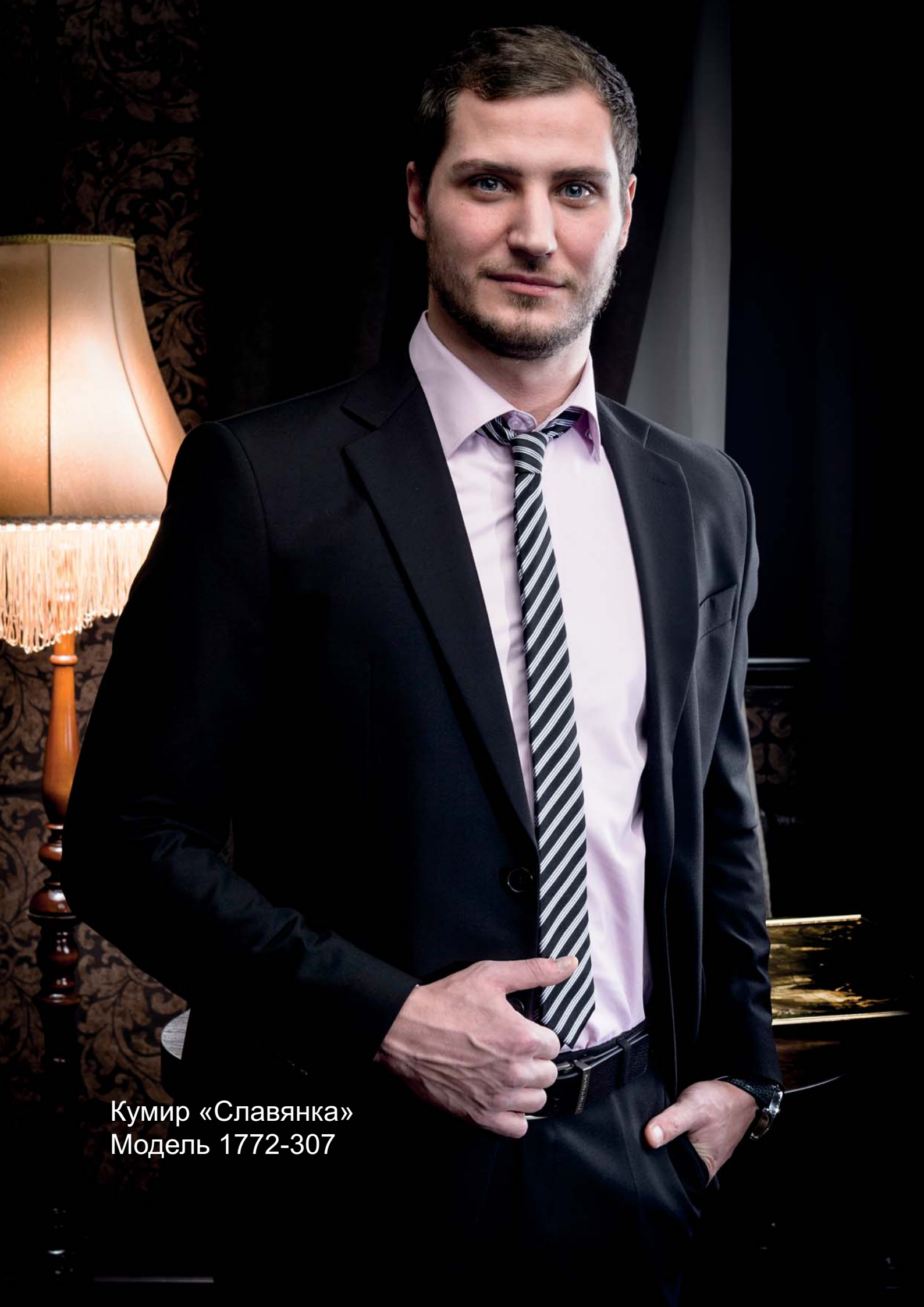
Кумир «Славянка» Модель 1772-307