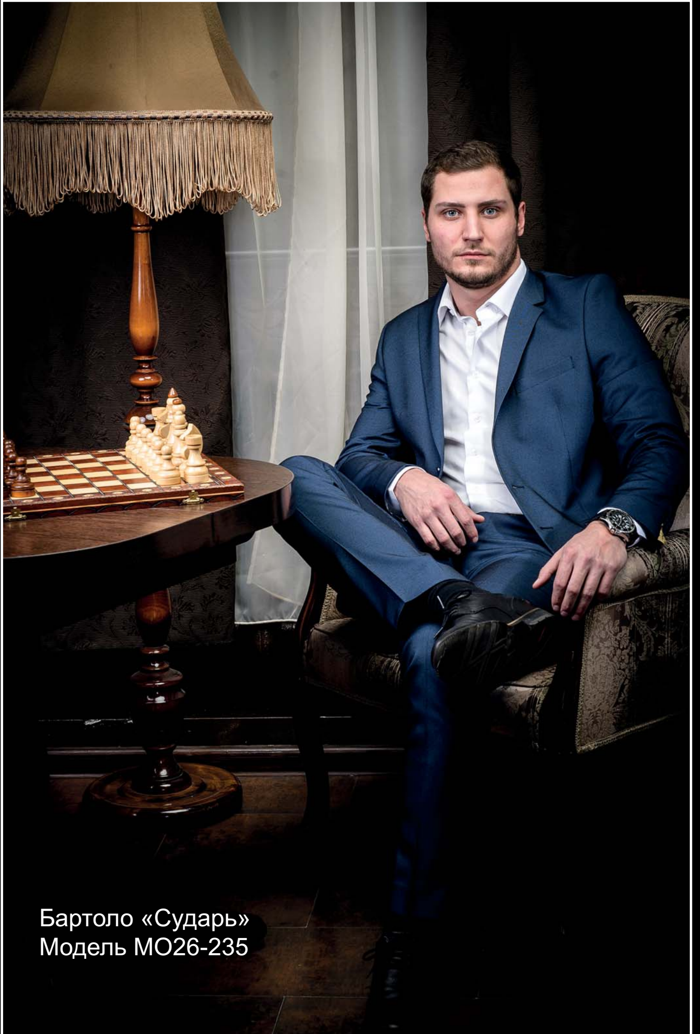
Бартоло «Сударь» Модель MO26-235