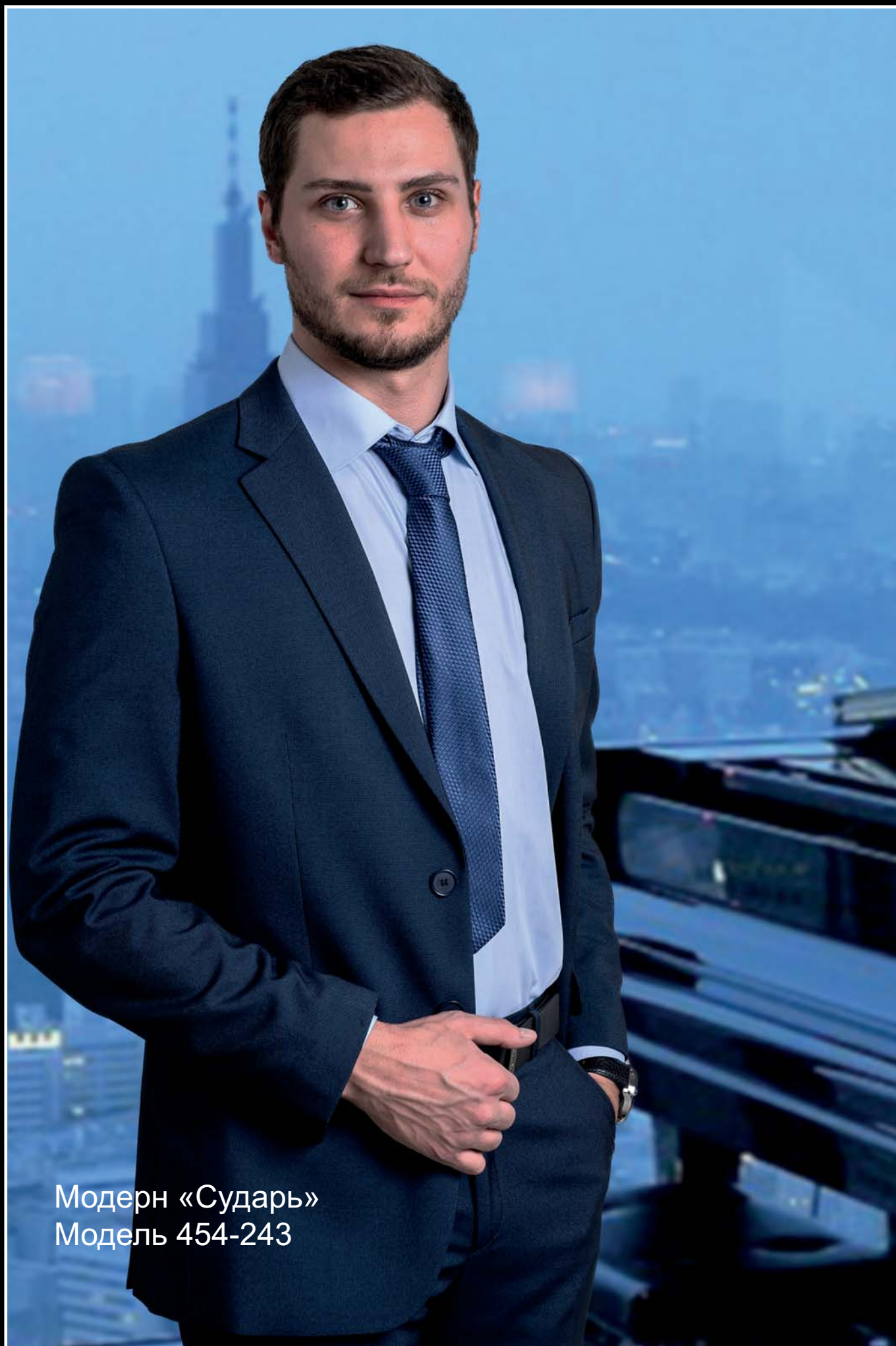
Модерн «Сударь» Модель 454-243