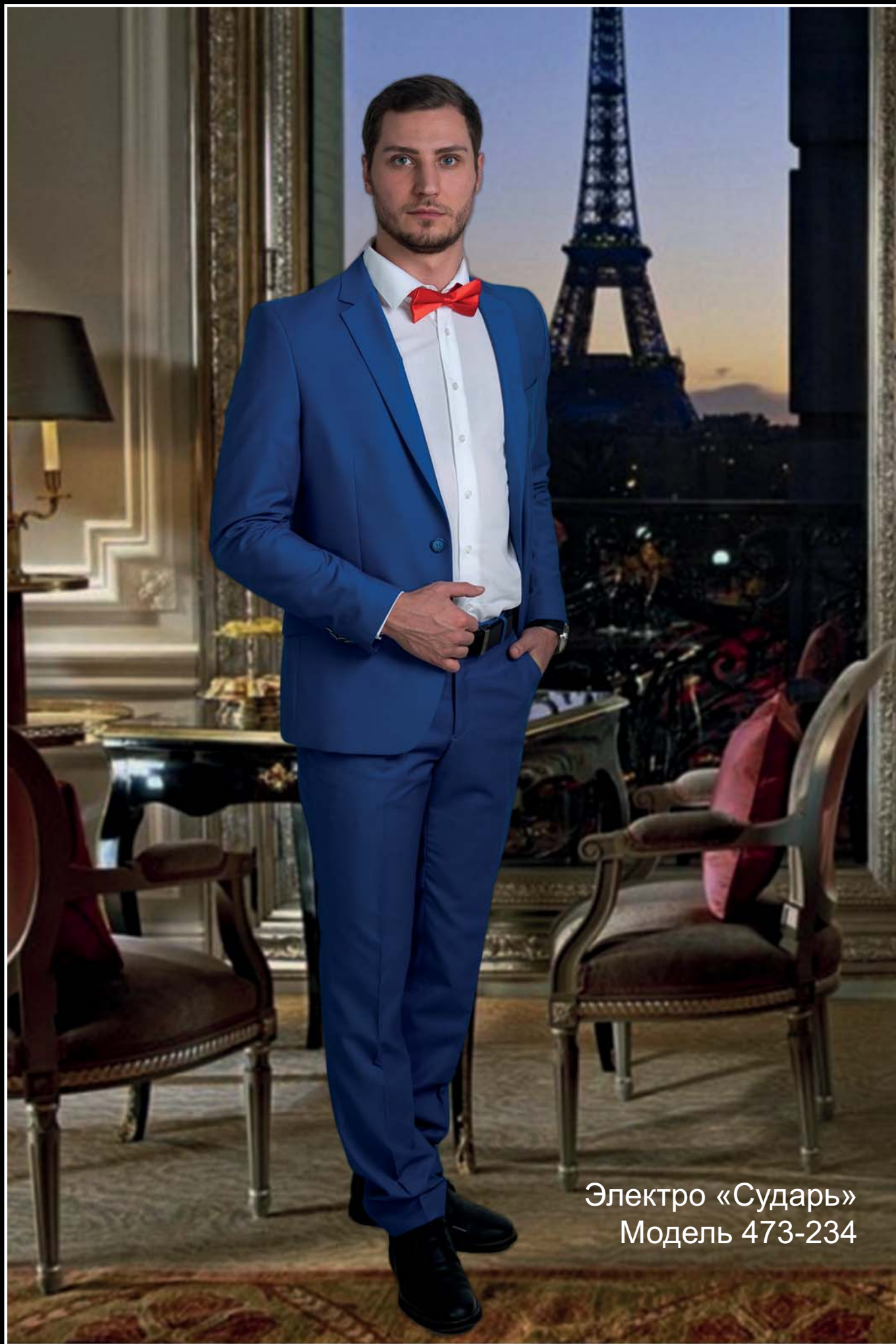
Электро «Сударь» Модель 473-234