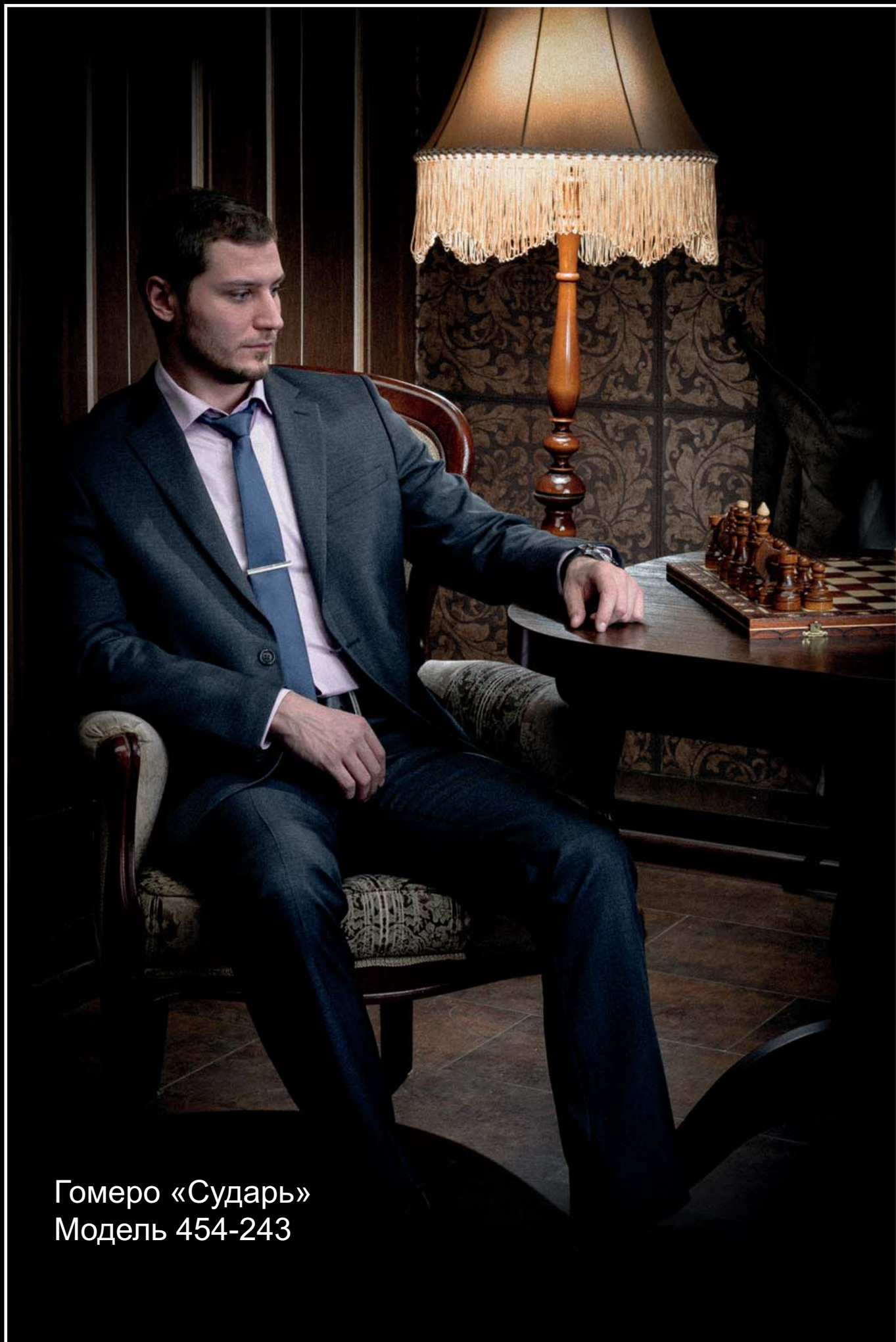
Гомеро «Сударь» Модель 454-243