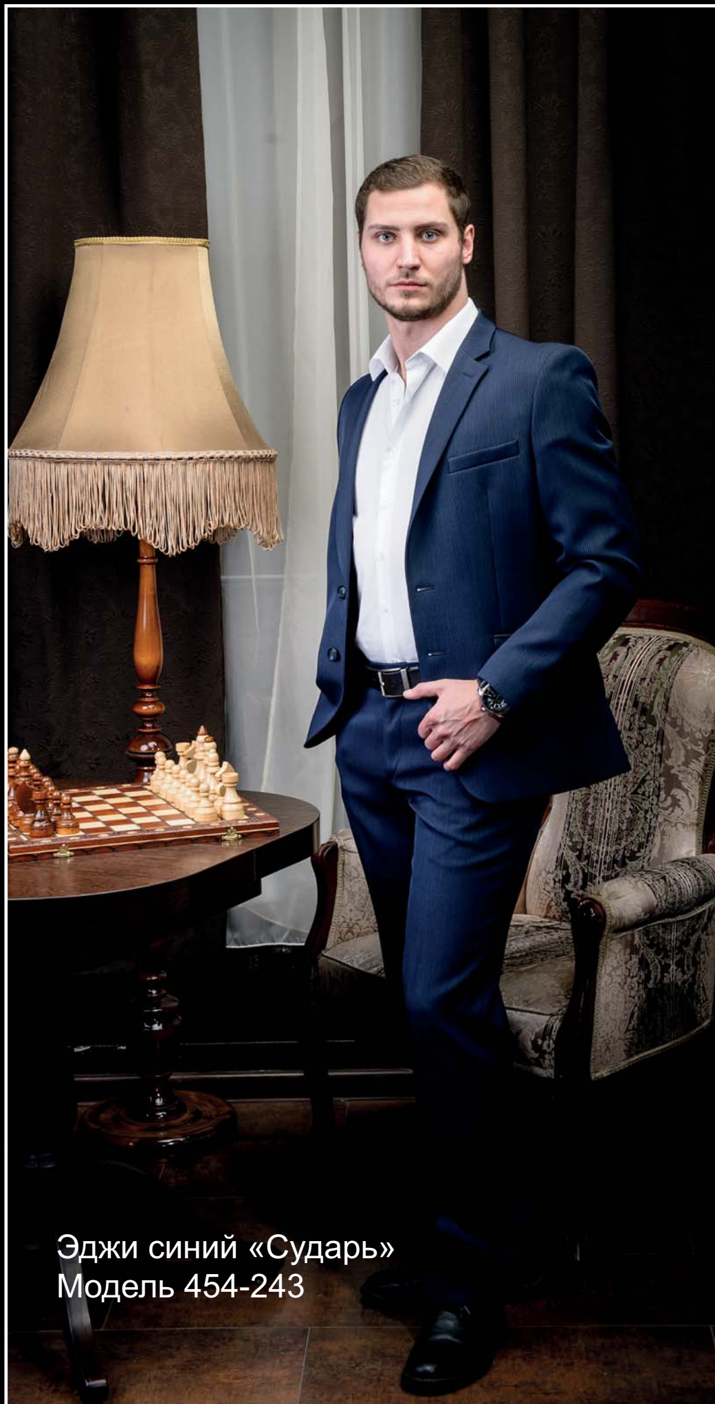
Эджи синий «Сударь» Модель 454-243