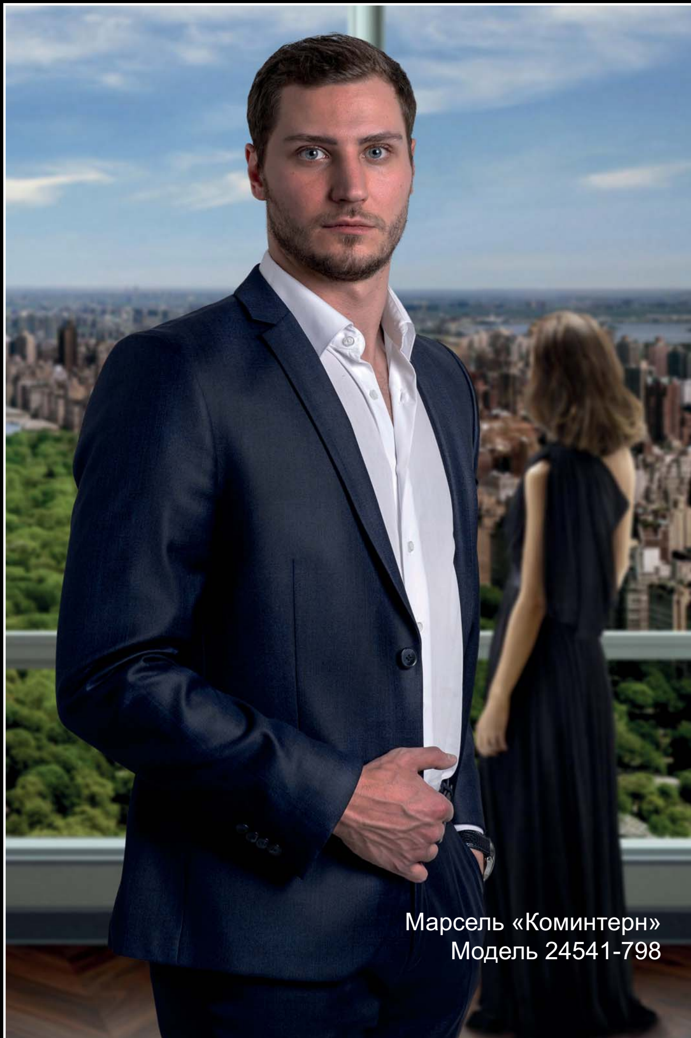
Марсель «Коминтерн» Модель 24541-798