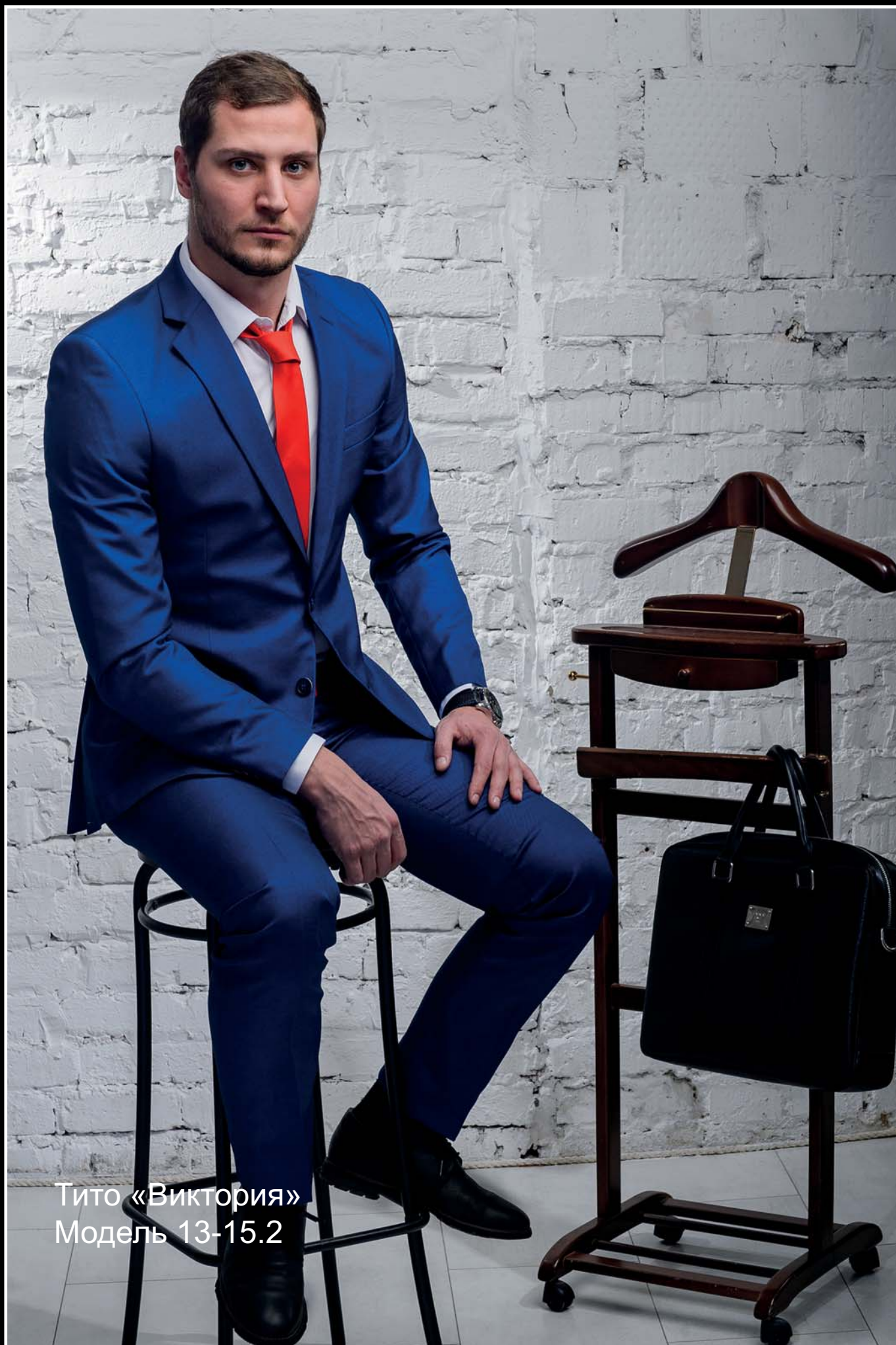
Тито «Виктория» Модель 13-15.2