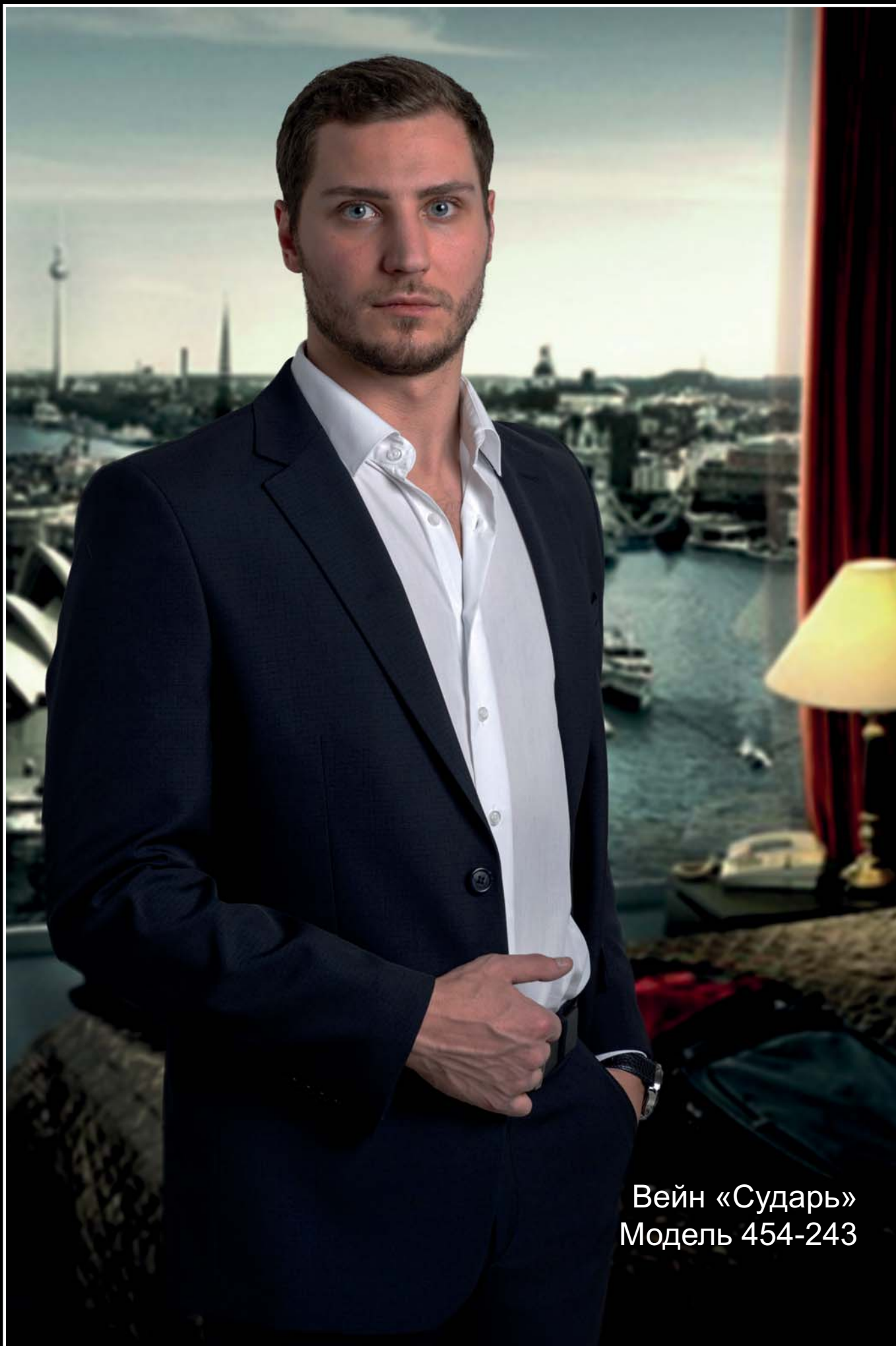
Вейн «Сударь» Модель 454-243