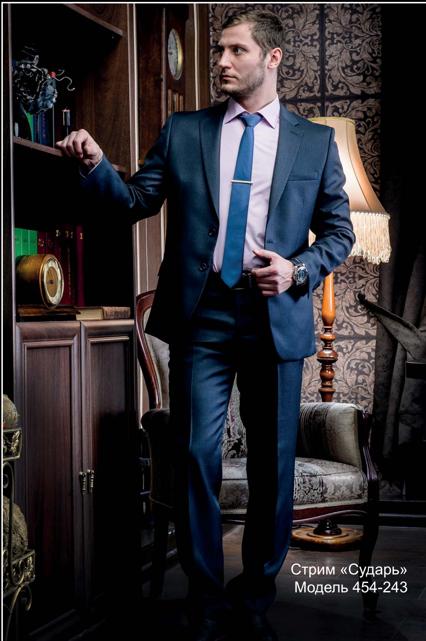
Стрим «Сударь» Модель 454-243