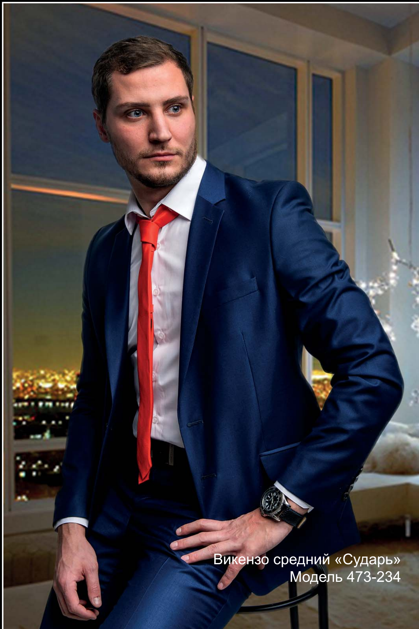
Викензо средний «Сударь» Модель 473-234