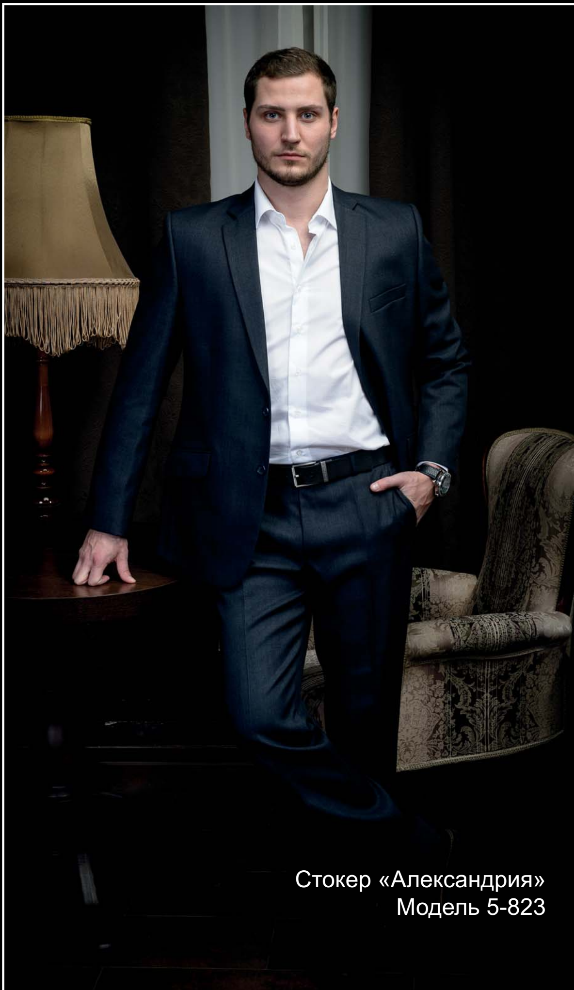
Стокер «Александрия» Модель 5-823