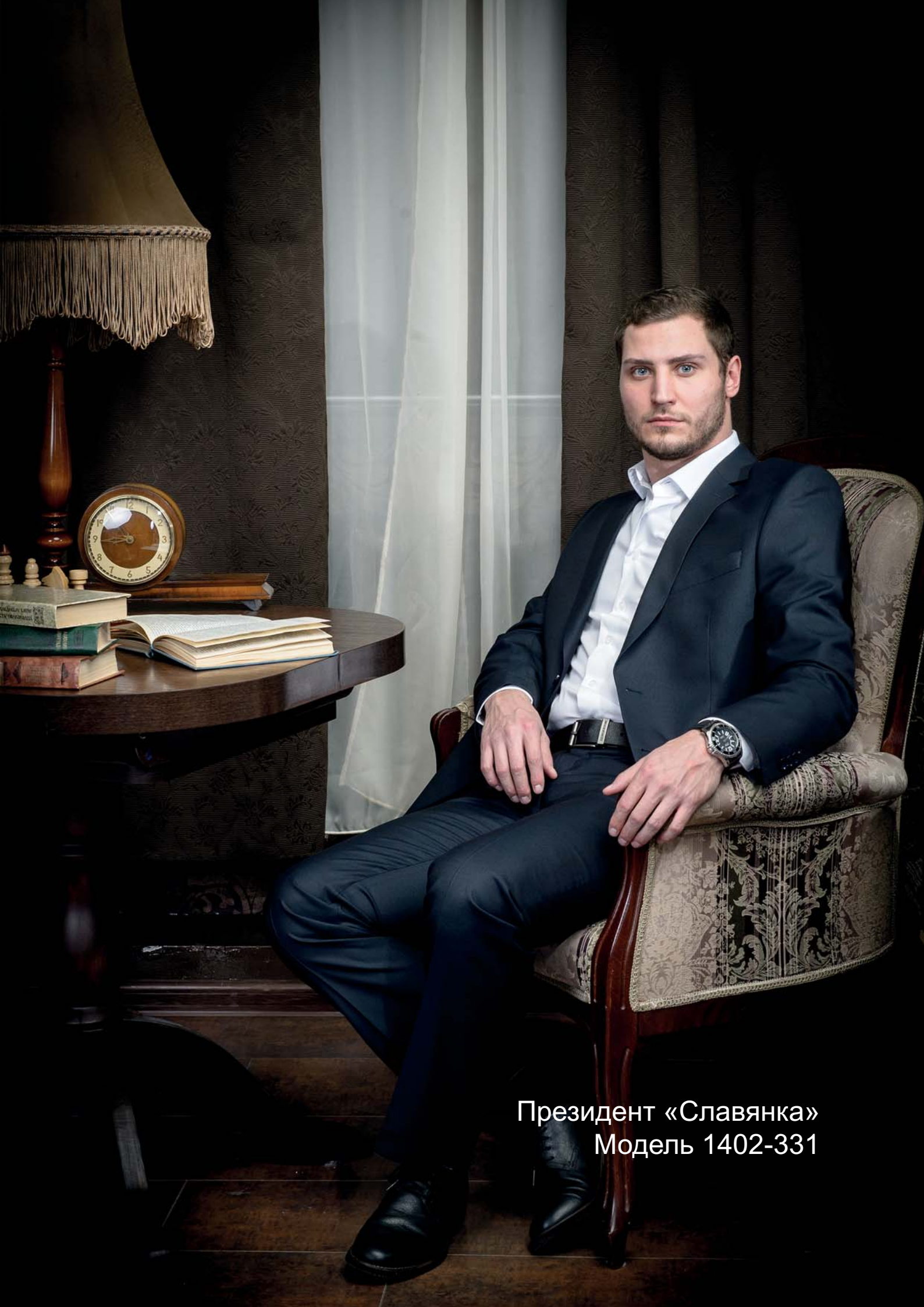
Президент «Славянка» Модель 1402-331