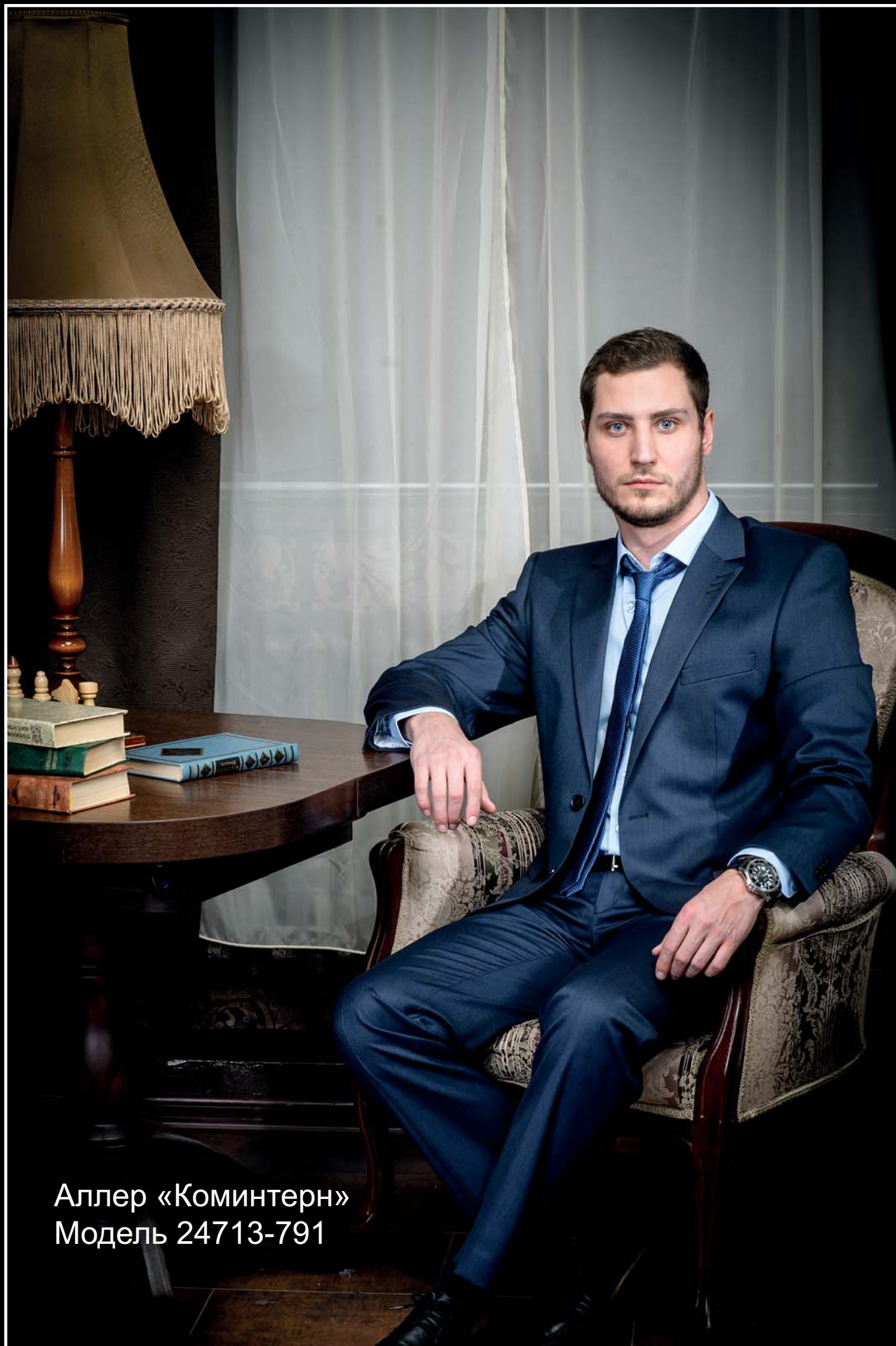
Аллер «Коминтерн» Модель 24713-791