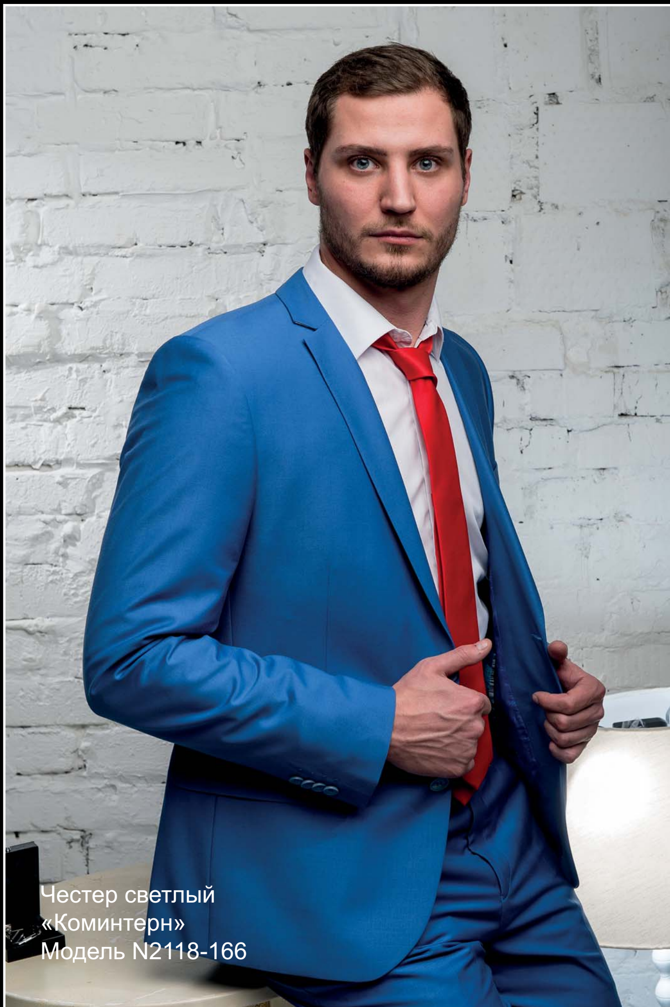
Честер светлый «Коминтерн» Модель N2118-166