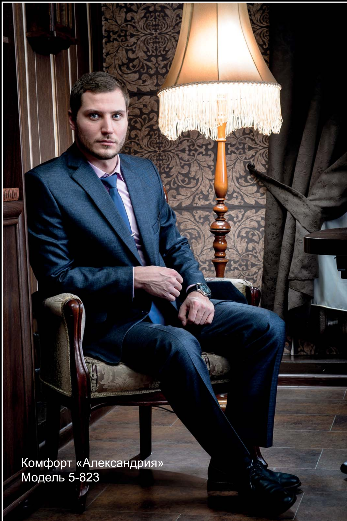
Комфорт «Александрия» Модель 5-823