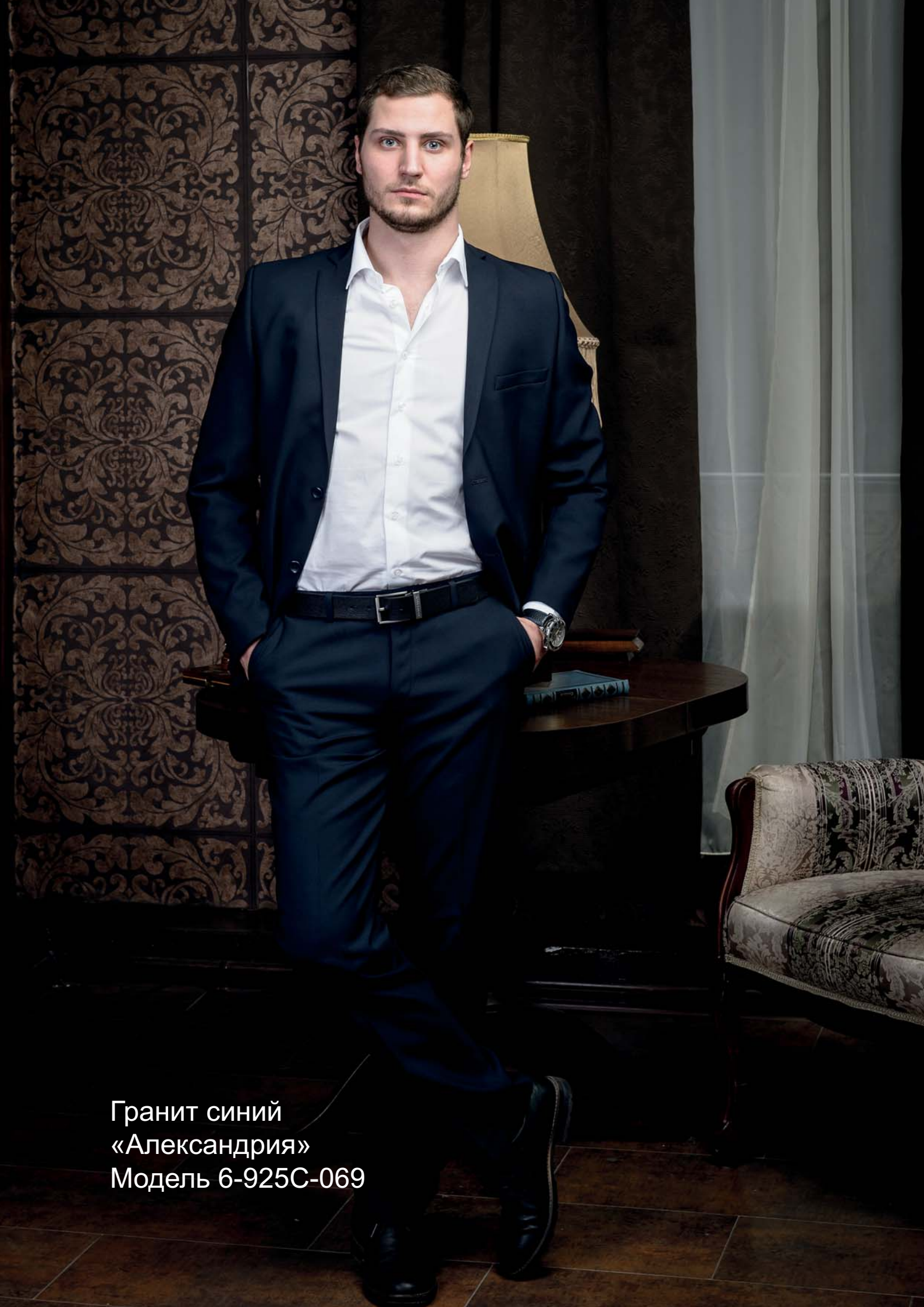
Гранит синий «Александрия» Модель 6-925С-069