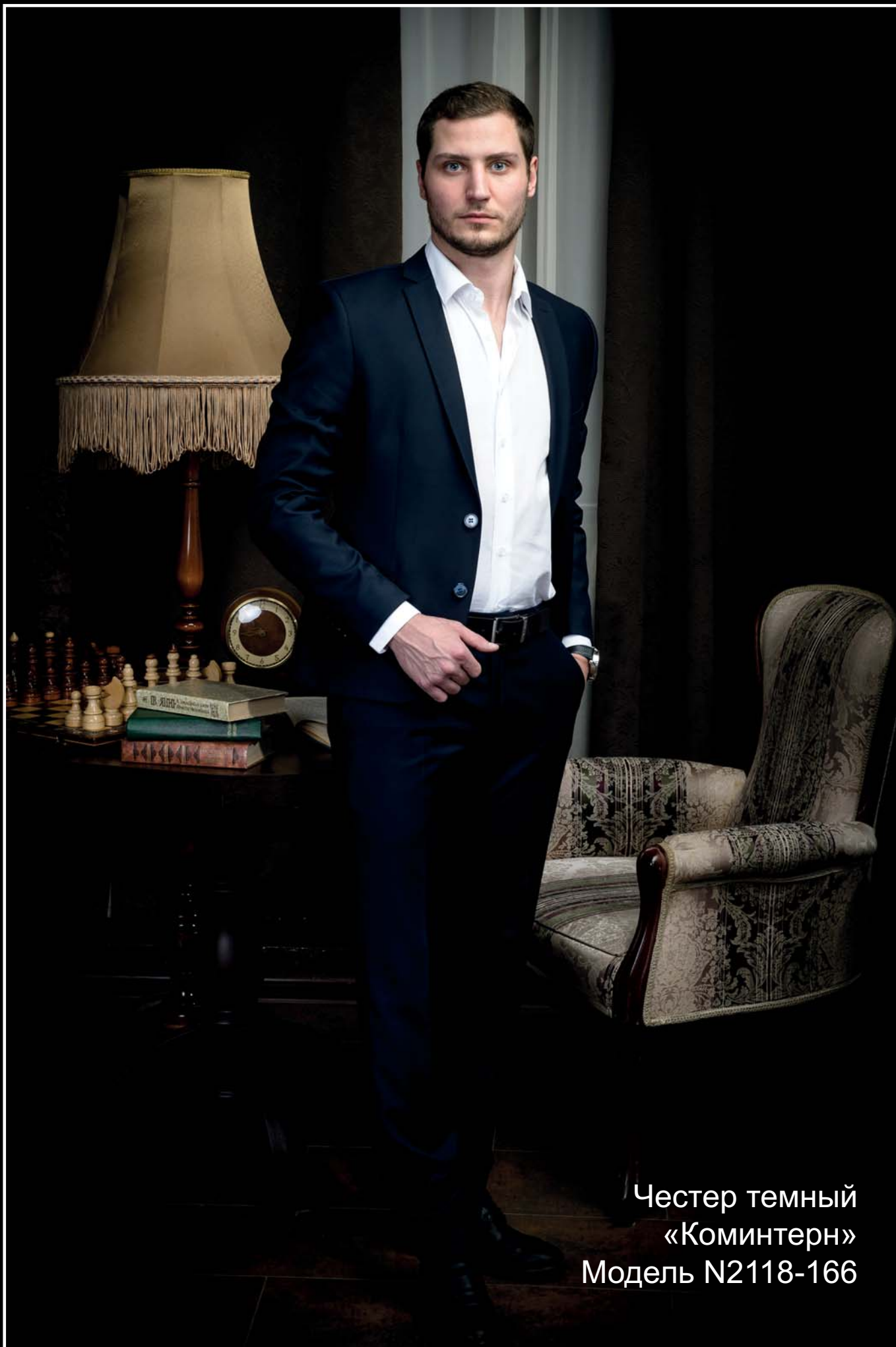
Честер темный «Коминтерн» Модель N2118-166