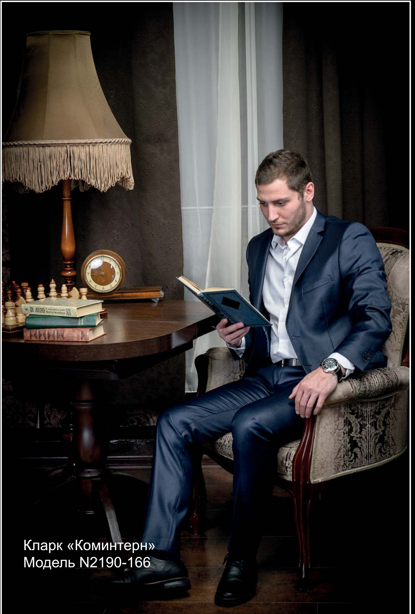
Кларк «Коминтерн» Модель N2190-166