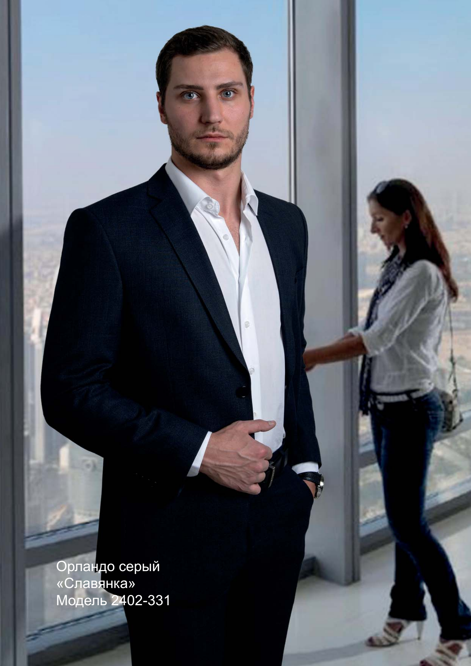
Орландо серый «Славянка» Модель 2402-331