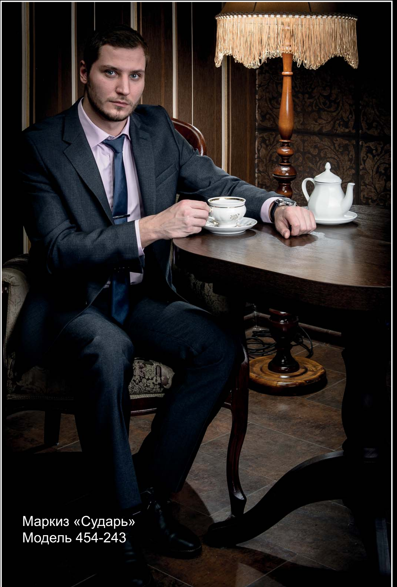
Маркиз «Сударь» Модель 454-243