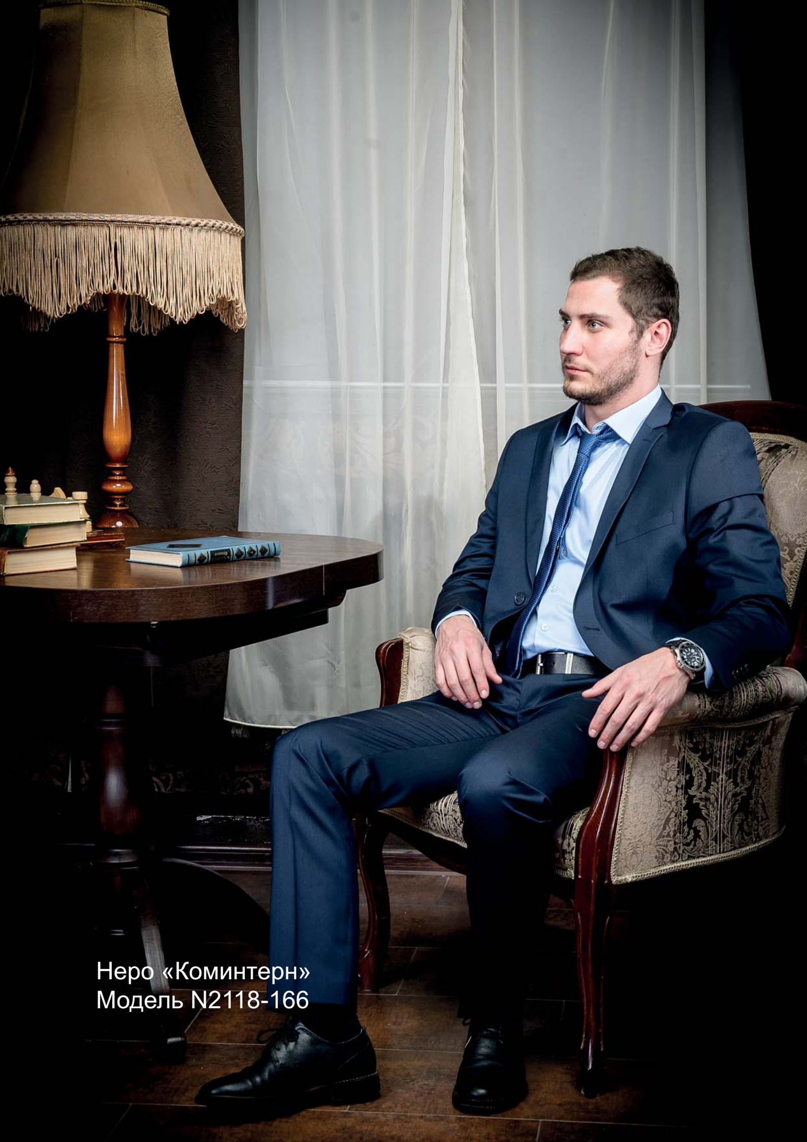
Неро «Коминтерн» Модель N2118-166