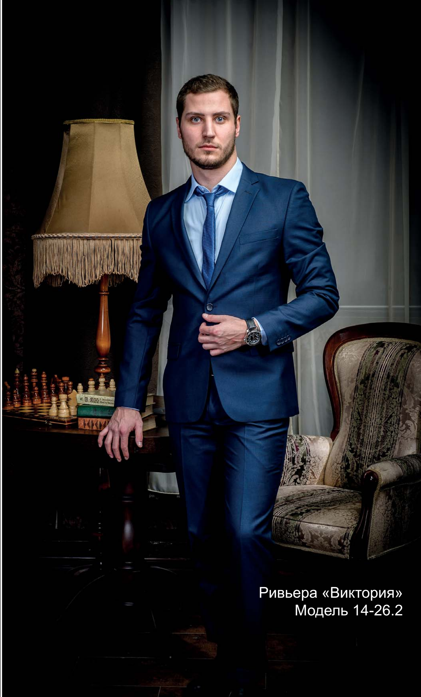
Ривьера «Виктория» Модель 14-26.2