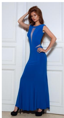
«Три луча» Состав: 55% вискоза 45% акрил Размер : S M L Опт: 1440р.