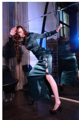
«Ника long» Состав: 53% ПЭ 42% нейлон 3% спандекс Размер : S M L Опт: 1000р.