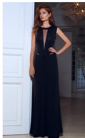
«Три луча» Состав: 55% вискоза 45% акрил Размер : S M L Опт: 1440р.