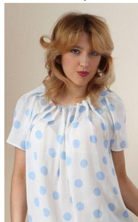
«Горошек» Состав: 100% ПЭ Размер : S M L Опт: 598р.