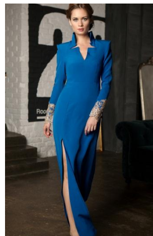
«Вамп» Состав: Костюмный креп 97% ПЭ 3% эластан Размер : S M L Опт: 2000р.