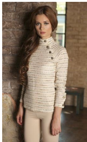
«Джемпер» Состав: 60% шерсть 37% акрил 3% эластан Размер : S M L Опт: 1200р.