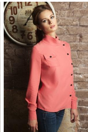
«Блуза на кнопках» Состав: 100% вискоза Размер : S M L Опт: 1400р.