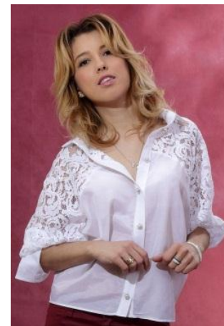
«Летучая мышь» Состав: 70% хлопок 30%шёлк Размер : S M L Опт: 750р.