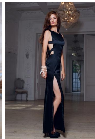
«Артемиды» Состав: 50% хлопок 47% ПЭ 3% эластан Размер : S M L Опт: 1500р.