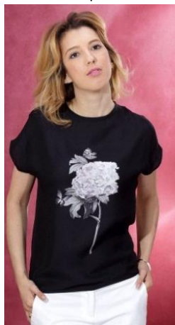
«Цветок» Состав: 100% ПЭ Размер : S M L Опт: 700р.