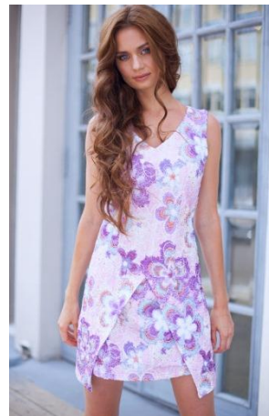
«Аватар» Состав: 100% ПЭ Размер : S M L Опт: 1380р.