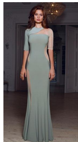
«Вестетика» Состав: 55% вискоза 45% акрил Размер : S M L Опт: 1500р.