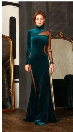
«Вестетика бархат» Состав: 90% ПЭ 10% эластан Размер : S M L Опт: 2000р.