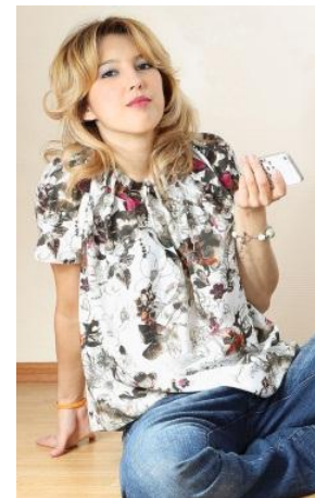
«Топ с защипами» Состав: 100% ПЭ Размер : S M L Опт: 598р.