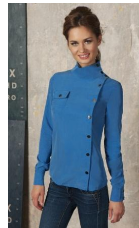
«Блуза на кнопках» Состав: 100% вискоза Размер : S M L Опт: 1400р.