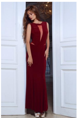
«Три луча» Состав: 55% вискоза 45% акрил Размер : S M L Опт: 1440р.