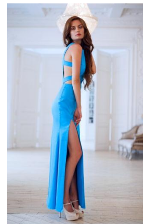
«Артемиды» Состав: 50% хлопок 47% ПЭ 3% эластан Размер : S M L Опт: 1500р.