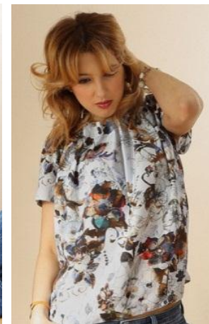
«Топ с защипами» Состав: 100% ПЭ Размер : S M L Опт: 598р.