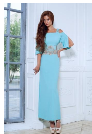
«Афродита» Состав: Плательный креп 100% ПЭ Размер : S M L Опт: 2000р.