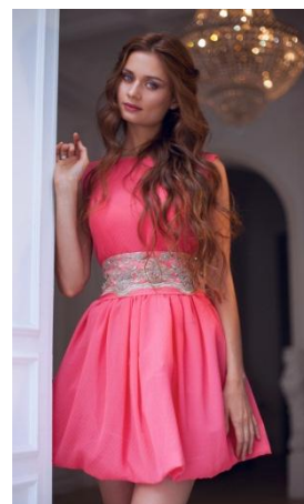
«Одри лето» Состав: Шифон 100% ПЭ Кружево Размер : S M L Опт: 2000р.