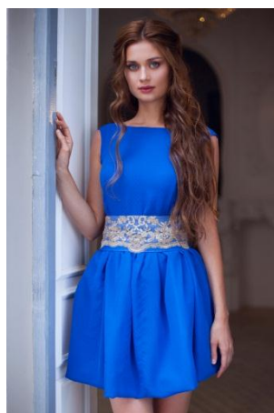
«Одри лето» Состав: Шифон 100% ПЭ Кружево Размер : S M L Опт: 2000р.