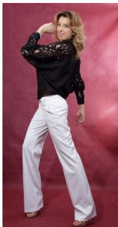
«Летучая мышь» Состав: 70% хлопок 30%шёлк Размер : S M L Опт: 750р.