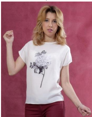
«Цветок» Состав: 100% ПЭ Размер : S M L Опт: 700р.