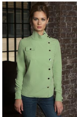
«Блуза на кнопках» Состав: 100% вискоза Размер : S M L Опт: 1400р.