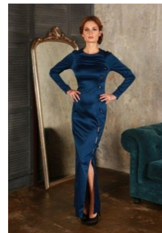
«Ника long» Состав: 53% ПЭ 42% нейлон 3% спандекс Размер : S M L Опт: 1000р.