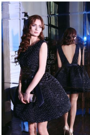
«Одри» Состав: 100% ПЭ Размер : S M L Опт: 2500р.