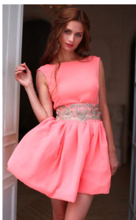
«Одри лето» Состав: Шифон 100% ПЭ Кружево Размер : S M L Опт: 2000р.