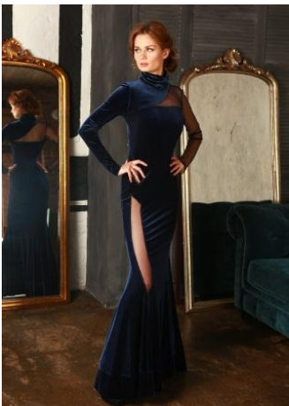
«Вестетика бархат» Состав: 90% ПЭ 10% эластан Размер : S M L Опт: 2000р.