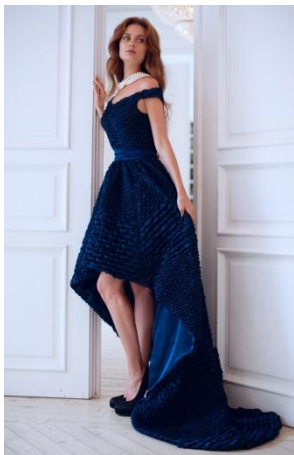
«Триумф люкс» Состав: 100% ПЭ Размер : S M L Опт: 7000р.