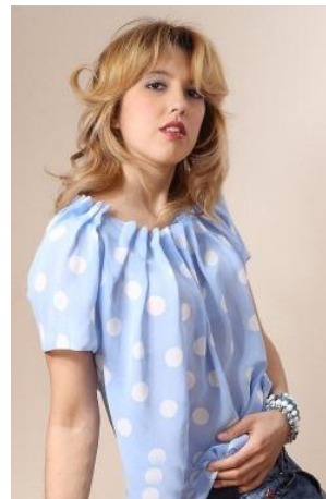
«Горошек» Состав: 100% ПЭ Размер : S M L Опт: 598р.