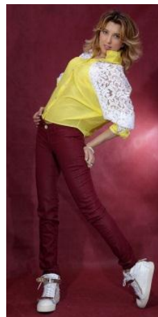
«Летучая мышь» Состав: 70% хлопок 30%шёлк Размер : S M L Опт: 750р.