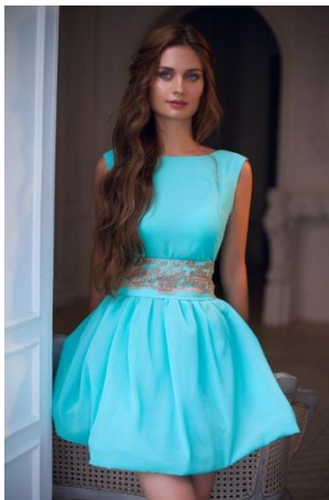
«Одри лето» Состав: Шифон 100% ПЭ Кружево Размер : S M L Опт: 2000р.