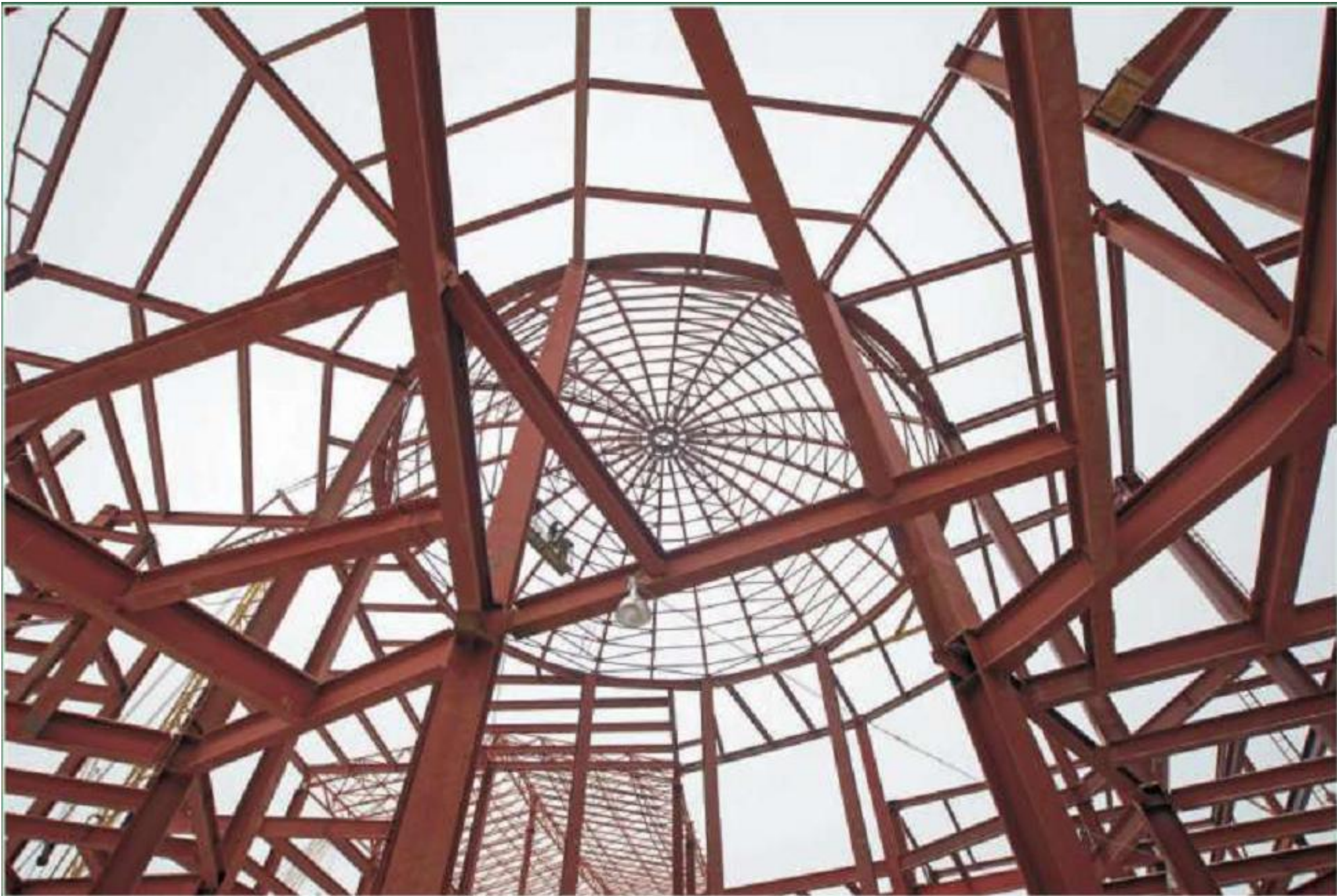
Купол корпуса МГТРК «Сити Молл Белгородский»