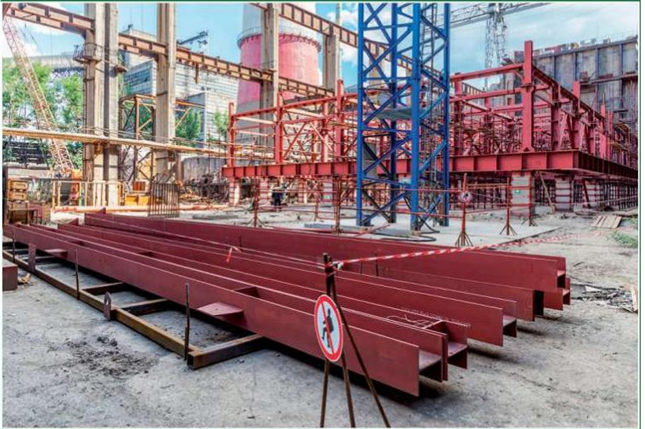
Реконструкция блока №7 Славянской ТЭС (Украина)