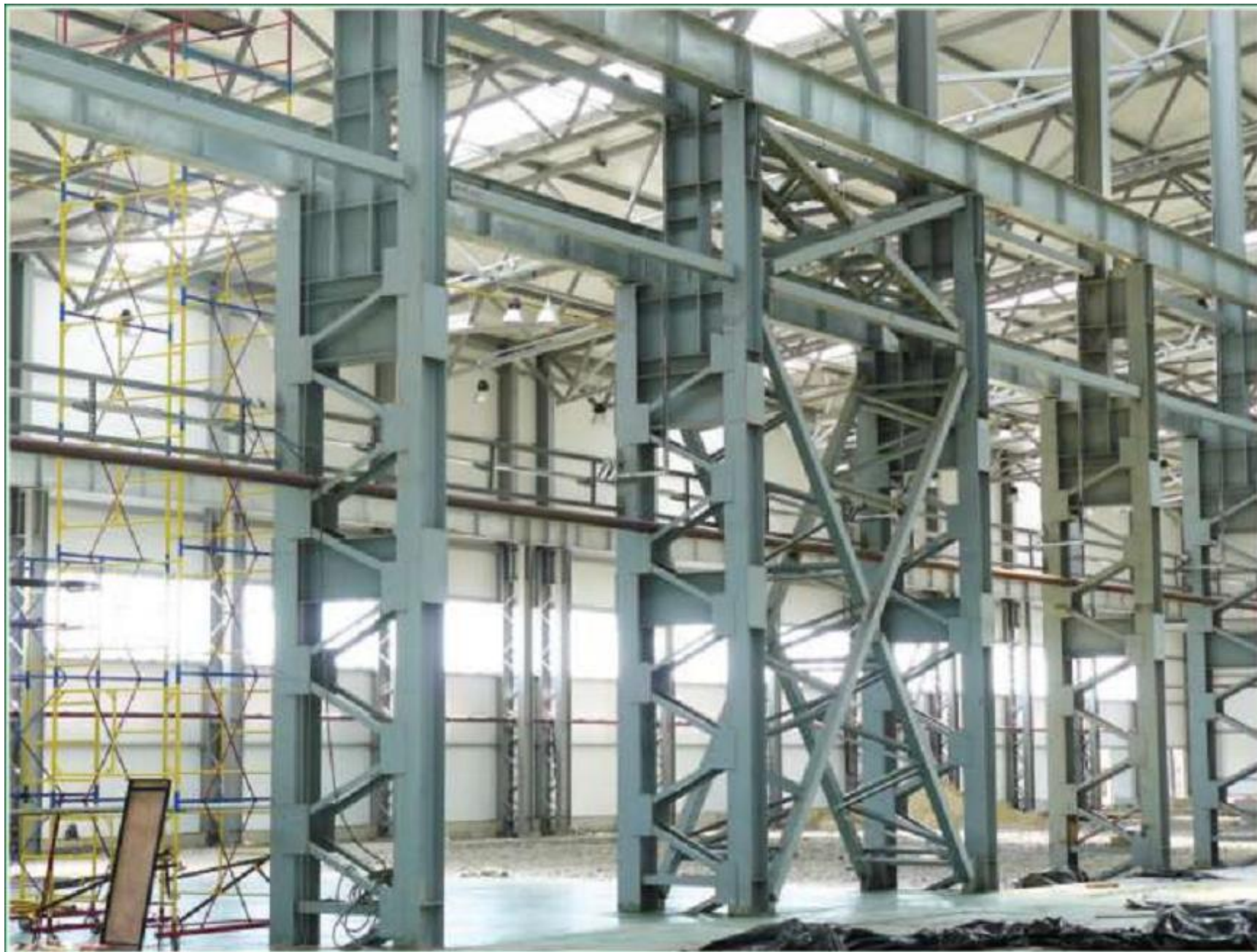
Металлоконструкции производственного корпуса для изготовления сэндвич-панелей