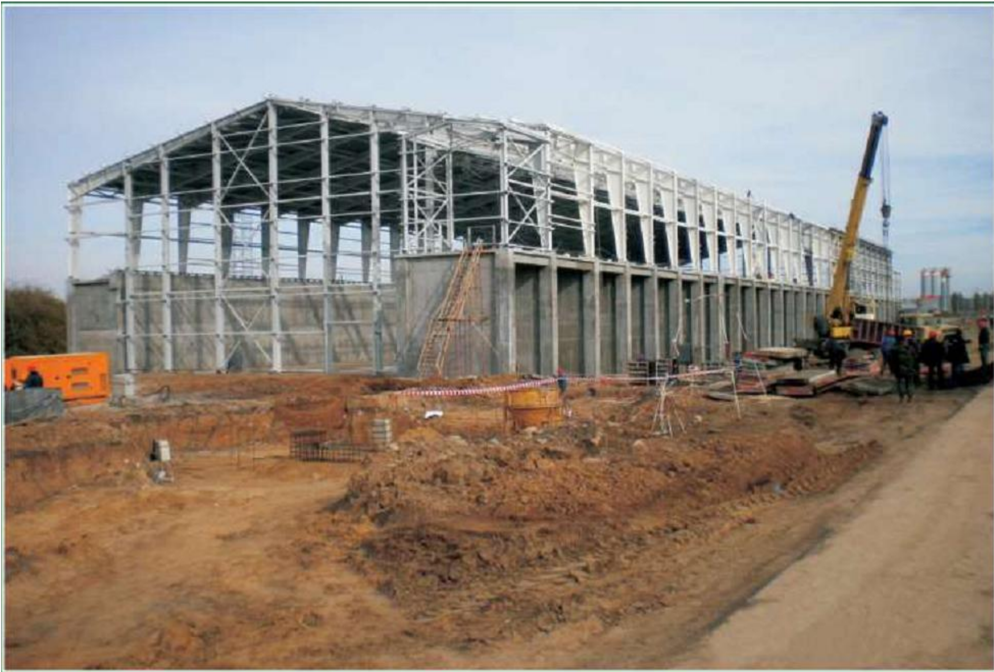
Центральный завод в Воронежской области 132 Склад и конвейерные галереи мергеля, 2010 год