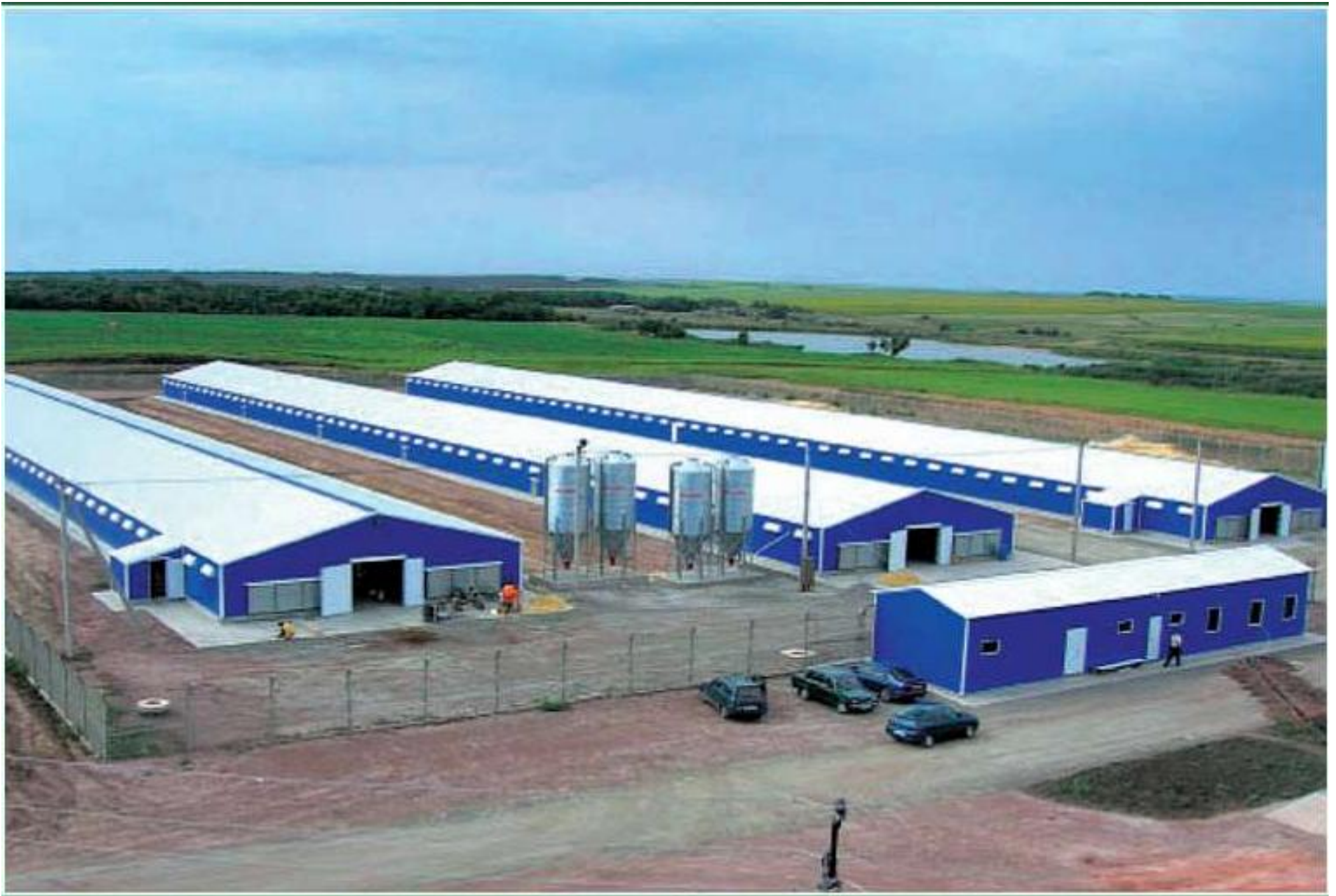
Строительство птицеводческого комплекса по выращиванию индейки компании Евродон (г. Шахты, Ростовской области)