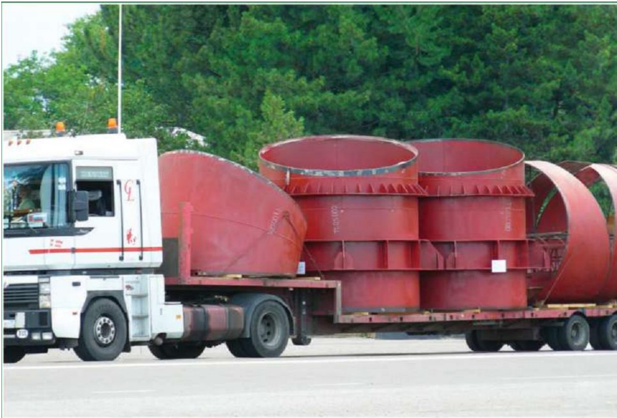
Доска металлоконструкций газоходов ГТ ТЭЦ Ожно-Приобского месторождения, 2009 год