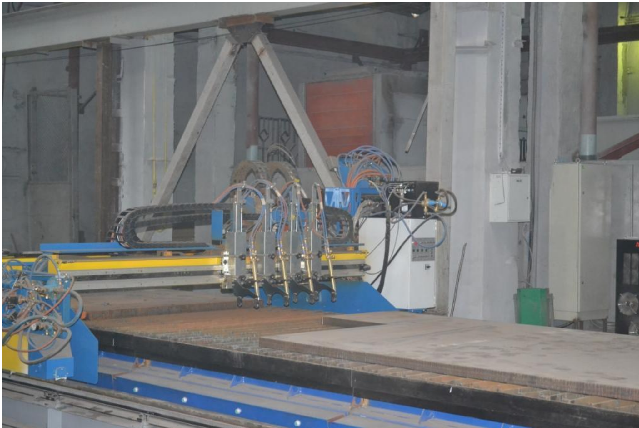
Установка плазменное резки