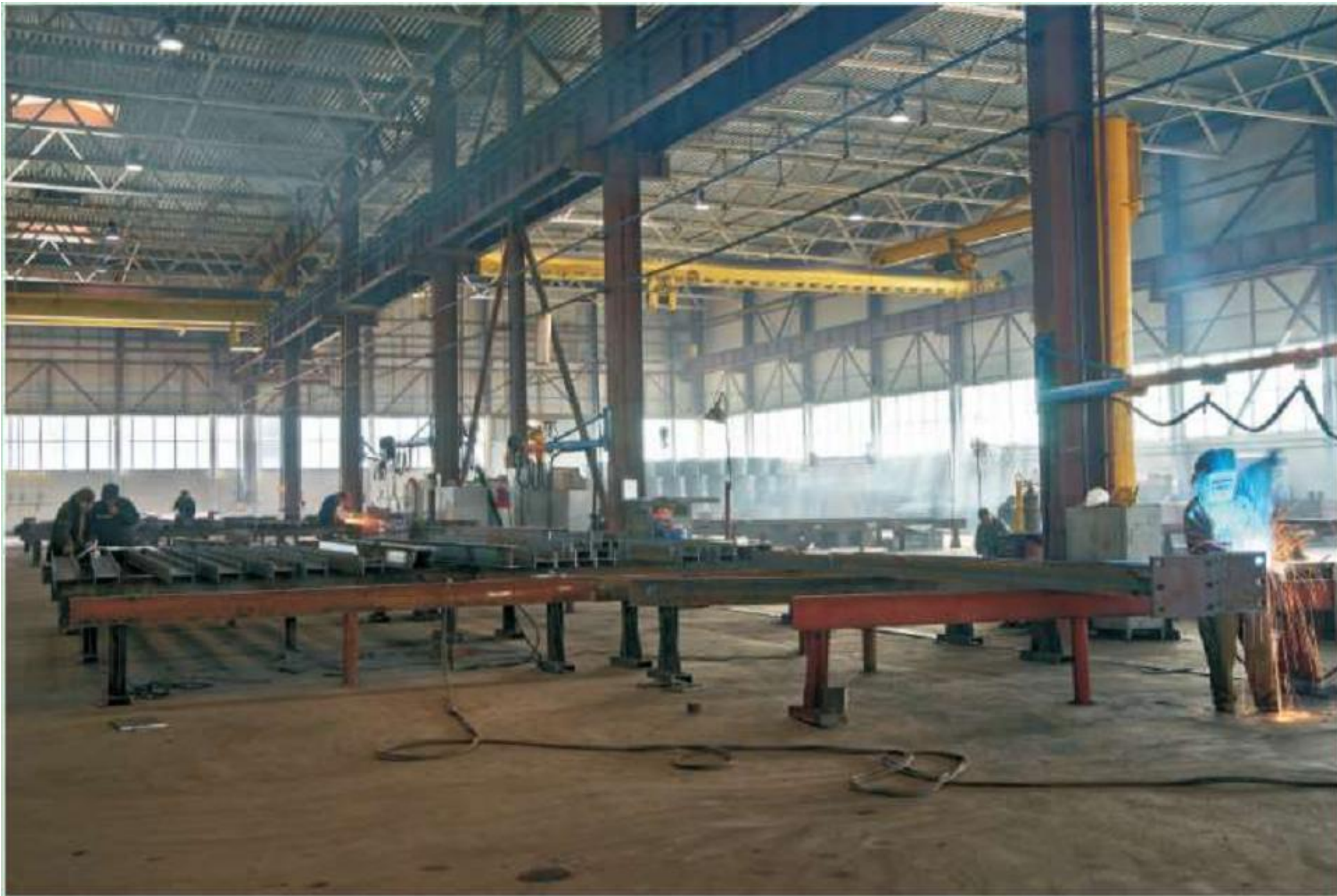
Сборо – сварочное производство