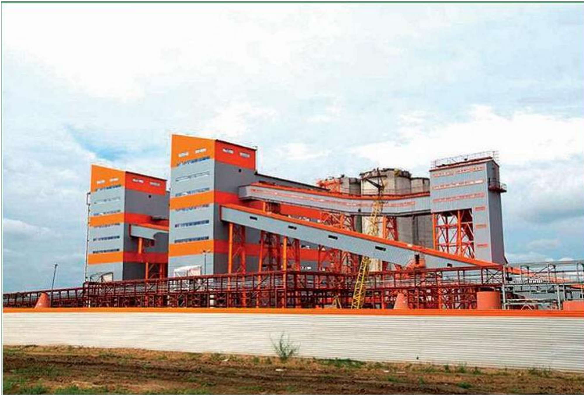
Подгоренский цементный завод холдинга «Евроцемент-Групп» (Воронежская область, п. Подгоренский)