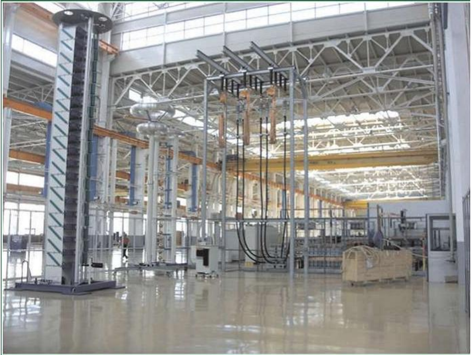
Строительство завода по производству трансформаторов SIEMENS в г. Воронеже