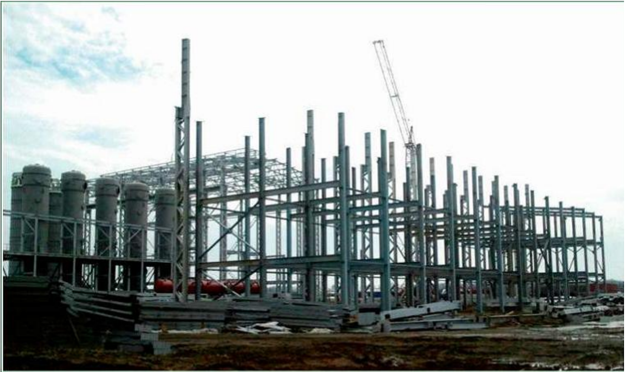
Строительство сахарного завода в п. Мордово Тамбовской области