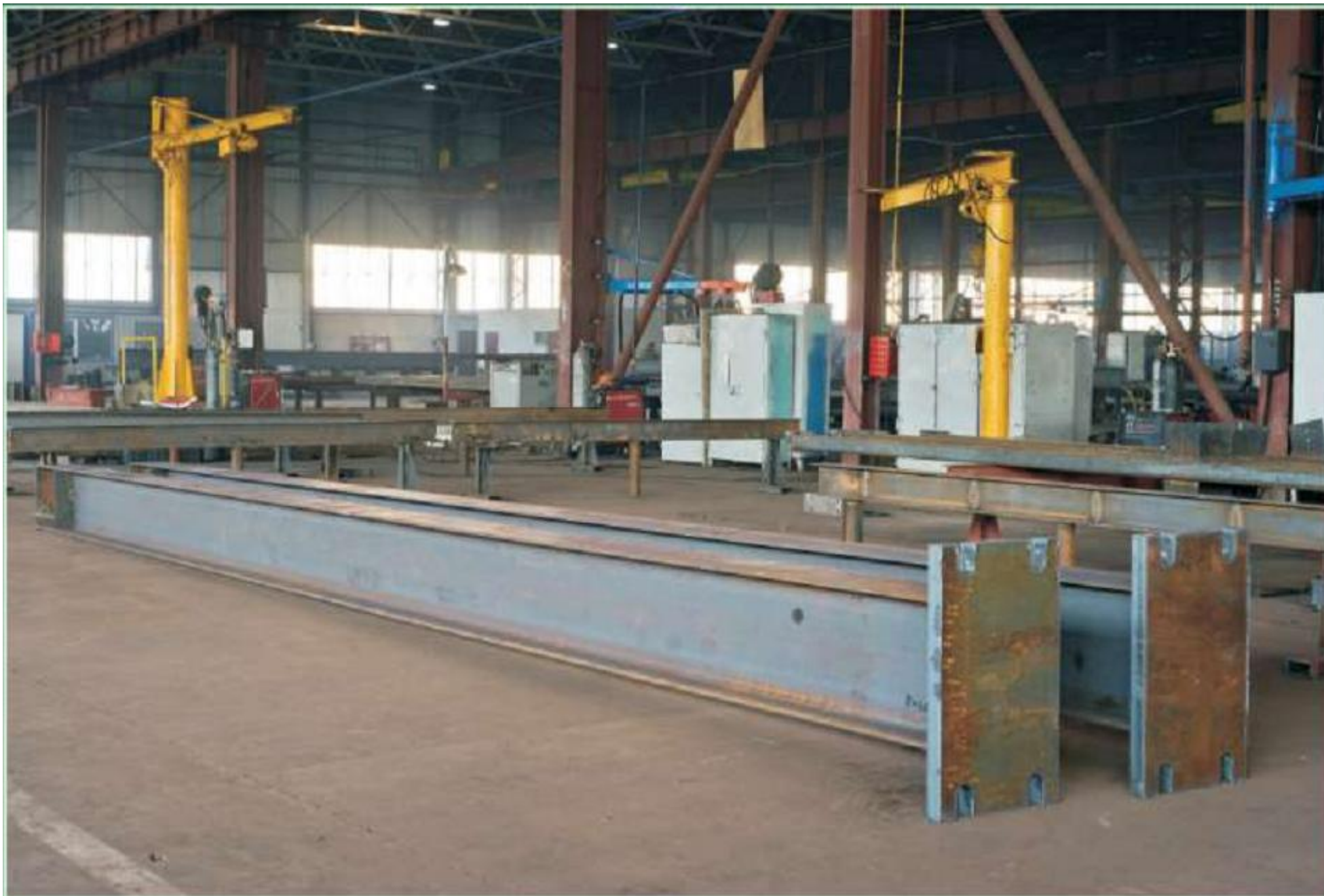
Металлоконструкции мостового перехода через р. Волга