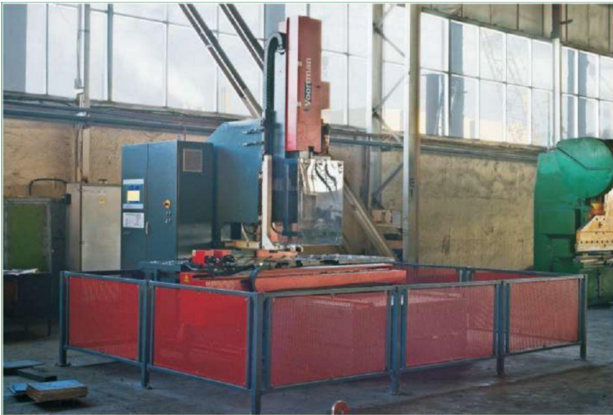
Станок для сверления деталей « »