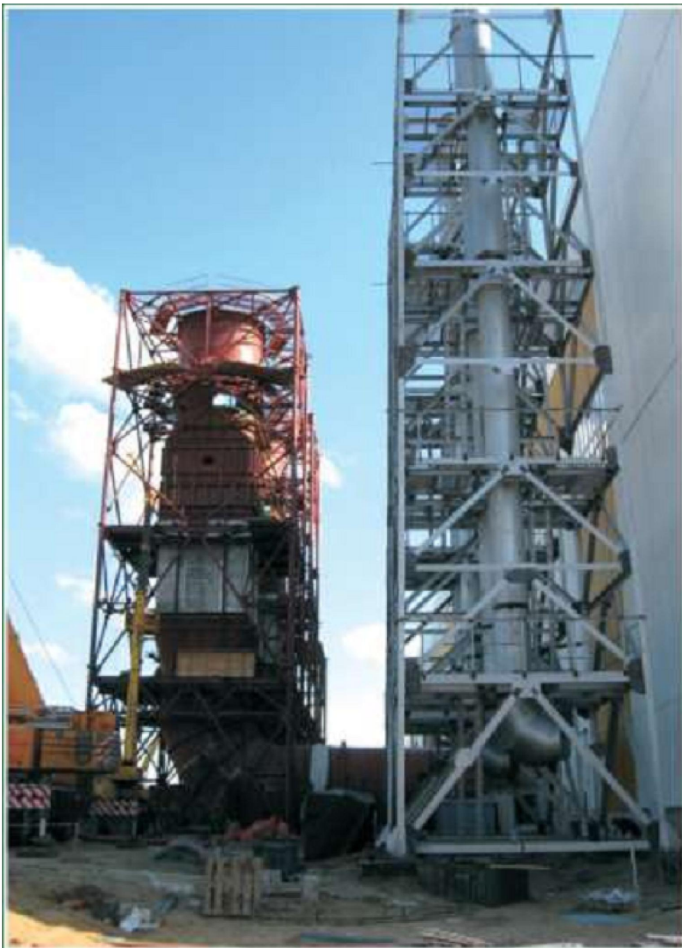
Строительство ГТ ТЭЦ Ожно-Приобского месторождения, 2009 год