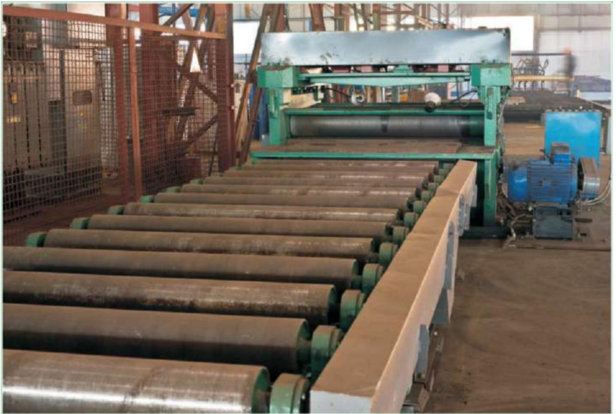
Листо – правильная линия для правки листа толщиной до 20 мм. и шириной до 2000 мм.