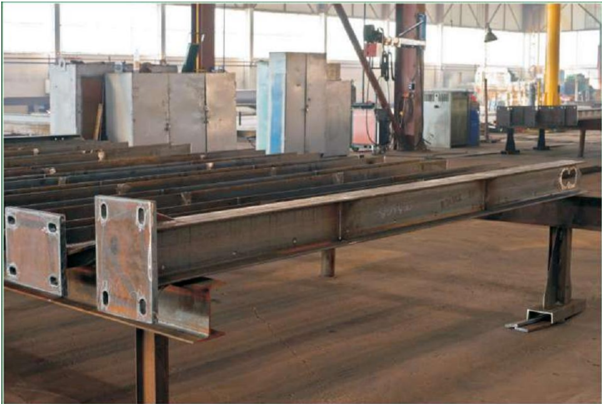
Металлоконструкции мостового перехода через р. Волга