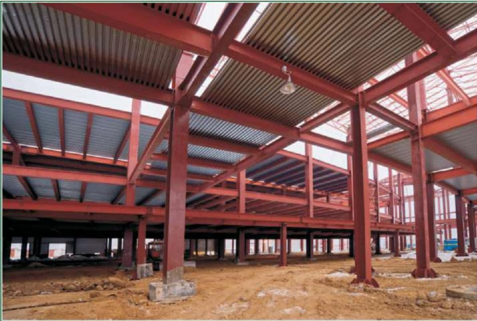
Корпус кинотеатра МГТРК «Сити Молл Белгородский»