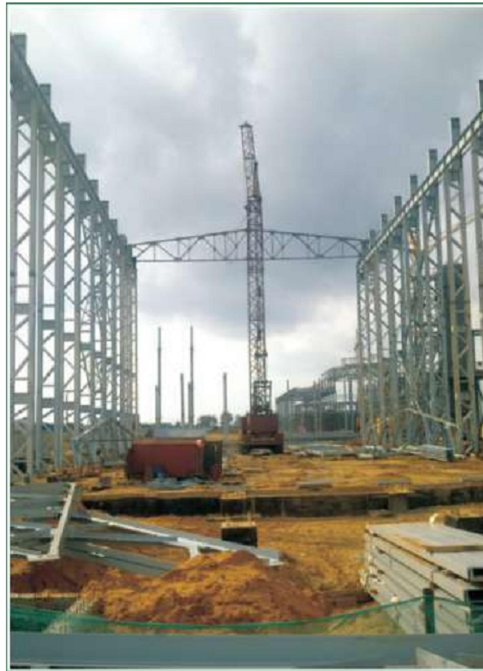
Строительство главного корпуса сахарного завода в п. Мордово Тамбовской области, 2009 год