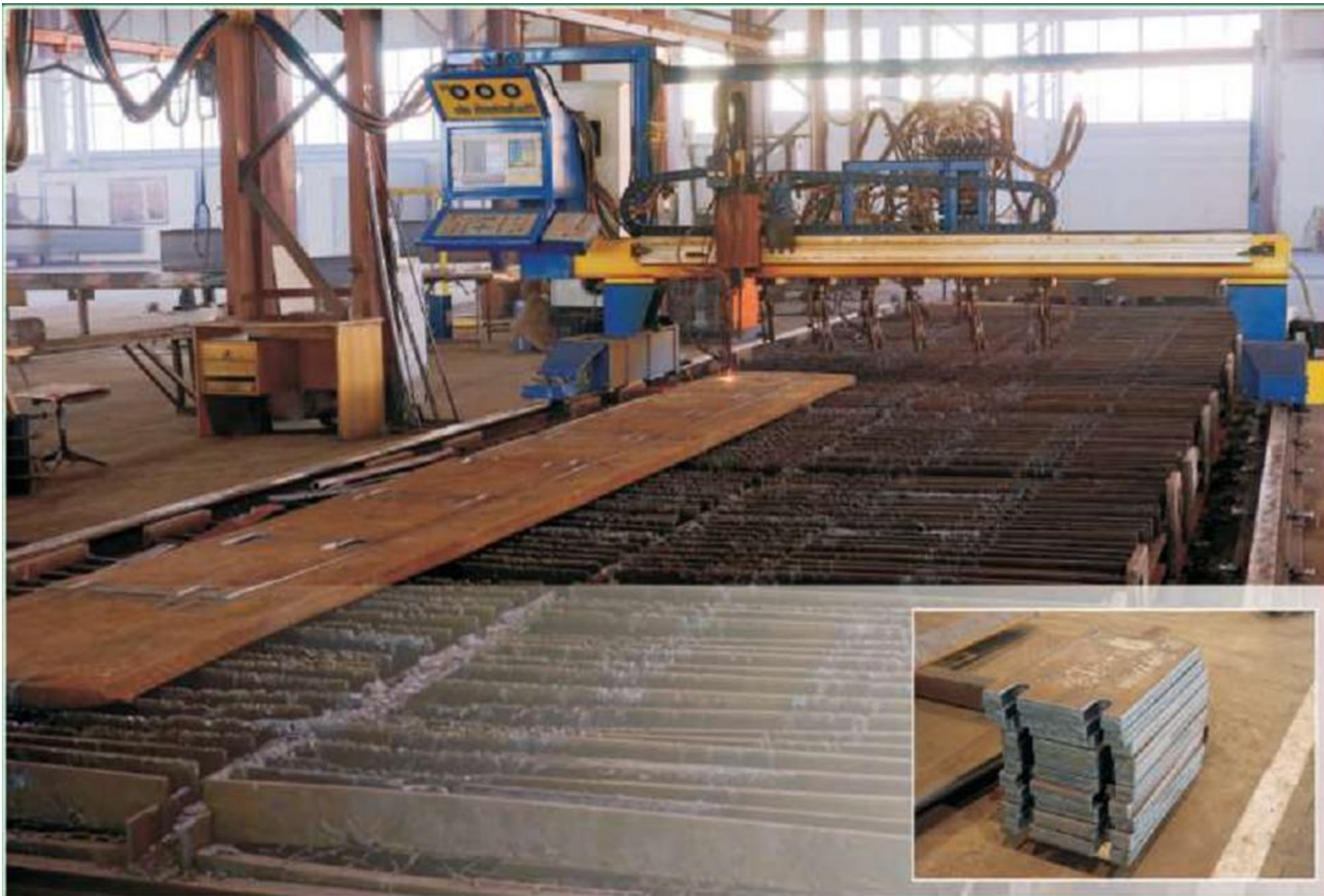
Машина термической резки с ЧПУ для распуска и фигурной резки листа от 6 до 100 мм.