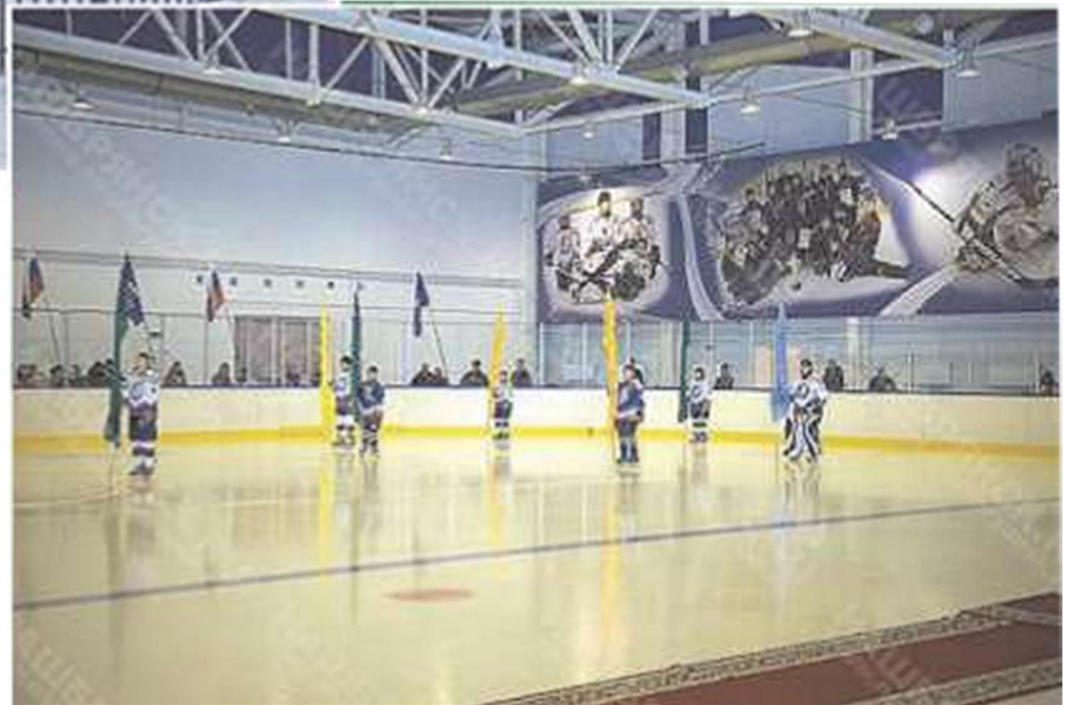
Ледовый дворец в г. Брянске