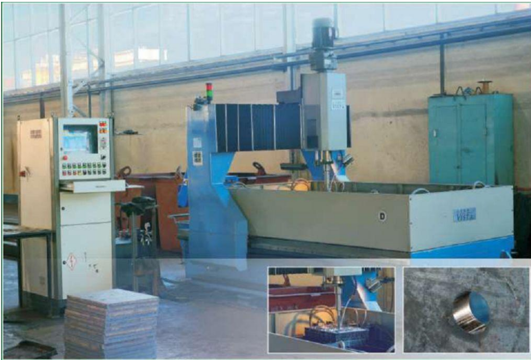
Сверильный станок с ЧПУ