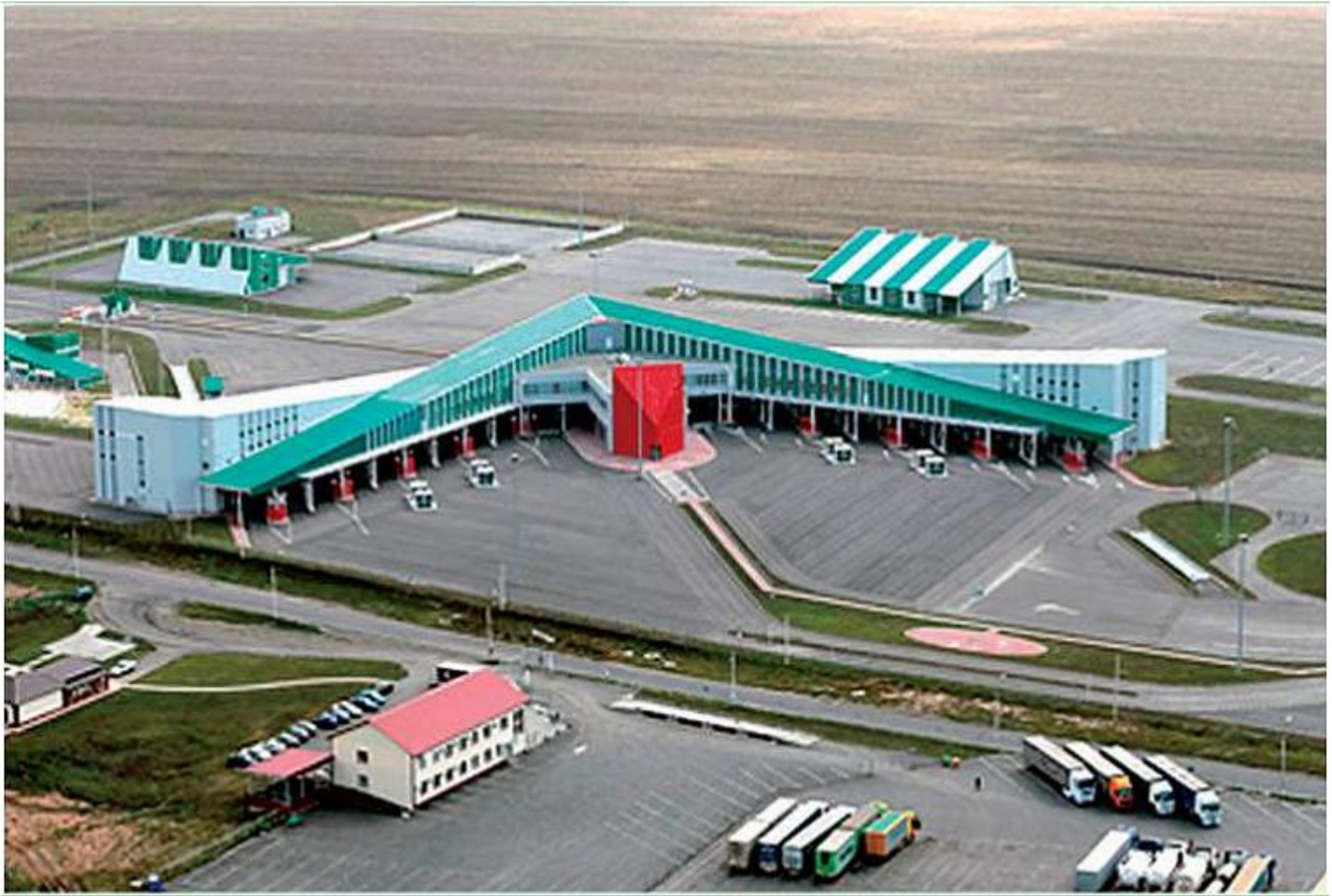
МАПП Шебекино Белгородской области