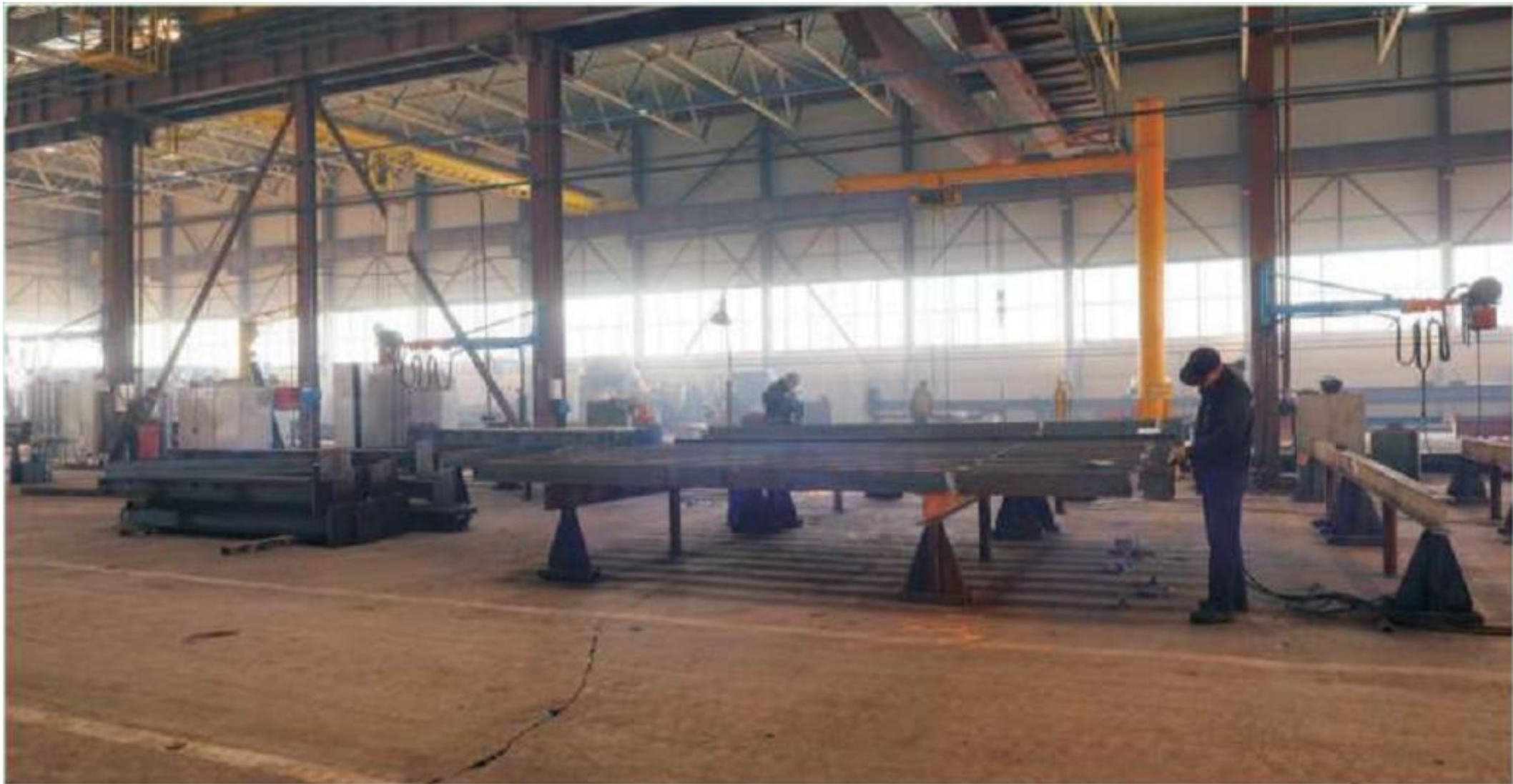
Сборо – сварочное производство