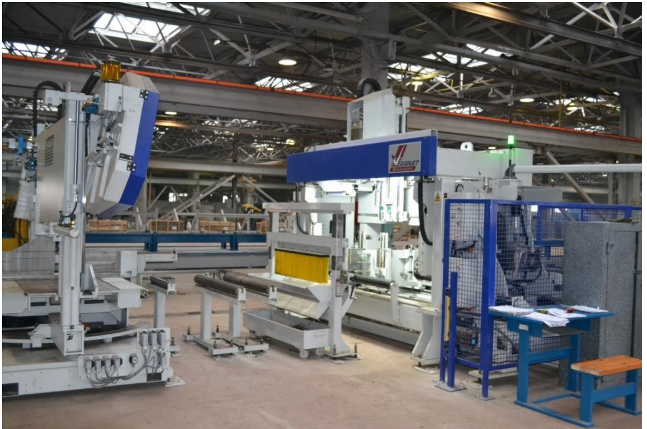
Линия сверления, пиления и фигурной газовой резки Vernet