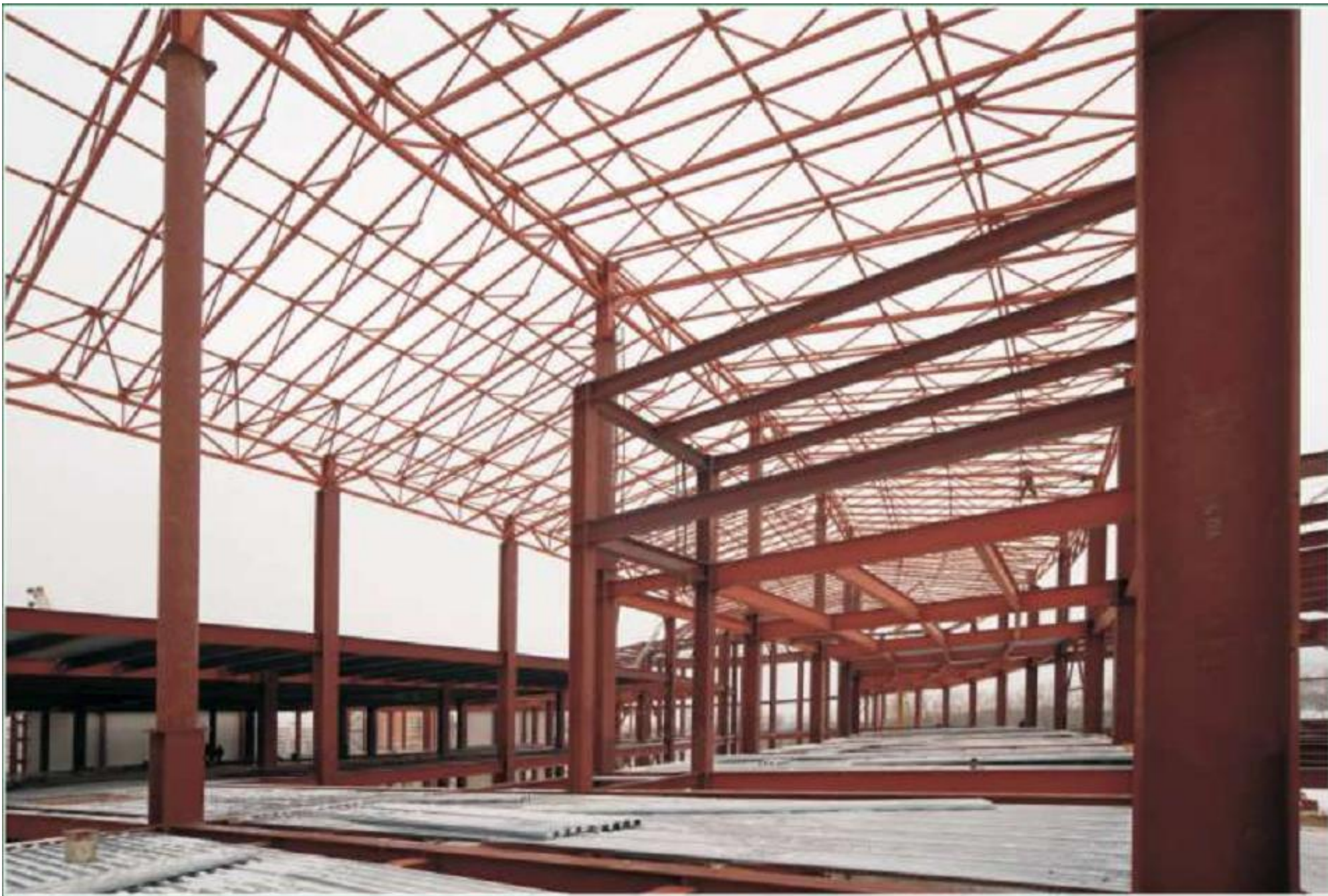
Галерея МГТРК «Сити Молл Белгородский»