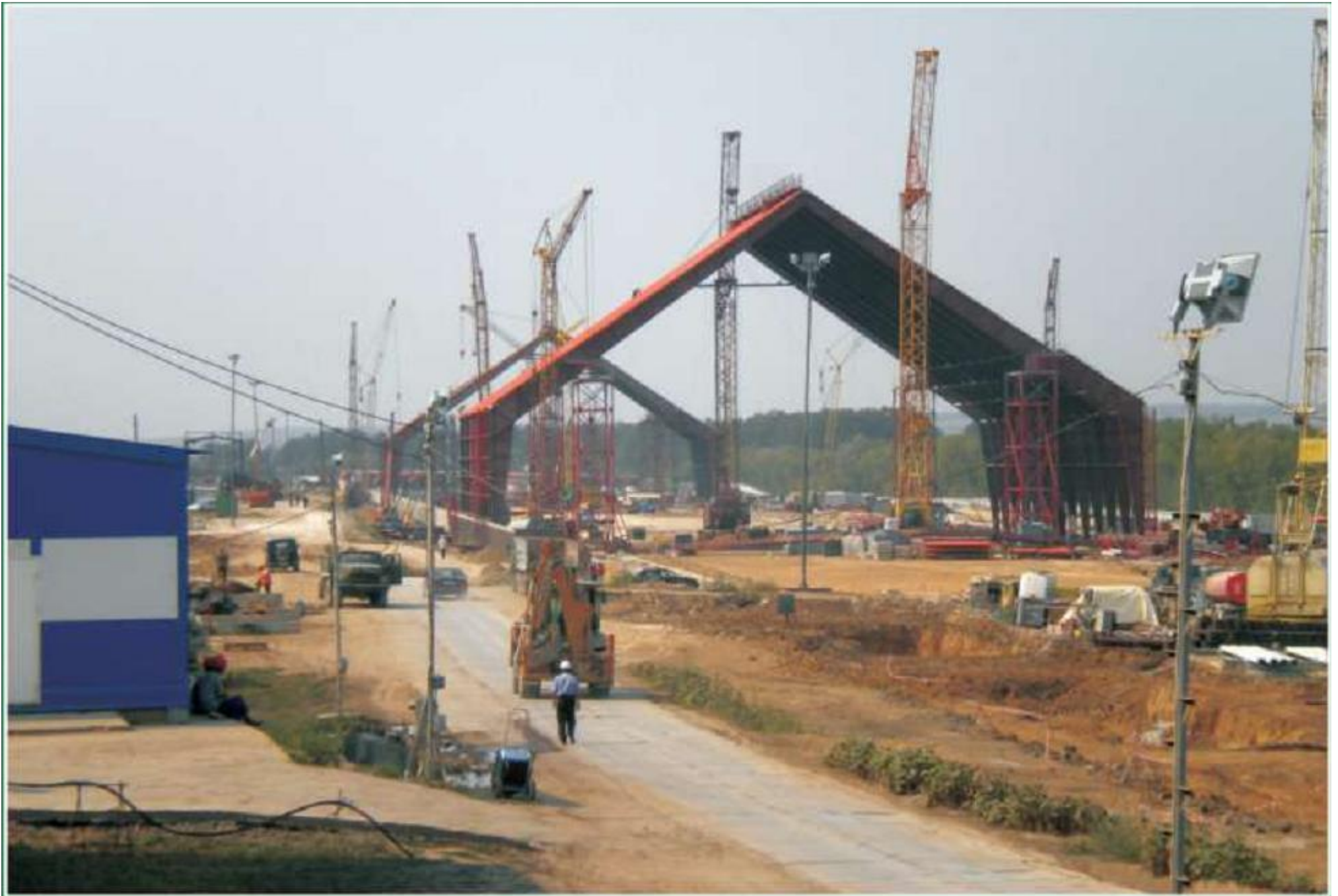
Строительство цементного завода в п. Подгоренский Воронежской области, 2010 год