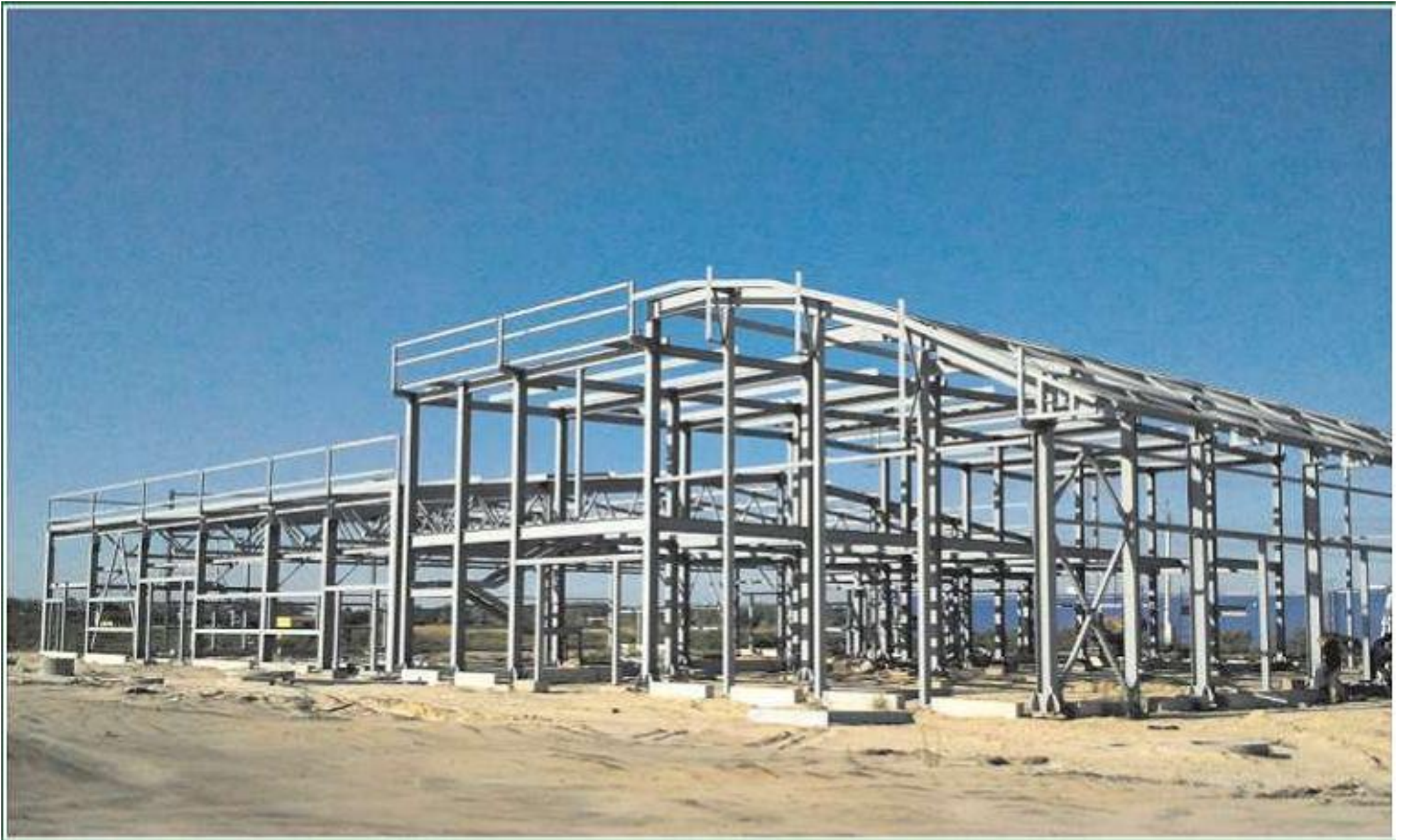
Строительство автосалона SUBARU в г. Воронеже