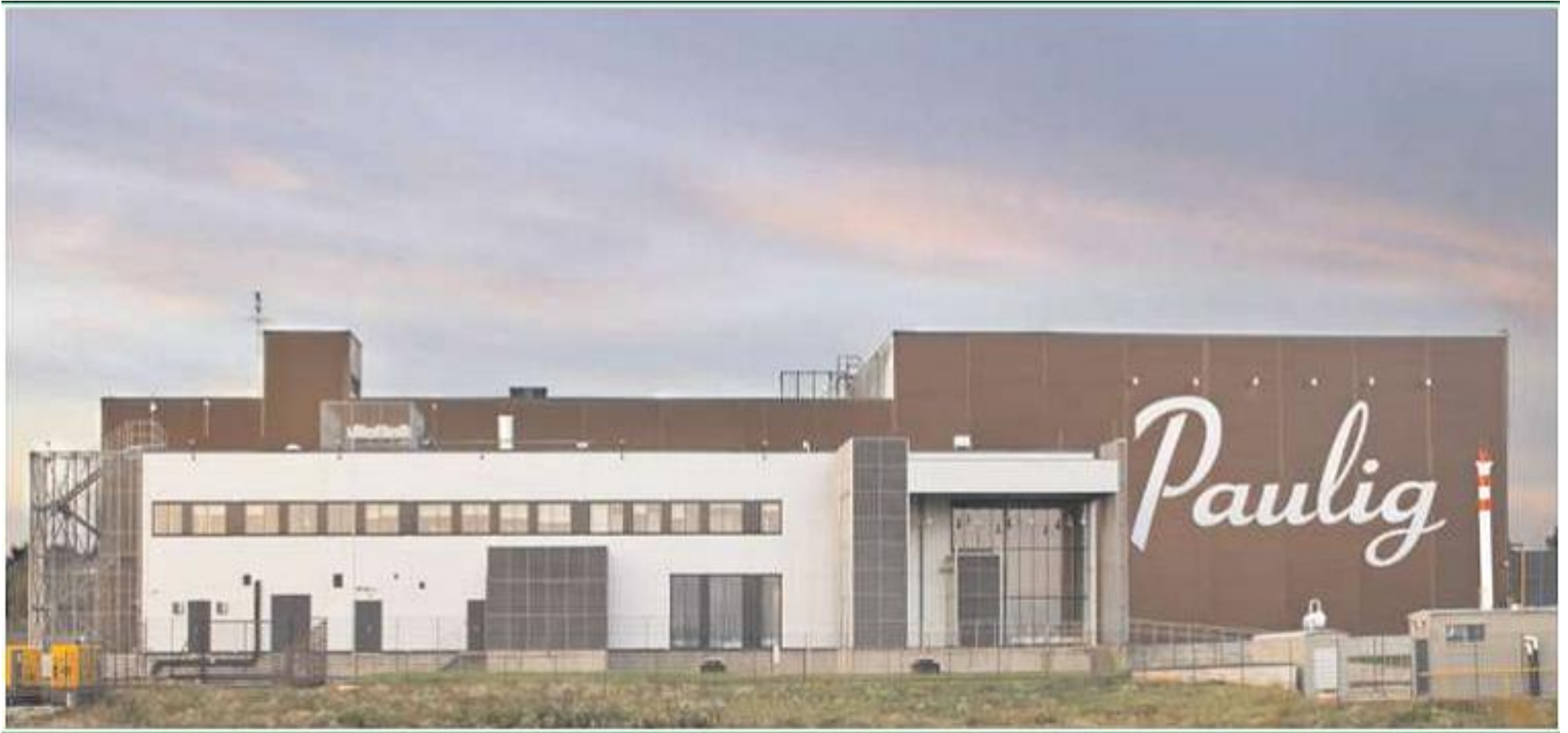
Строительство кофеобжарочного завода компании Paulig (Финляндия) в г. Тверь