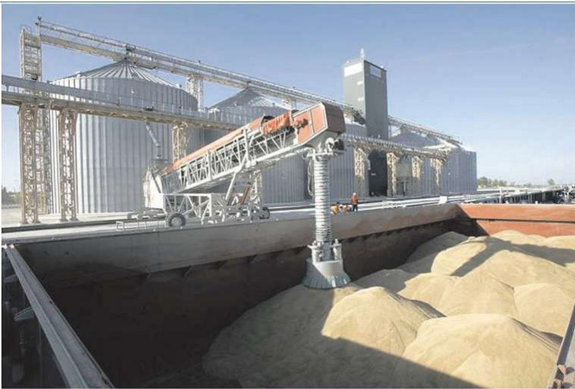
Строительство зернового терминала грузооборотом 3,5 млн. тонн в год в порту г. Новороссийска