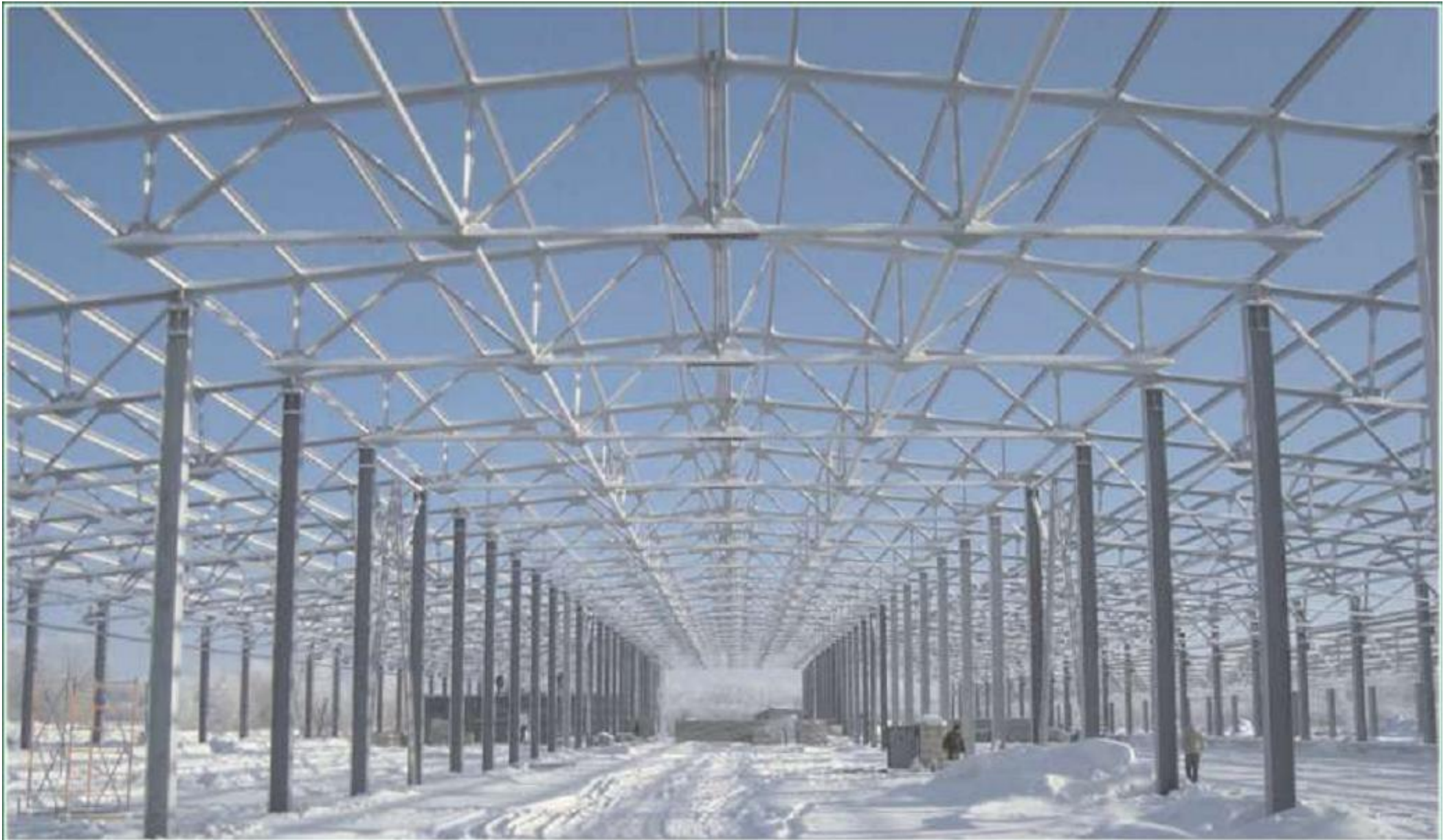
Главный корпус комплекса по убою и переработке мяса птицы ЗАО Приосколье (пос. Инжавино Тамбовской области)