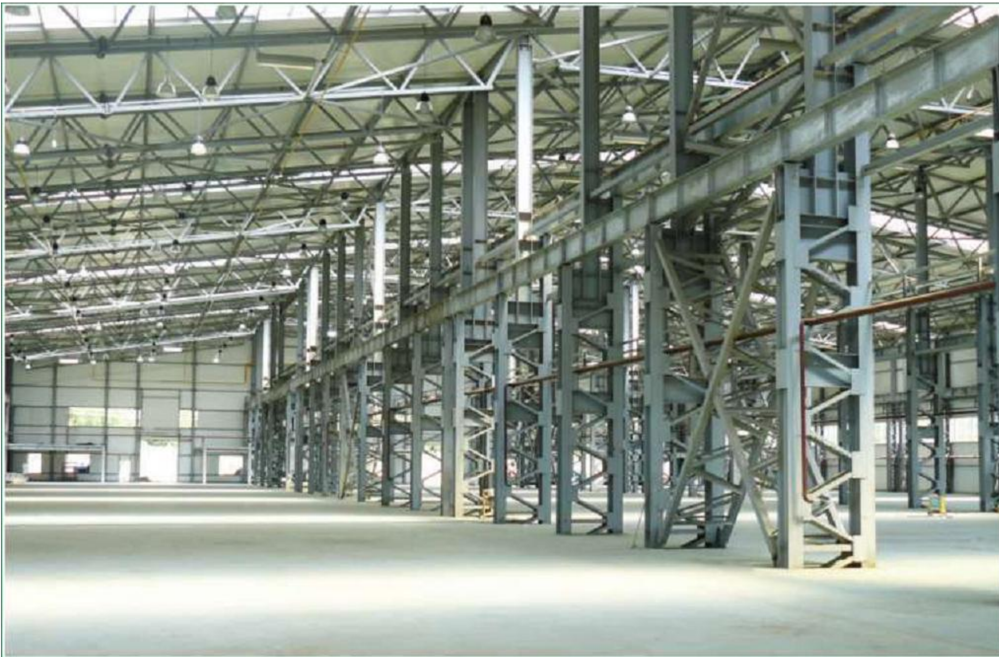
Металлоконструкции производственного корпуса для изготовления сэндвич-панелей