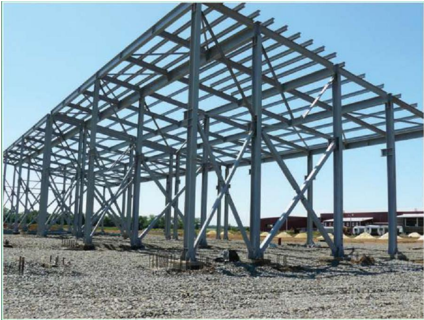
Металлоконструкции цеха горячего цинкования