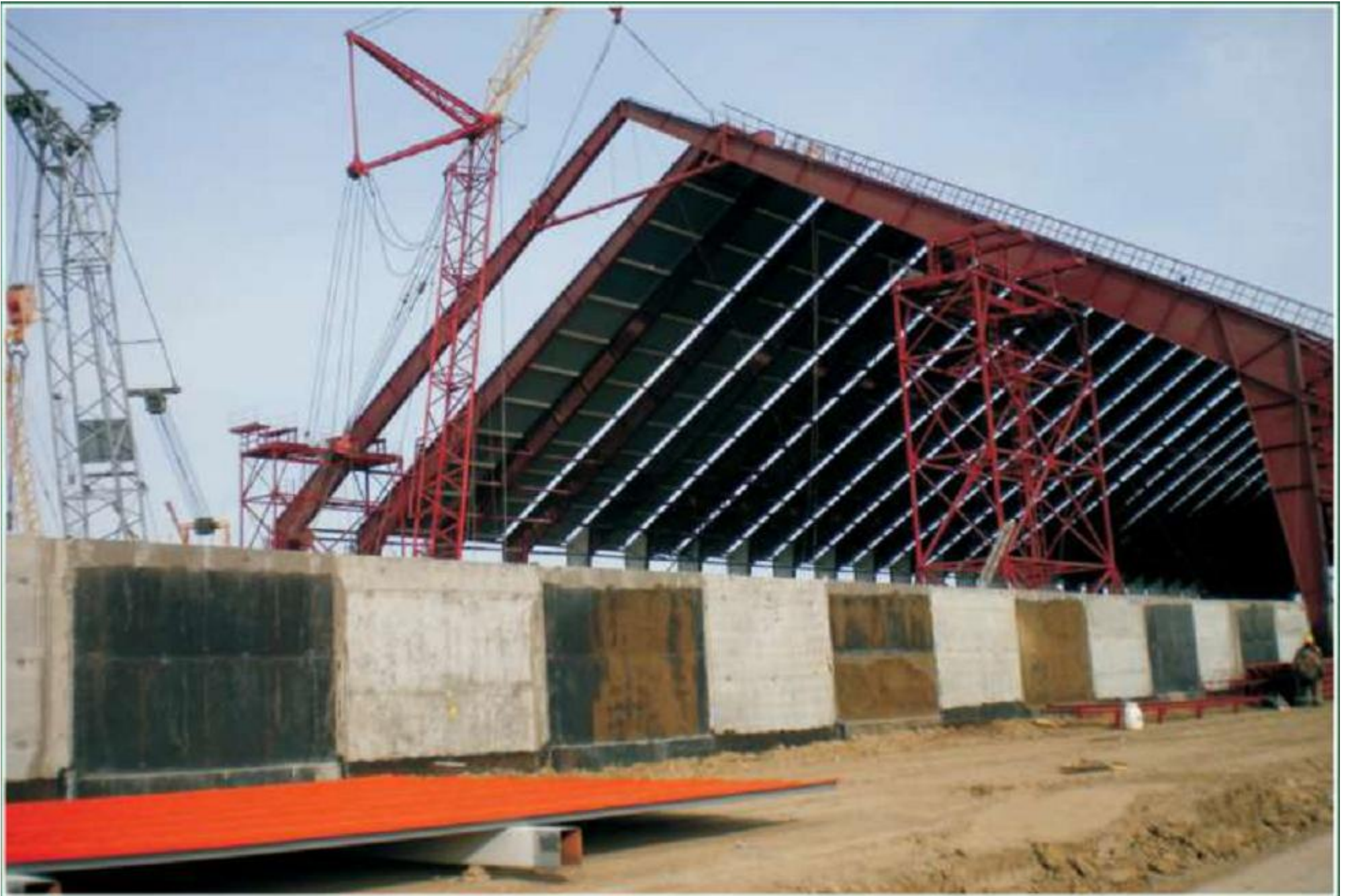
Центральный завод в Воронежской области 133/232 Склад сырья и добавок, 2010 год