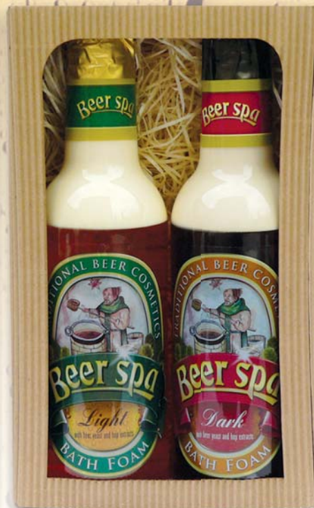
BC 802622 Подарочный набор - шампунь для волос, 250 мл + масло для ванны, 500 мл + мыло туалетное, 70 г BC 802602 Подарочный набор - гель для душа, 250 мл + масло для ванны, 500 мл + мыло туалетное, 70 г BC 80243 Подарочный набор - масло для ванны, 500 мл - светлое + темное

ТРАДИЦИОННАЯ ПИВНАЯ КОСМЕТИКА С ЭКСТРАКТАМИ ПИВНЫХ ДРОЖЖЕЙ И ХМЕЛЯ