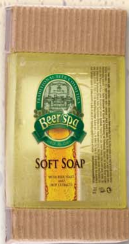
BC 80152 Мыло туалетное Beer Spa, 70 г