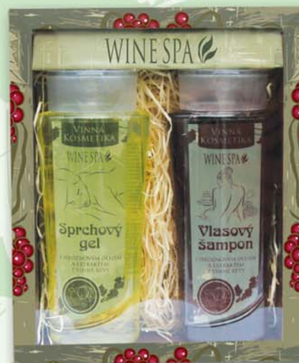
BC 8131 Подарочный набор - гель для душа, 250 мл + шампунь для волос, 250 мл