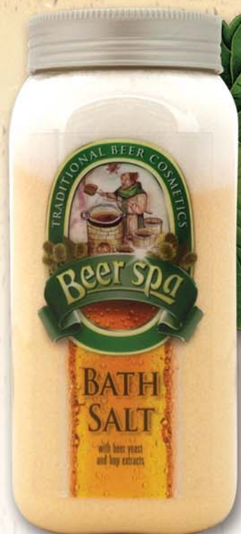
BC 8017 Соль для ванны Beer Spa, 990 г

ТРАДИЦИОННАЯ ПИВНАЯ КОСМЕТИКА С ЭКСТРАКТАМИ ПИВНЫХ ДРОЖЖЕЙ И ХМЕЛЯ