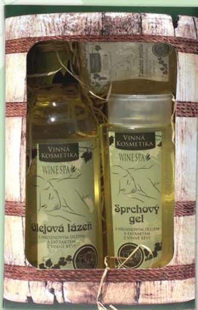
BC 8133 Подарочный набор - гель для душа, 250 мл + масло для ванны, 500 мл + мыло туалетное, 70 г