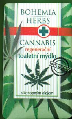
BC 0288 Мыло туалетное, 100 г