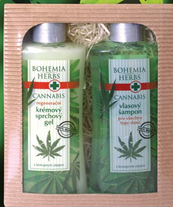
BC 0280 Гель для душа, 250 мл, + шампунь для волос, 250 мл