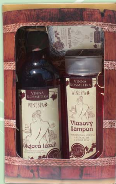
BC 8134 Подарочный набор - шампунь для волос, 250 мл + масло для ванны, 500 мл + мыло туалетное, 70 г