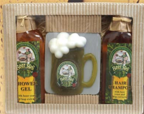
BC 701530 Подарочный набор „мини“ - гель для душа, 100 мл + соль для ванны, 150 г + шампунь для волос, 100 мл