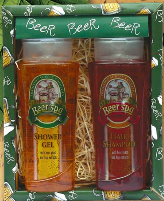
BC 80220 Подарочный набор - гель для душа, 250 мл + шампунь для волос, 250 мл