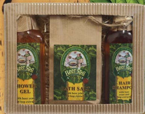
BC 70152 Подарочный набор „мини“ - гель для душа, 100 мл + соль для ванны, 150 г + шампунь для волос, 100 мл