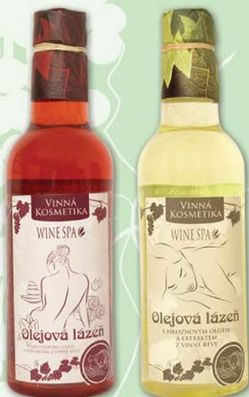
BC 8032 Масло для ванны, 500 мл - красный виноград