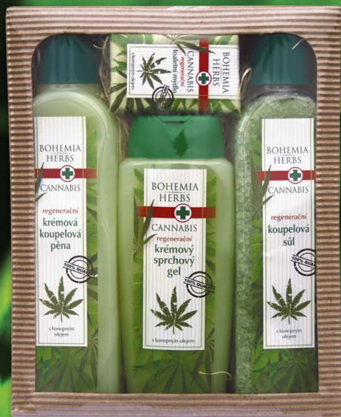
BC 0280 Пена для ванны, 500 мл, + гель для душа, 300 мл, + мыло, 100 г + соль для ванны, 600 г