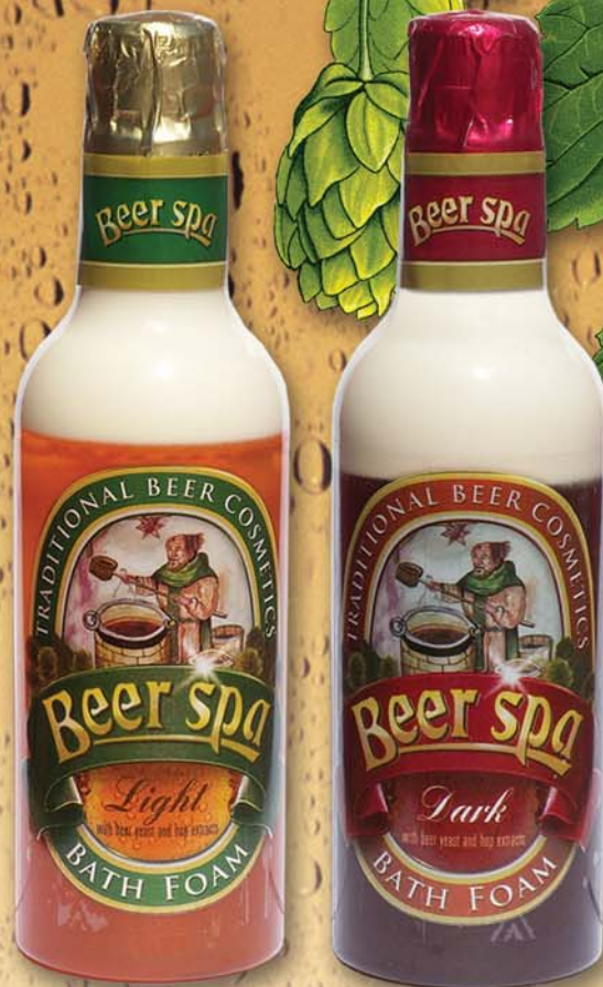
BC 8011 Пена для ванны Beer Spa, 500 мл - светлая BC 8012 Пена для ванны Beer Spa, 500 мл - темная