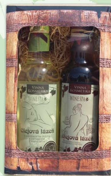
BC 8135 Подарочный набор - 2 вида масел для ванны, 500 мл - зеленый виноград + красный виноград