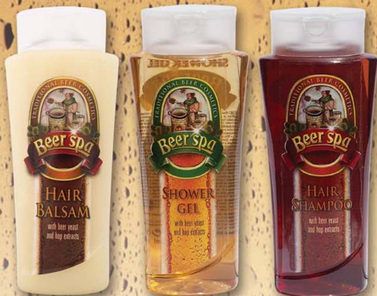
BC 8016 Бальзам для волос Beer Spa, 250 мл BC 8013 Гель для душа Beer Spa, 250 мл BC 8014 Шампунь для волос Beer Spa, 250 мл