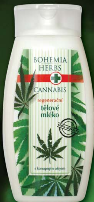
BC 0287 Молочко для тела, 250 мл

Средства личной гигиены для мытья кожи всего тела содержат качественное масло из семян конопли ( Cannabis Sativa L., Angiospermae ), которое действует как натуральный эмульгатор, помогает сохранить ее естественную мягкость и бархатистость.