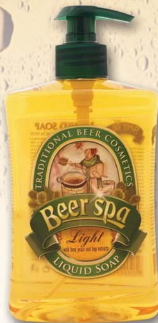
BC 8015 Мыло жидкое Beer Spa, 500 мл