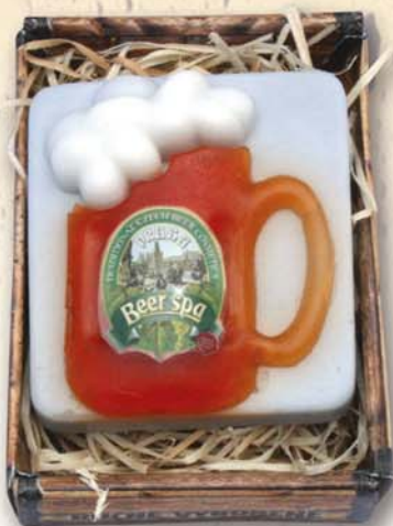
BC 120061 Мыло туалетное Beer Spa, 70 г