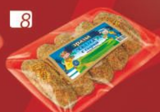
ЗРАЗЫ "Сказка" с сыром