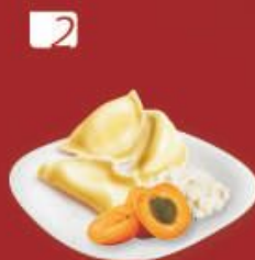
2 ВАРЕНИКИ «Довольная панночка» с творогом и абрикосом