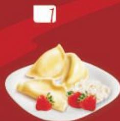
1 ВАРЕНИКИ «Довольная панночка» с творогом и клубникой