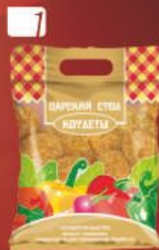
КОТЛЕТЫ "Царский стол"