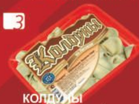
3 КОЛДУНЫ "По-литовски"