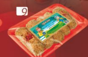
ЗРАЗЫ "Старорусские" с грибами