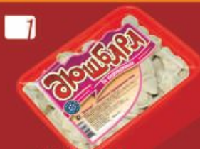
1 ДЮШБАРА "По-азербайджански"