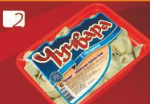
2 ЧУЧВАРА с говядиной