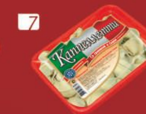
7 КАППЕЛЛЕТИ "Со свинойной и сыром"