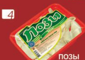
4 ПОЗЫ "Буузы"