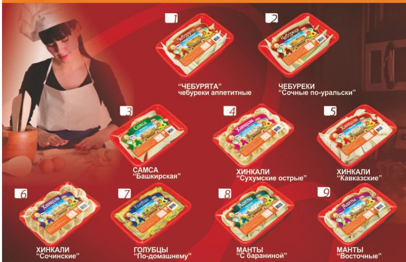
1 "ЧЕБУРЯТА" чебуреки аппетитные