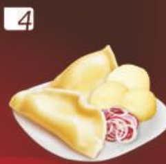
4 ВАРЕНИКИ «Сытый пан» с картофелем и луком