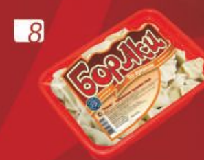
8 БОРАКИ "По-армянски"