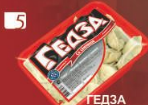
5 ГЕДЗА "Со свинойной"