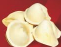
ПЕЛЬМЕНИ «Сибирские малышки»