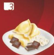
3 ВАРЕНИКИ «Довольная панночка» с творогом и шоколадом