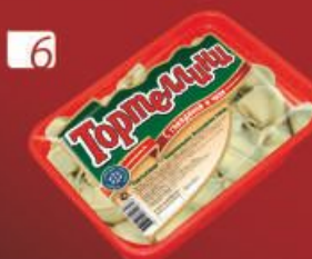
6 ТОРТЕЛЛИНИ "С говядиной и чили"