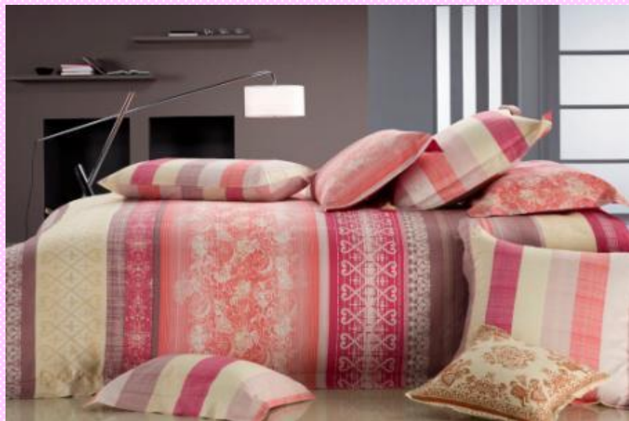
Монте - Карло