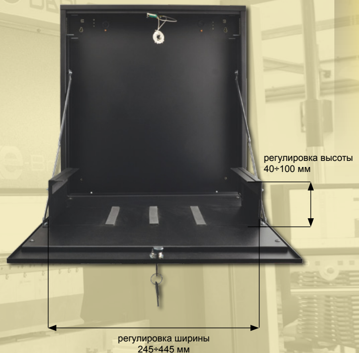
AWO530 – корпус DVR/MEDIUM/VERTICAL AWO530W – корпус DVR/MEDIUM/VERTICAL/WHITE