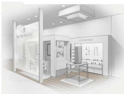
Это Ваш магазин

Знаете ли Вы о существовании «звездных» вещей – настоящих хитов продаж? Такая вещь – пляжное платье Sareo®. Хотите знать, на что на самом деле способен Ваш магазин? Смотрите!