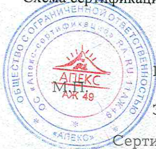
Схема сертификации: 1с.