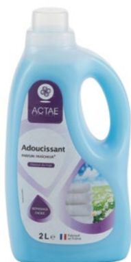
Объем: 2 л

Кондиционер для белья – это смягчающее средство, которое придает мягкость и ухоженный вид всему белью. Разработано специально для облегчения процесса глажения одежды, обеспечивает безупречный результат. Белье приобретает великолепный вид и легкий запах свежести.