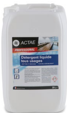
Объем: 20 л