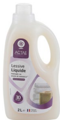
Объем: 2 л