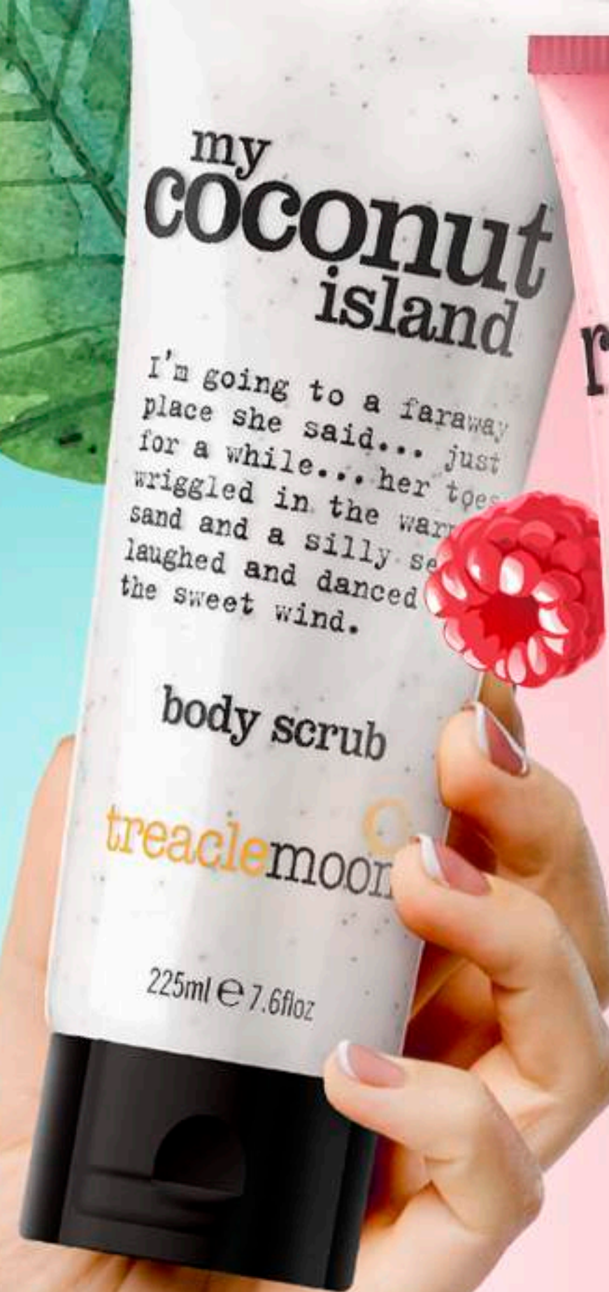
Treaclemoon Скраб для тела Кокосовый Рай My coconut island body scrub 225 ml LD1F1013