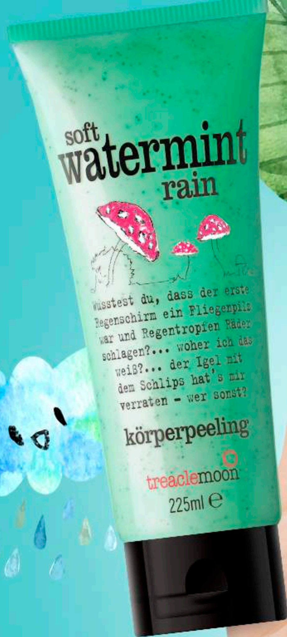
Treaclemoon Скраб для тела Мятный дождь Soft Watermint Rain body scrub 225 ml V01F0107