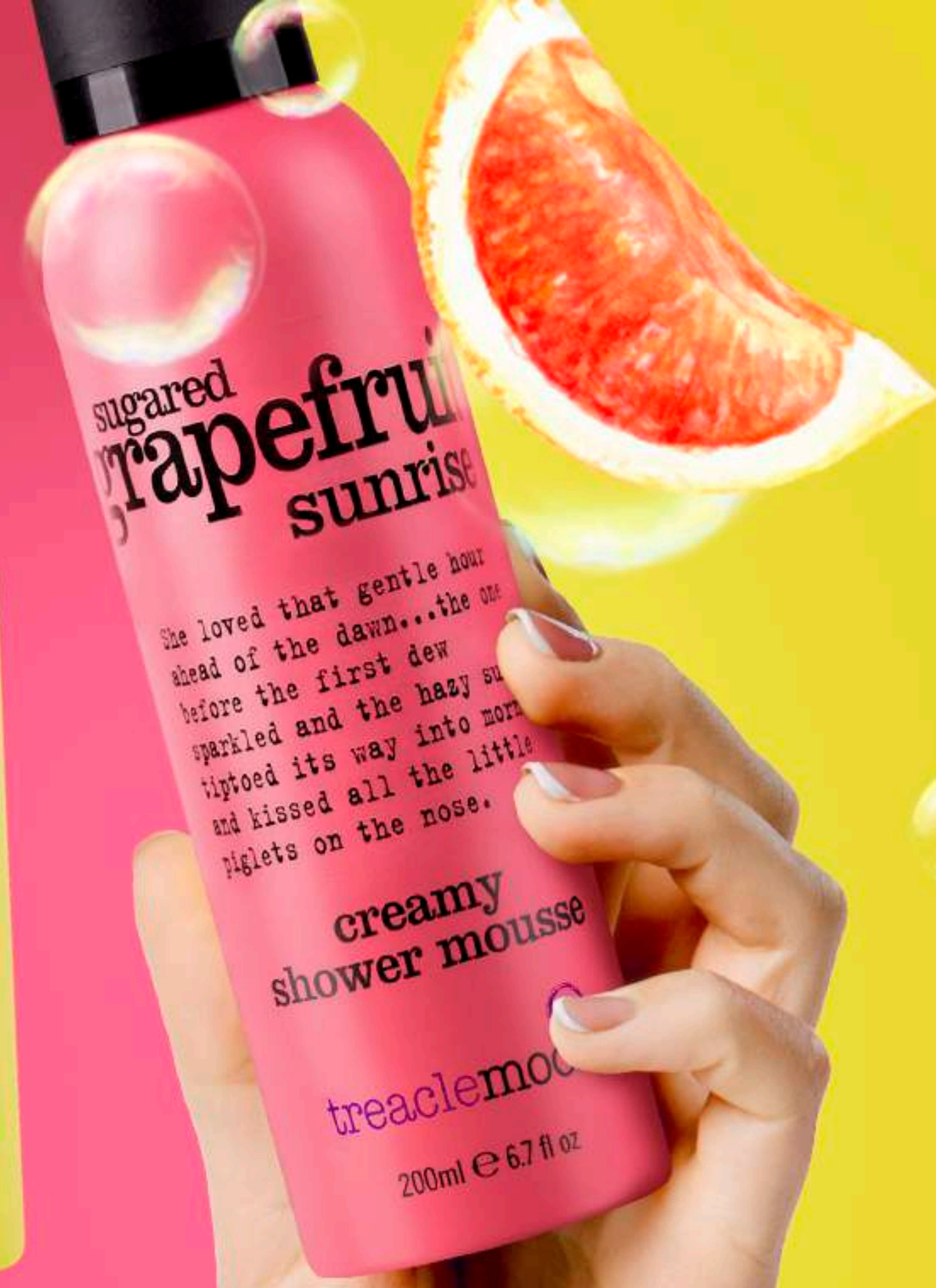
Treaclemoon Мусс для душа Сахарный грейпфрут Sugared grapefruit sunrise shower mousse 200 ml LD1F1076