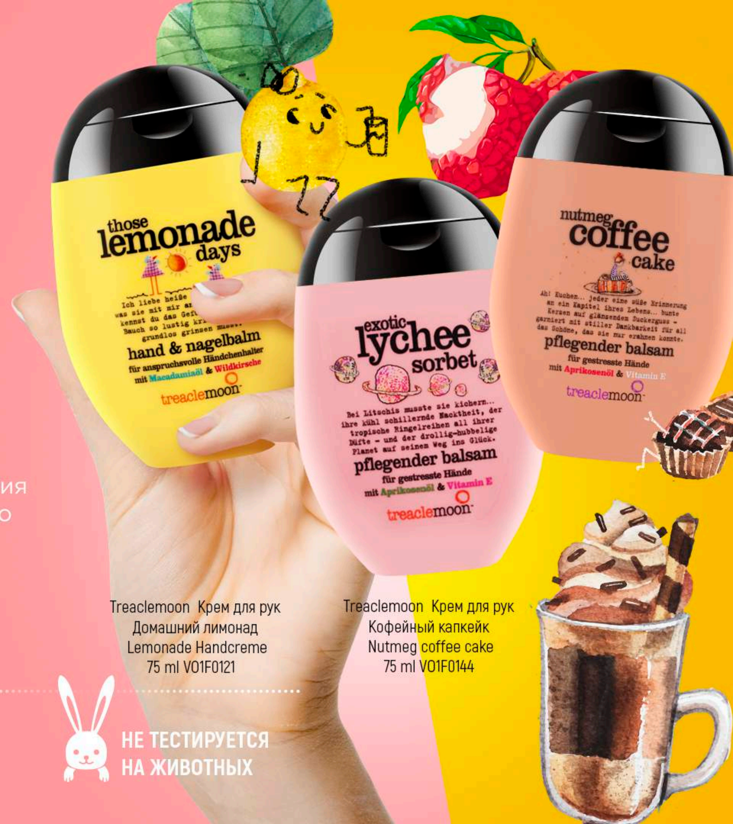
Treaclemoon Крем для рук Домашний лимонад Lemonade Handcreme 75 ml V01F0121