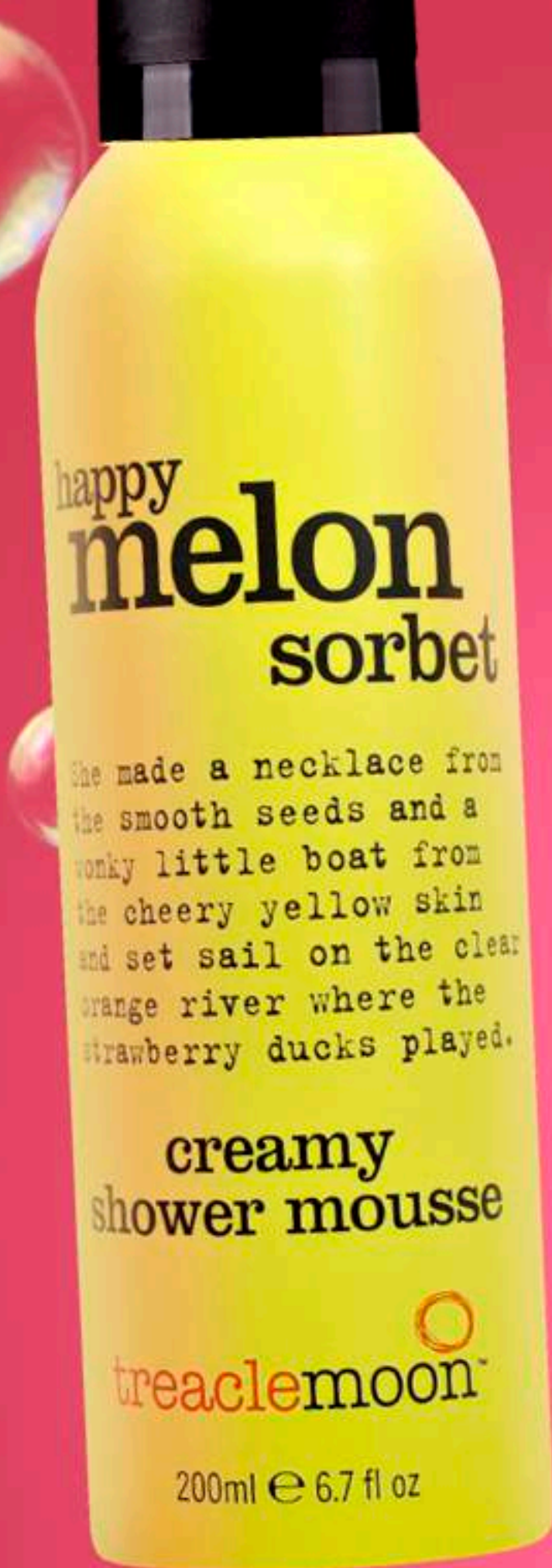
Treaclemoon Мусс для душа Дынный сорбет Happy melon sorbet shower mousse 200 ml LD1F1068