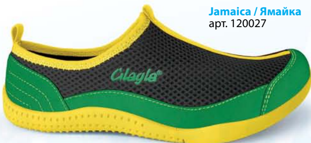
Jamaica / Ямайка арт. 120027