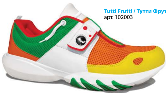
Tutti Frutti / Тутти Фрутти арт. 102003