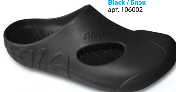
Black / Блэк арт. 106002