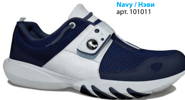
Navy / Нэви арт. 101011