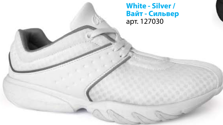
White - Silver / Байт - Сильвер арт. 127030

Сквозные вентиляционные прорезы в подошве, расположенные в зонах повышенных температур.