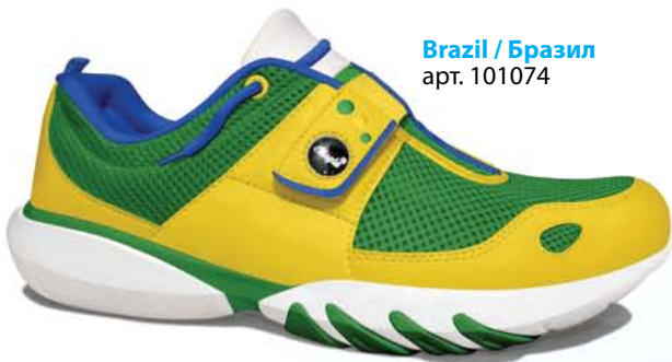
Brazil / Бразил арт. 101074