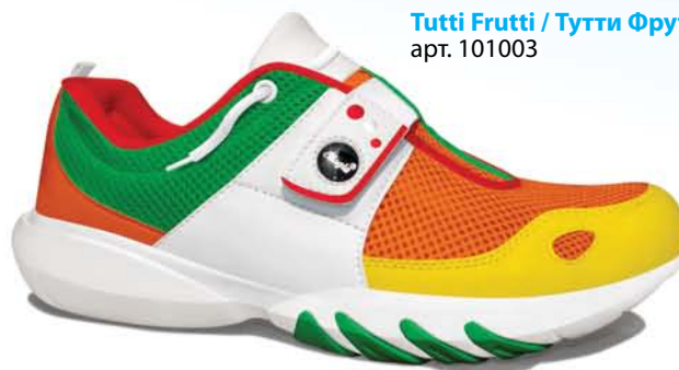
Tutti Frutti / Тутти Фрутти арт. 101003