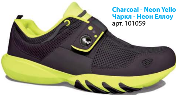
Charcoal - Neon Yellow / Чаркл - Неон Еллоу арт. 101059