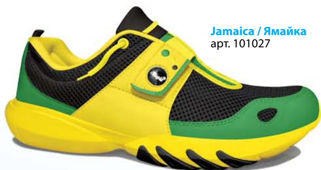
Jamaica / Ямайка арт. 101027