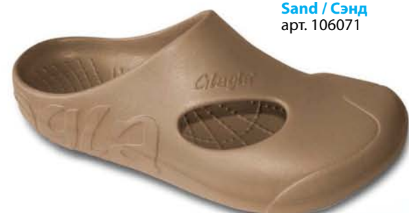
Sand / Сэнд арт. 106071