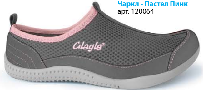
Charcoal - Pastel Pink / Чаркл - Пастел Пинк арт. 120064