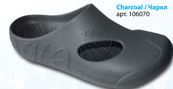
Charcoal / Чаркл арт. 106070