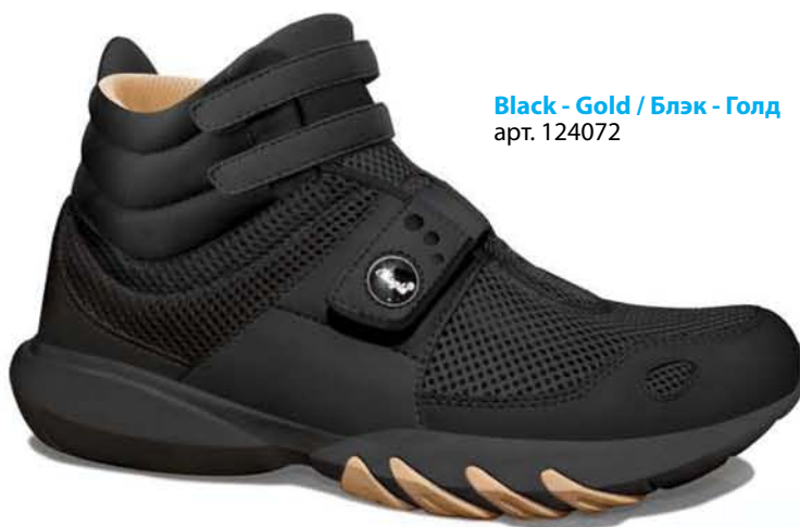
Black - Gold / Блэк - Голд арт. 124072