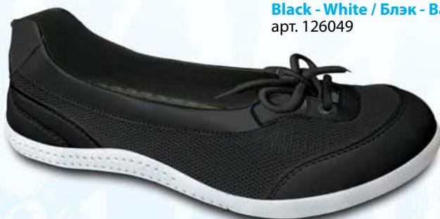
Black - White / Блэк - Байт арт. 126049

Сквозные вентиляционные прорезы в подошве, расположенные в зонах повышенных температур.