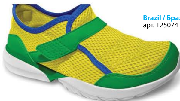
Brazil / Бразил арт. 125074