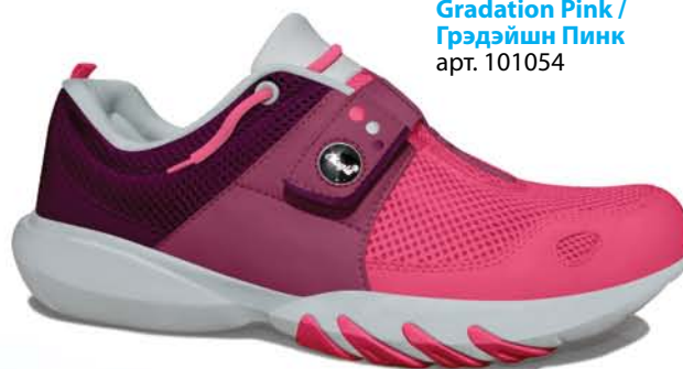
Gradation Pink / Грэдэйшн Пинк арт. 101054