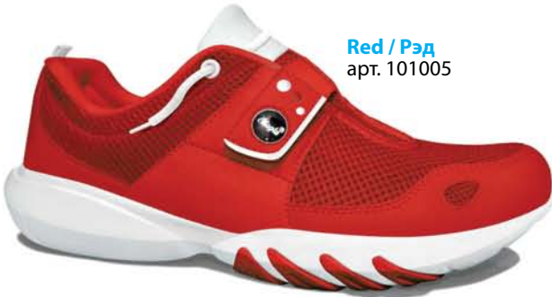
Red / Рэд арт. 101005