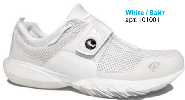
White / Вайт арт. 101001

Сквозные вентиляционные прорези в подошве, расположенные в зонах повышенных температур.