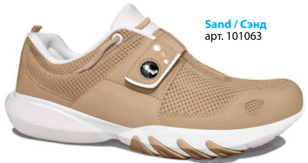
Sand / Сэнд арт. 101063