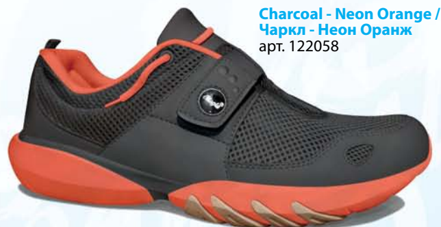
Charcoal - Neon Orange / Чаркл - Неон Оранж арт. 122058