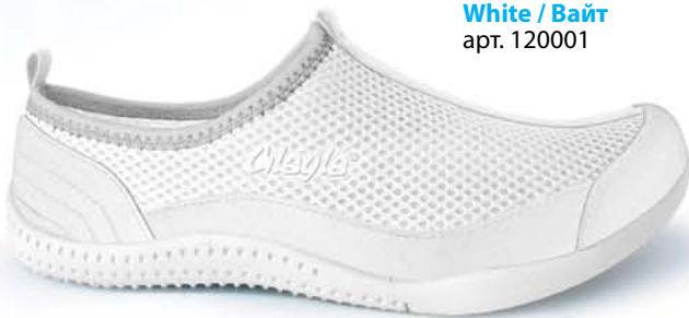
White / Вайт арт. 120001

Размеры: от 36 до 46 Материал верха: сетка Drytech и иск. замша Материал подошвы: Neotech EVA Стелька: бамбуковое волокно