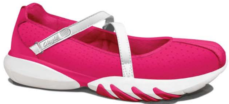
Metal Pink - White / Метал Пинк - Вайт арт. 128021