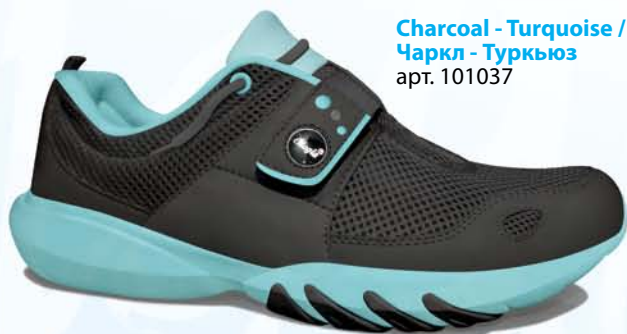
Charcoal - Turquoise / Чаркл - Туркюз арт. 101037