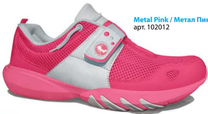
Metal Pink / Метал Пинк арт. 102012