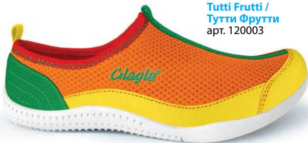
Tutti Frutti / Тутти Фрутти арт. 120003