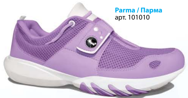
Parma / Парма арт. 101010