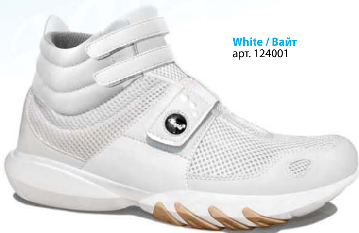
White / Вайт арт. 124001

Размеры: от 36 до 41 Материал верха: сетка Drytech и микрофибра высокой плотности Материал подошвы: Neotech EVA и резиновые вставки Стелька: бамбуковое волокно