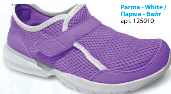
Parma - White / Парма - Вайт арт. 125010