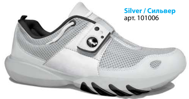
Silver / Сильвер арт. 101006