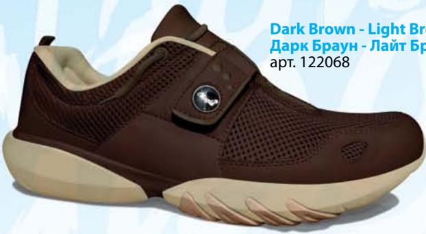
Dark Brown - Light Brown / Дарк Браун - Лайт Браун арт. 122068