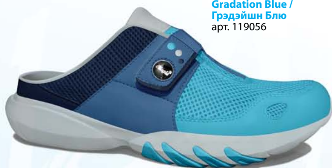
Gradation Blue / Грэдэйшн Блю арт. 119056