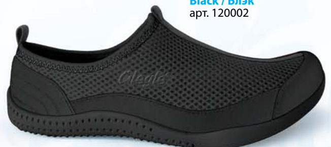
Black / Блэк арт. 120002