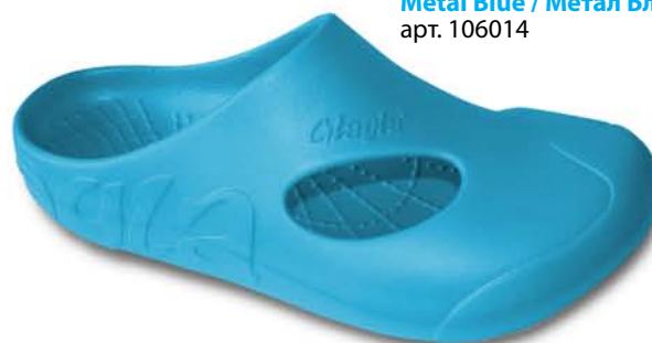
Metal Blue / Метал Блю арт. 106014