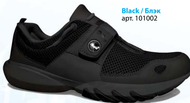
Black / Блэк арт. 101002