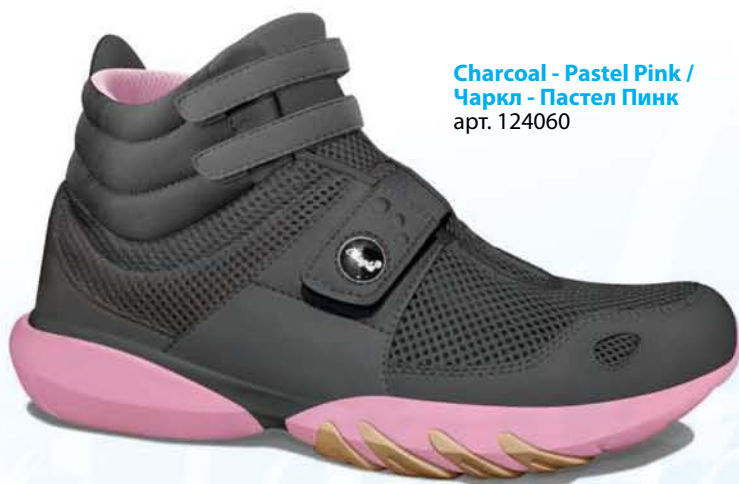
Charcoal - Pastel Pink / Чаркл - Пастел Пинк арт. 124060