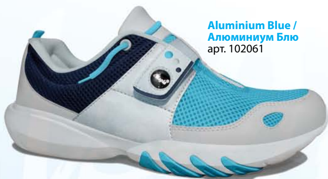
Aluminium Blue / Алюминий Блю арт. 102061