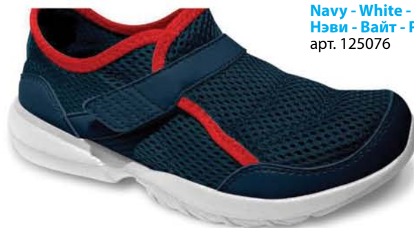
Navy - White - Red / Нэви - Вайт - Рэд арт. 125076