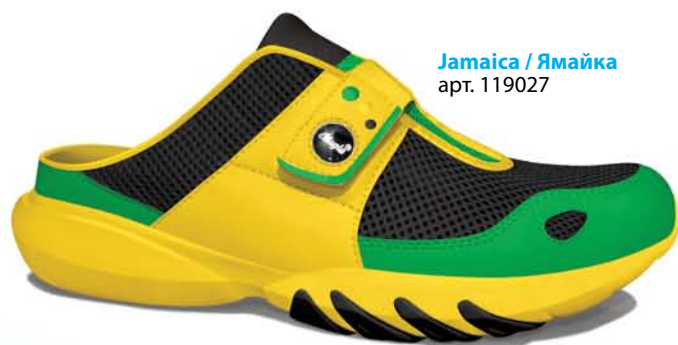
Jamaica / Ямайка арт. 119027