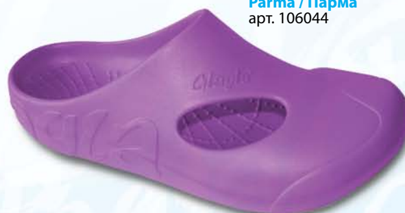
Parma / Парма арт. 106044