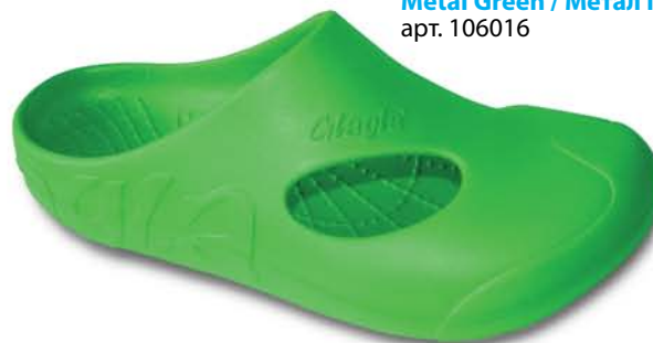
Metal Green / Метал Грин арт. 106016