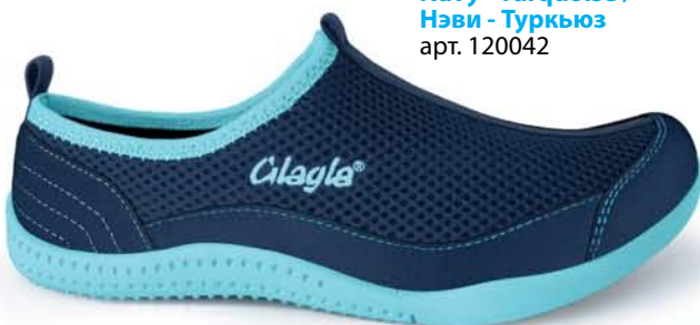
Navy - Turquoise / Нэви - Туркюз арт. 120042