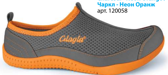
Charcoal - Neon Orange / Чаркл - Неон Оранж арт. 120058