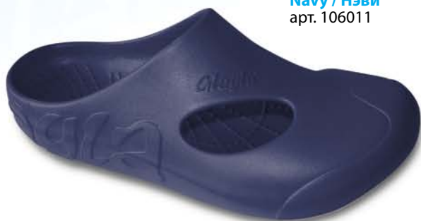
Navy / Нэви арт. 106011

Размеры: от 36 до 47 Материал верха: Neotech EVA Материал подошвы: Neotech EVA и резиновые вставки