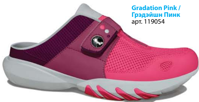
Gradation Pink / Грэдэйшн Пинк арт. 119054