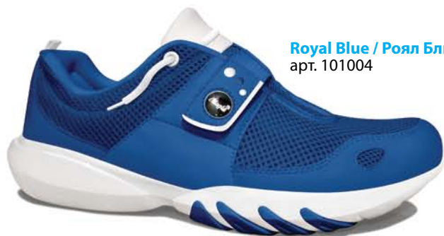
Royal Blue / Роял Блю арт. 101004