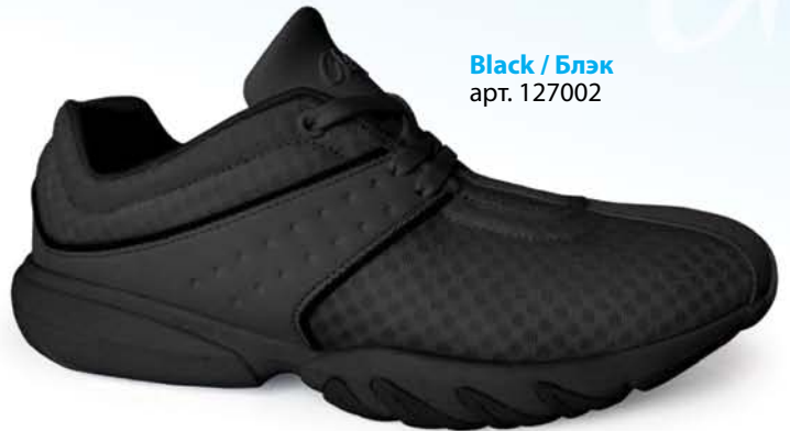
Black / Блэк арт. 127002