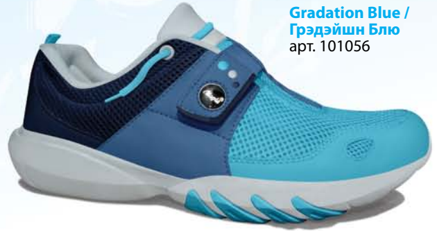
Gradation Blue / Грэдэйшн Блю арт. 101056