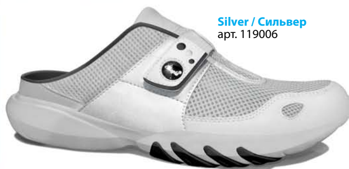
Silver / Сильвер арт. 119006