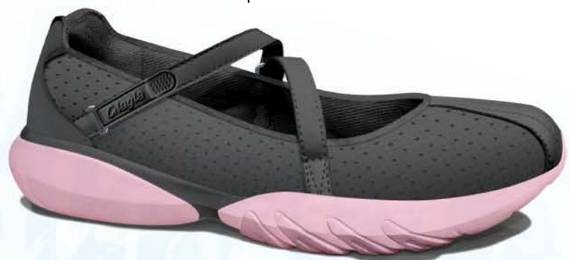
Charcoal - Pastel Pink / Чаркл - Пастел Пинк арт. 128060