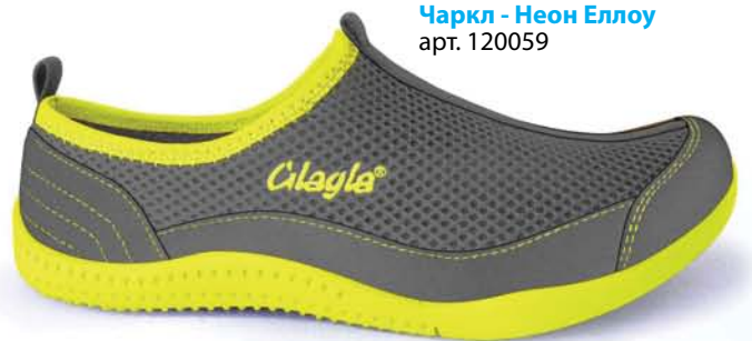
Charcoal - Neon Yellow / Чаркл - Неон Еллоу арт. 120059