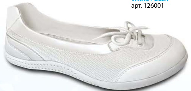
White / Байт арт. 126001