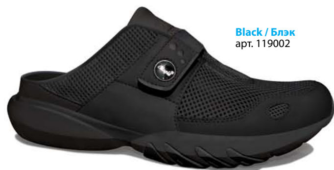
Black / Блэк арт. 119002

Сквозные вентиляционные прорези в подошве, расположенные в зонах повышенных температур.