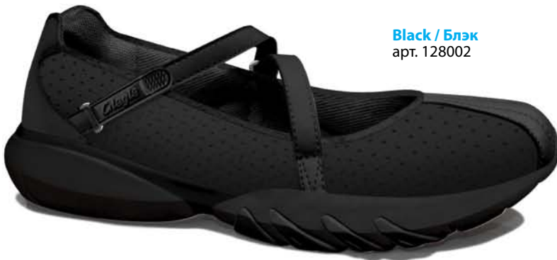
Black / Блэк арт. 128002

Сквозные вентиляционные прорези в подошве, расположенные в зонах повышенных температур.