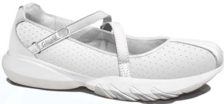
White / Вайт арт. 128001