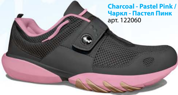
Charcoal - Pastel Pink / Чаркл - Пастел Пинк арт. 122060