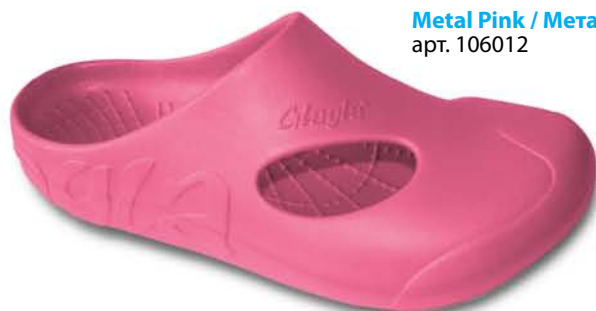
Metal Pink / Метал Пинк арт. 106012