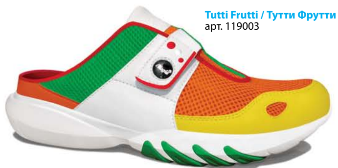
Tutti Frutti / Тутти Фрутти арт. 119003