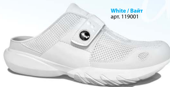
White / Вайт арт. 119001