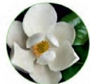
почки Магнолии (поддерживает светлый тон кожи, защита от UV ожогов, уменьшение раздражения)