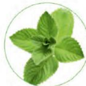
Листья сладкой мяты (успокаивает и расслабляет, антибактериальное действие)