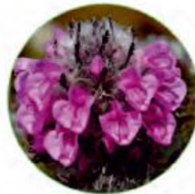
Мытник (эффективен против аллергии, для чувствительной кожи)

Комплекс растений с тонизирующими, смягчающими и лечебными свойствами