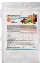
Гарнир «Овощной N1»

АКТИВНЫЕ КОМПОНЕНТЫ: кабачок, тыква, картофель сублимированные, корень сельдерея, корень имбиря, клетчатка пшеничная, специи, петрушка, укроп сушеные.