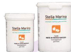
Скраб на основе фруктозы «Мате и гинкго билоба» Для тела | 1000 мл | 500 мл