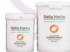
Обертывание липолитическое «Горячая гуарана» Разогревающее Для тела | 1000 мл | 500 мл