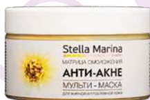
Маска «Анти-акне» для жирной и проблемной кожи 300 мл

АКТИВНЫЕ КОМПОНЕНТЫ: : комплекс АНА-44, комплекс Bio-Pol.