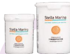
Лимфодренажное обертывание «7 водорослей» Для тела | 1000 мл | 500 мл