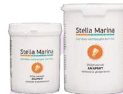
Обертывание питание и увлажнение «Амарант» Для тела | 1000 мл | 500 мл

АКТИВНЫЕ КОМПОНЕНТЫ: отвары шиповника и плодов рябины, масла облепихи, виноградной косточки, изофлавоны красного клевера (комплекс Sterocare), экстракт микроводорослей pollulanum (комплекс Phera-Tight™), экстракты виноградного листа, малины, побегов черники, эфирные масла грейпфрута, лимонграсса, ваниль.