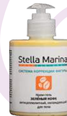
Крем-гель антицеллюлитный «Зеленый кофе» охлаждающий Для тела | 1000 мл | 500 мл