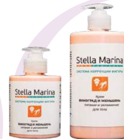
Крем «Виноград и женьшень» питание и увлажнение Для тела | 1000 мл | 500 мл