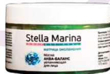
Маска «Аква-Баланс» Для лица | 250 мл

АКТИВНЫЕ КОМПОНЕНТЫ: комплекс Moist-24, низко- и высокомолекулярная гиалуроновая кислота, комплекс Pentavitin, экстракт 7-ми водорослей, Д-пантенол, аллантоин.