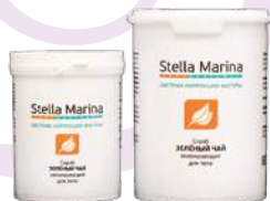
Скраб на основе морской соли «Зеленый чай» Для тела | 1000 мл | 500 мл

АКТИВНЫЕ КОМПОНЕНТЫ: масляные экстракты фукуса и ламинарии, масла зеленого кофе и виноградной косточки, измельченный лист зеленого чая, ментил лактат