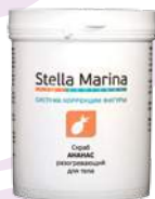
Скраб на основе фруктозы «Ананас» Для тела | 500 мл

Очищение кожи – первая стадия косметической процедуры, благодаря которой улучшается пенетрация активных компонентов в дерму. Линия Stella Marin aprofessional предлагает для очищения кожи тела коллекцию скрабов различной жесткости и термического воздействия, а также тоники для экспресс-очищения кожи на основе протеазы и растительных сапонинов.