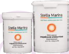
Обертывание моделирующее для тех, кому за 50 «Индийская хризантема» Термически нейтральное Для тела | 1000 мл | 500 мл