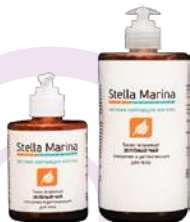
Тоник энзимный очищающий «Зеленый чай» Для тела | 700 мл | 300 мл

АКТИВНЫЕ КОМПОНЕНТЫ: экстракты зеленого чая, готу-колы, экстракт 7-ми водорослей, комплекс растительных сапонинов Phytofoam, протеаза Keratoline, аллантоин, Д-пантенол.