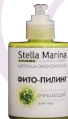
«Фито-пилинг» Очищающий Для лица | 300 мл