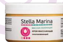
Крем массажный «Омолаживающий» 250 мл