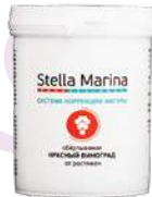
Обертывание от растяжек «Красный виноград» Для тела | 500 мл

АКТИВНЫЕ КОМПОНЕНТЫ: отвары солодки, ромашки, экстракты виноградного листа, виноградной косточки, виноградной кожицы, грецкого ореха, женьшеня, 7-ми водорослей, комплекс пептидов Regu-Strech, масло виноградной косточки.