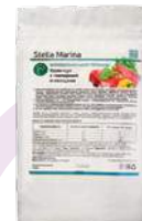
Крем-суп «Говядина с овощами»