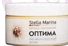
Крио-маска «Оптима» Для лица | 250 мл