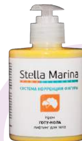
Крем-лифтинг «Готу-кола» Для тела | 700 мл | 300 мл

АКТИВНЫЕ КОМПОНЕНТЫ: отвары пассифлоры, шлемника, ромашки, экстракты 7-ми водорослей, виноградной косточки, виноградного листа, виноградной кожицы, сине-зеленых водорослей (комплекс Lanablu), женьшеня, масло какао, фосфолипиды (комплекс IsocellCare).