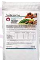
Кофе капучино «Восточные пряности»

АКТИВНЫЕ КОМПОНЕНТЫ: инулин, L-карнитин, коэнзим Q10, экстракты джемнемы, гарцинии камбоджийской, кофе натуральный, имбирь, корица.