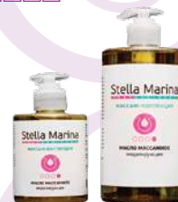
Масло массажное «Моделирующее»