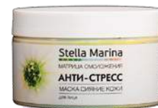
Маска «Антистресс» Для лица | 250 мл