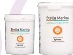
Обертывание омолаживающее «Цитрус С» Для тела | 1000 мл | 500 мл