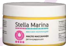
Масло массажное «Регенерирующее» 250 мл

АКТИВНЫЕ КОМПОНЕНТЫ: масла какао, облепиховое, виноградной косточки, масляный экстракт шиповника, эфирные масла грейпфрута, лимонграсса, ваниль.