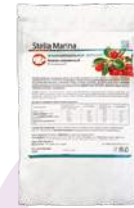
Кисель «Клюквенный» очищающий