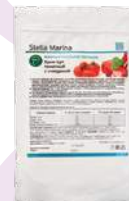
Крем-суп «Томатный с говядиной»