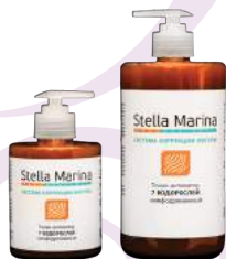
Тоник-активатор лимфодренажный «7 водорослей» 700 мл | 300 мл

АКТИВНЫЕ КОМПОНЕНТЫ: отвары фукуса, ламинарии, экстракты 7-ми водорослей, фукуса, ламинарии, мате.