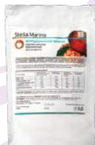
Горячий шоколад «Классический»

АКТИВНЫЕ КОМПОНЕНТЫ: инулин, L-карнитин, коэнзим Q10, экстракты джемнемы, гарцинии камбоджийской, какао-порошок.