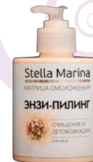
«Энзи-пилинг» Очищение и детоксикация Для лица | 300 мл