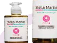
Масло массажное «Моделирующее» термоактивное