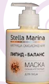
Маска «Липид-баланс» Для лица | 300 мл