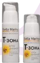
Крем дневной «Т - зона» для жирной и проблемной кожи 50 мл

АКТИВНЫЕ КОМПОНЕНТЫ: активные комплексы Trikenol, Canadian Willowherb, Phytotal OS, Bio-Pol, Matilook, масло тыквы, отвар шалфея, корня лопуха, хвоща, экстракт солодки, Д-пантенол, аллантоин.