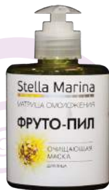
Очищающая маска «Фруто-пил» Холодное гидрирование Для жирной и проблемной кожи 300 мл