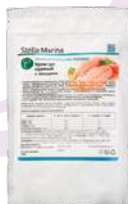
Крем-суп «Куриный с овощами»

АКТИВНЫЕ КОМПОНЕНТЫ: пептиды куриного мяса, сублимированные овощи, мясо курицы, куриный бульон, специи.