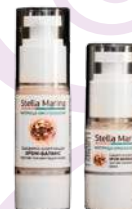
Сыворотка отбеливающая «Хром-баланс» 30 мл