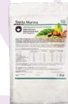
Кофе капучино «Классический»