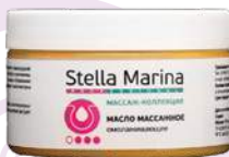
Масло массажное «Омолаживающее» Для тела | 250 мл

АКТИВНЫЕ КОМПОНЕНТЫ: масло карите, масло каштана капского, масло зеленого кофе, масляный экстракт водорослей, шиповника, душицы, липы, коэнзим Q10.