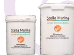
Обертывание липолитическое «Имбирь и розмарин» Термически контрастное Для тела | 1000 мл | 500 мл