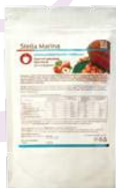
Горячий шоколад «Ореховый»

АКТИВНЫЕ КОМПОНЕНТЫ: инулин, L-карнитин, коэнзим Q10, экстракты джемнемы, гарцинии камбоджийской, экстракт грецкого ореха, какао-порошок.