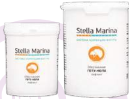
Обертывание - лифтинг «Готу-кола» Для тела | 1000 мл | 500 мл

АКТИВНЫЕ КОМПОНЕНТЫ: отвары плюща, фукуса, ламинарии, экстракты готу-колы, зеленого чая, гинкго билоба, 7-ми водорослей, экстракт микроводорослей pollulanum (комплекс Phepa-Tight™).