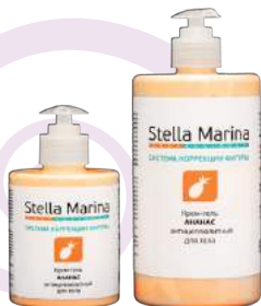
Крем-гель антицеллюлитный «Ананас» Термически нейтральный Для тела | 700 мл | 300 мл

АКТИВНЫЕ КОМПОНЕНТЫ: отвары фукуса, ламинарии, плюща, сок ананаса, экстракты 7-ми водорослей, гуараны, гинкго билоба, зеленого кофе, масло каштана, экстракт индийской хризантемы (комплекс Lanachryls), кофеин и карнитин (комплекс Vexel).