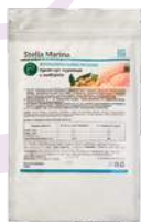
Крем-суп «Куриный с имбирем»

АКТИВНЫЕ КОМПОНЕНТЫ: пептиды куриного мяса, сублимированные овощи, мясо курицы, куриный бульон, имбирь, специи.