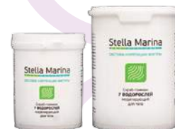
Скраб-гоммаж «7 водорослей» Средней дисперсности Для тела | 1000 мл | 500 мл

АКТИВНЫЕ КОМПОНЕНТЫ: масло авокадо, масло миндальное, измельченная морская раковина, экстракт зеленого чая, экстракт фукуса, экстракт ламинарии.