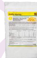
Белковый коктейль «Злаковый»