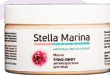
Маска «Трио-лифт» Для лица | 250 мл

Маски для лица – это эффективный и давно зарекомендовавший себя элемент наружной терапии. В ассортименте линии «Матрица омоложения» представлены маски увлажняющего, противовоспалительного, стимулирующего, анти-акне действия, а также маски для возрастных клиентов. Сочетание их с профессиональными концентрированными сыворотками делает процедуры более эффективными и разноплановыми.