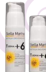
Гель-сыворотка матирующая «Т-зона+6» 50 мл