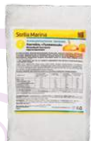
Белковый коктейль «Тыквенный»

АКТИВНЫЕ КОМПОНЕНТЫ: изоляты сывороточного и соевого белков, казеинат, инулин, олигофруктоза, отруби пшеничные, клетчатка пшеничная, экстракты гуараны, женьшеня, гарцинии камбоджийской, сублимированные тыква, кабачок, морковь, L-карнитин, коэнзим Q10.