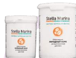
Обертывание липолитическое «Холодный кофе» Охлаждающее Для тела | 1000 мл | 500 мл