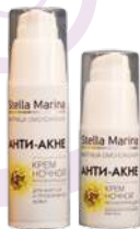
Крем ночной Регенерирующий «Анти-акне» 50 мл

АКТИВНЫЕ КОМПОНЕНТЫ: растительные комплексы Regu-seb, Canadian Willowherb, Phytotal AI, Abessin, комплекс фосфолипидов Isocell Care, масло тыквы, отвар шалфея, корня лопуха, хвоща, Д-пантенол, аллантоин.