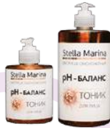
Тоник «рН-Баланс» Для лица | 300 мл

АКТИВНЫЕ КОМПОНЕНТЫ: экстракт кипрея канадского (Canadian Willowherb), комплекс Phyttotal AI, Аллантоин, бисаболол, Д-пантенол, молочная кислота.