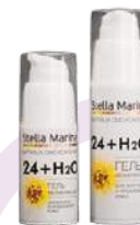
Гель увлажняющий «24+H2O» для жирной и проблемной кожи 50 мл