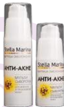
Мульти-сыворотка «Анти-акне» для жирной и проблемной кожи 50 мл

АКТИВНЫЕ КОМПОНЕНТЫ: растительные комплексы Trikenol, Canadian Willowherb, Phytotal OS, Bio-Pol, Matilook, отвар шалфея, хвоща, корня лопуха, Д-пантенол, аллантоин.