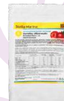
Белковый коктейль «Яблочный»