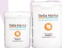
Обертывание микроциркуляторное «Каштан» Охлаждающее Для тела | 1000 мл | 500 мл