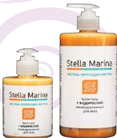
Крем-гель лимфодренажный «7 водорослей» Для тела | 700 мл | 300 мл

АКТИВНЫЕ КОМПОНЕНТЫ: отвары фукуса, ламинарии, экстракты 7-ми водорослей, фукуса, ламинарии, зеленого кофе, гуараны, готу-колы, масло каштана, экстракт индийской хризантемы (комплекс Lanachryls), глауцин (комплекс Bodyfit).