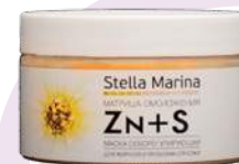
Маска себорегулирующая «Zn+S» для жирной и проблемной кожи 300 мл