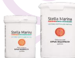
Лимфодренажное обертывание «Бурый водоросль» Для тела | 1000 мл | 500 мл