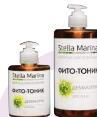
«Фито-тоник» Демакияж 300 мл