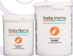
Обертывание липолитическое «Ананас» Термически нейтральное Для тела | 1000 мл | 500 мл

АКТИВНЫЕ КОМПОНЕНТЫ: отвары плюща и хвоща полевого, мякоть ананаса, экстракты ананаса, гуараны, готу-колы, 7-ми водорослей, индийской хризантемы (комплекс Lanachrys), масло зеленого кофе, кофеин и карнитин (комплекс Vexel).