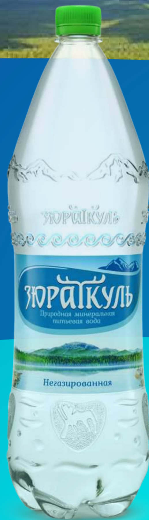
1,5 литра Негазированный