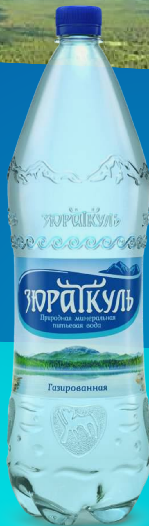
1,5 литра Газированная