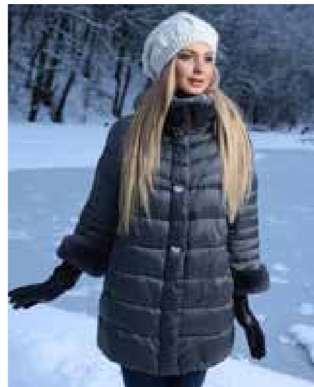
DW1631 | 44—56 | т.-сталь