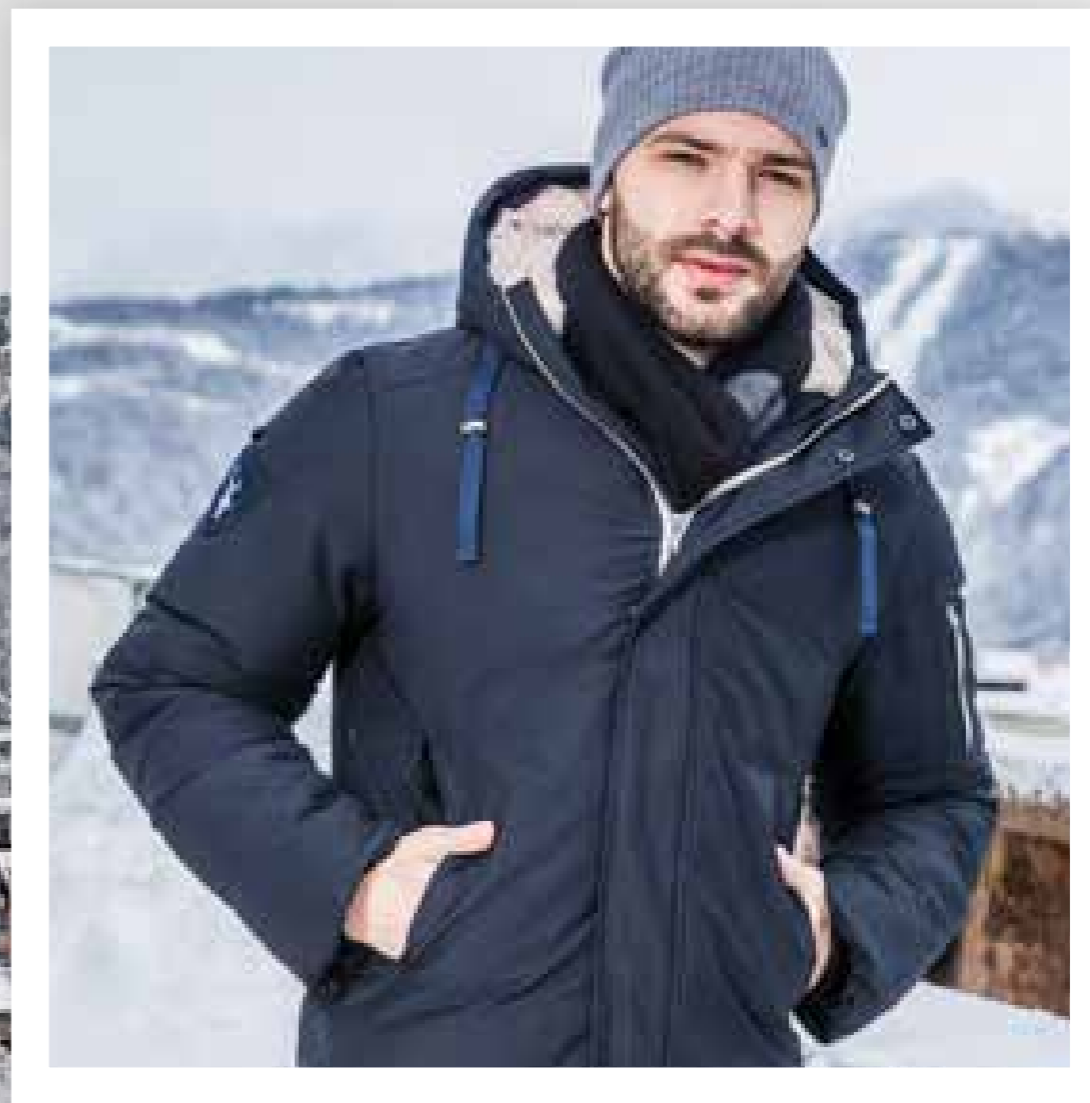
DM1606 | 46—56 | т.-синий