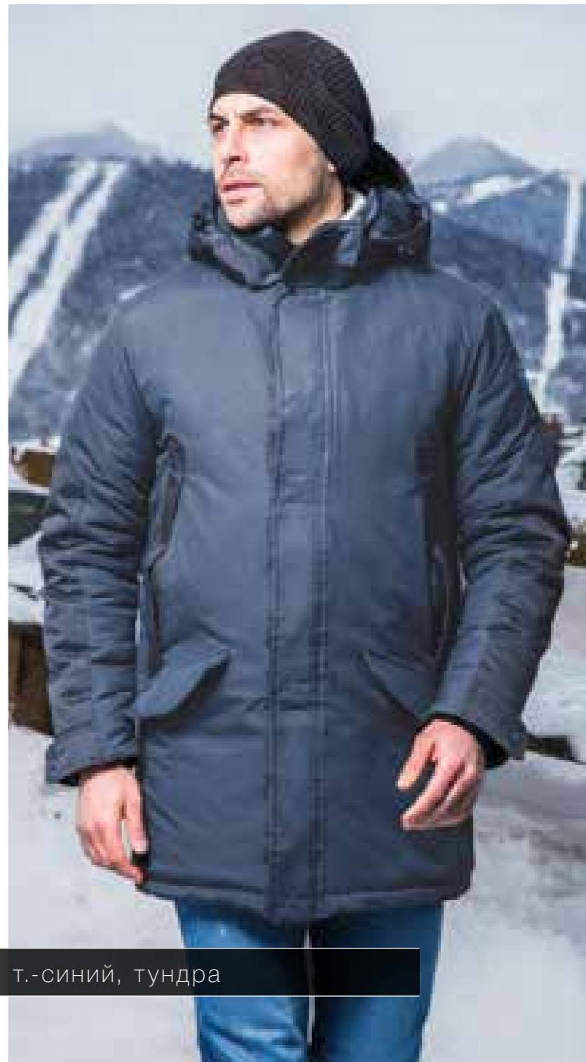
DM1614 | 48—60 | т.-синий, тундра