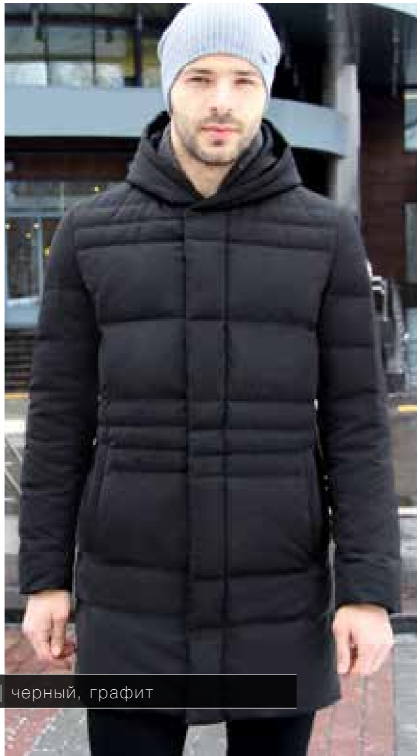
DM1620 | 48—60 | черный, графит