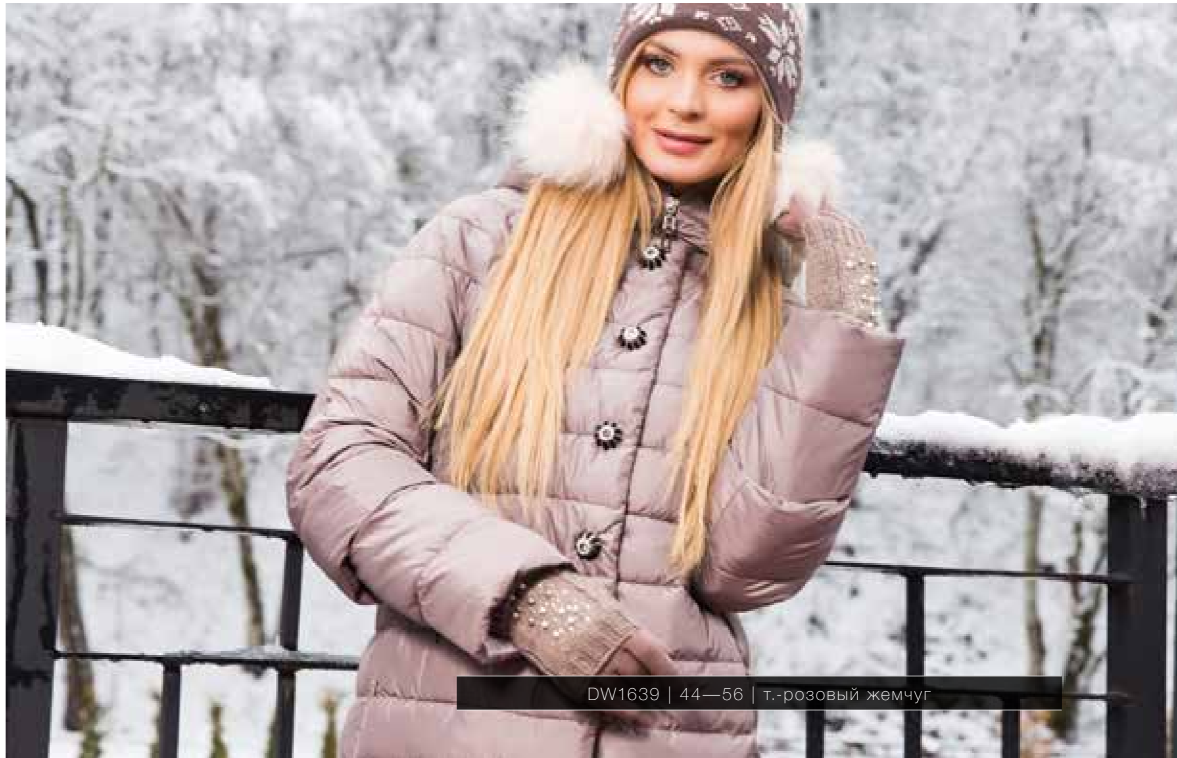
DW1639 | 44—56 | т.-розовый жемчуг