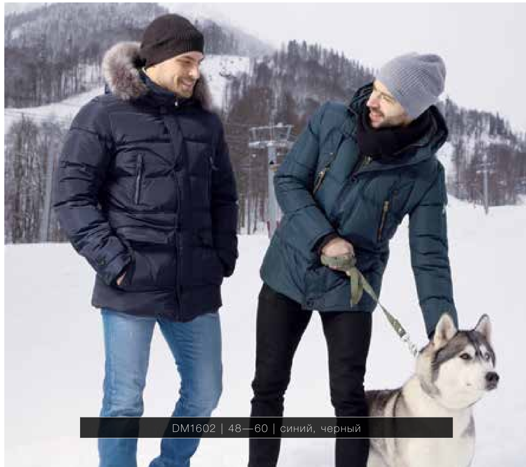
DM1602 | 48—60 | синий, черный