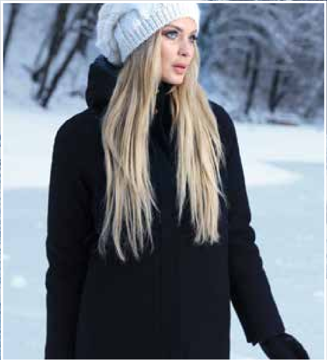
DW1626 | пальто и куртка «2 в 1» | 44—52 | черный