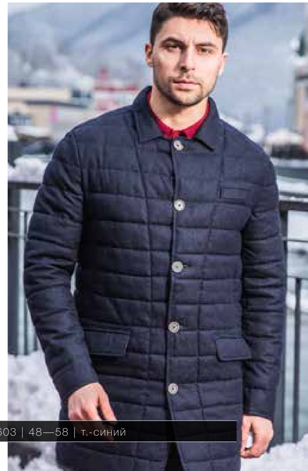
CM1603 | 48—58 | т.-синий