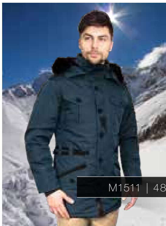
M1511 | 48—58 | т.-красный, гор. шоколад, бирюзовый