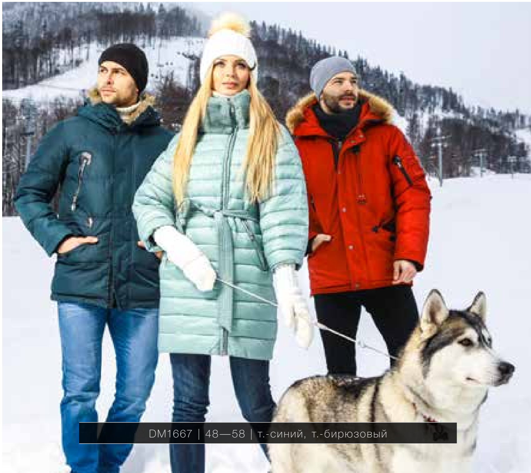
DM1667 | 48—58 | т.-синий, т.-бирюзовый