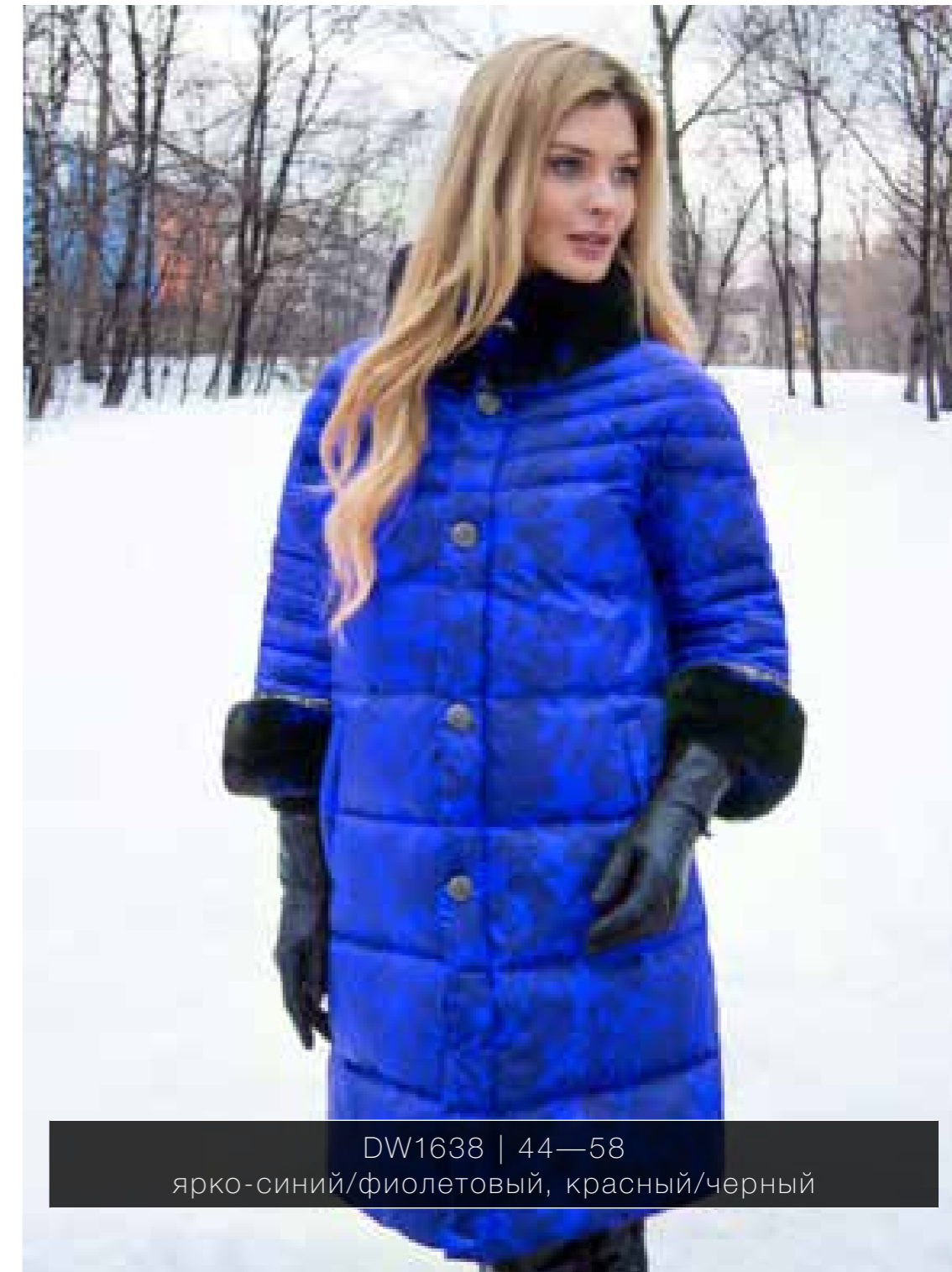
DW1638 | 44—58 ярко-синий/фиолетовый, красный/черный