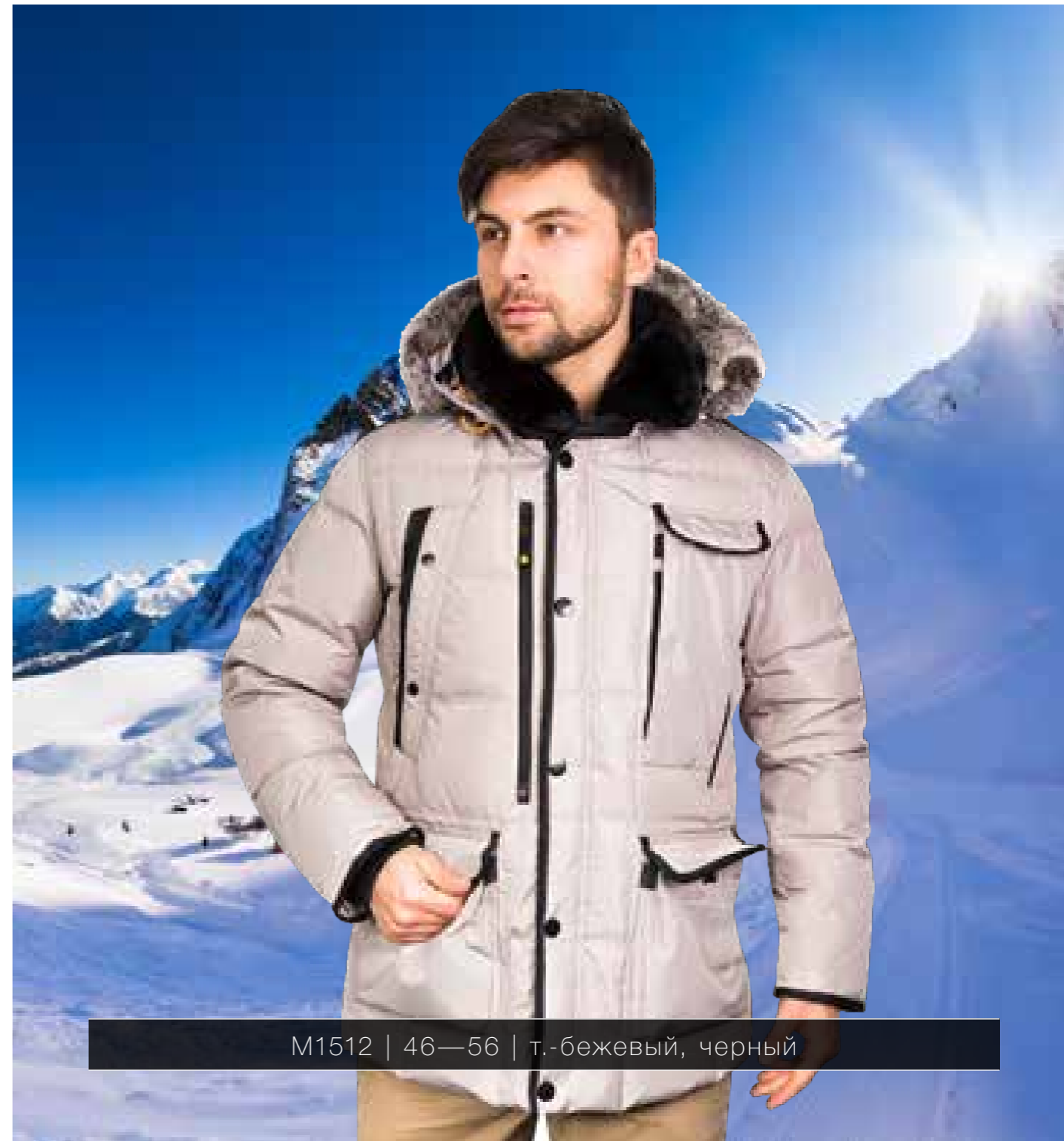
M1512 | 46—56 | т.-бежевый, черный