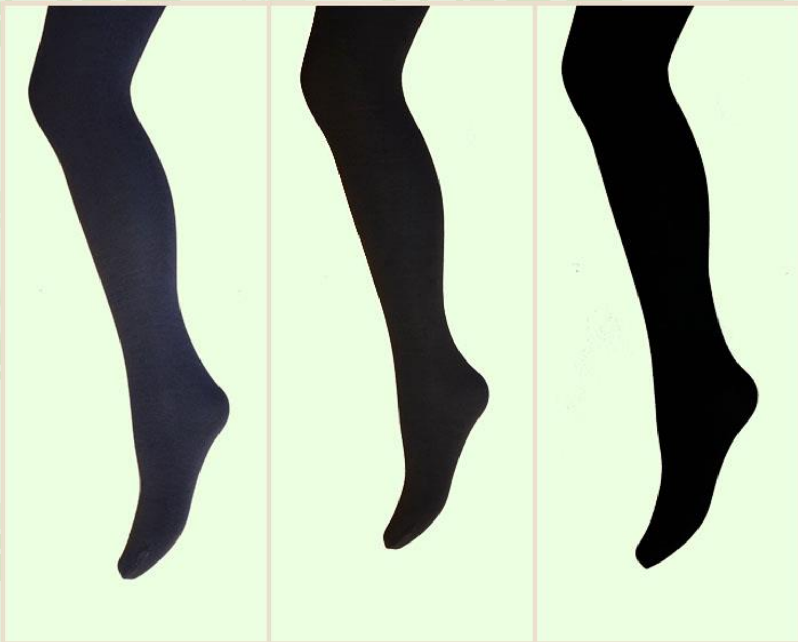
Графит, коричневый, черный