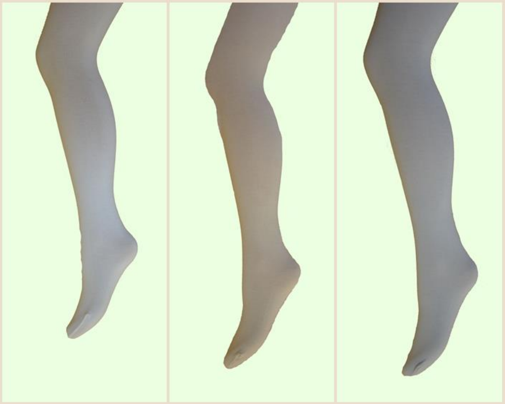
Белый, бежевый, светло-серый